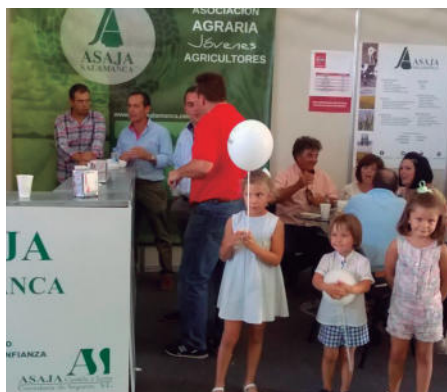
Expositor en Salamaq 2016.

dar una imagen enquistada en el pasado, la opa intenta hacerse un hueco año tras año.