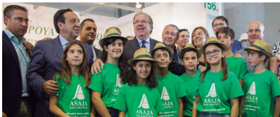
Con los distintos representantes, en Salamaq 2018.