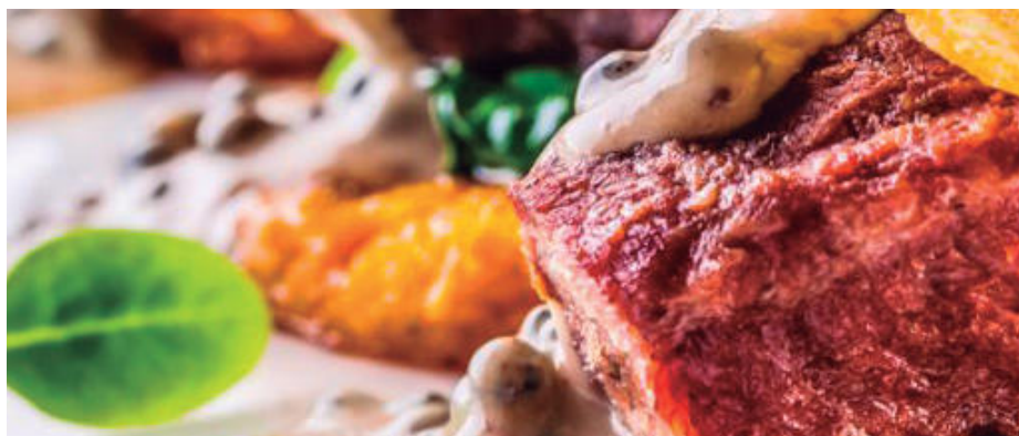
Propuesta de presentación de www.interporc.com .

Interporc en su página web propone una receta a base de carrilleras de cerdo que podemos aplicar a nuestro menú.