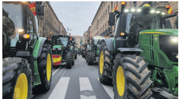
Tractores, colapsando Gran Vía.