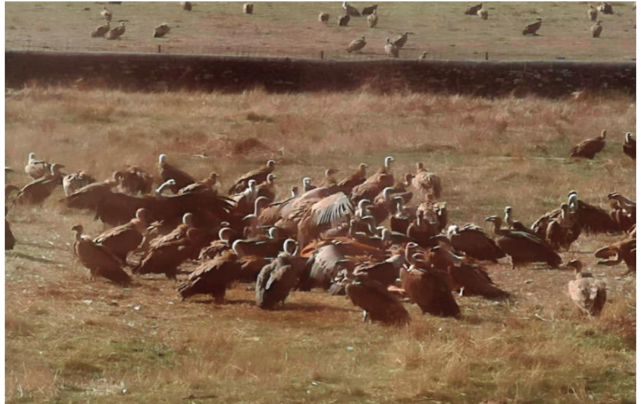
En la imagen superior, buitres; en la imagen inferior, ataque de meloncillos en San Pedro de los Rozados.

ASAJA Salamanca denuncia dos ataques en el período de 10 días a una ganadería de San Pedro de los Rozados, dentro de la comarca del Campo Charro.