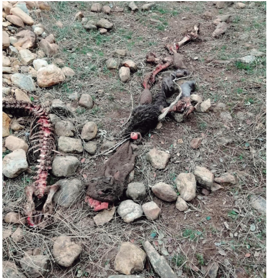
Arriba, huesos del ternero; abajo, reproductora.

ASAJA Salamanca insiste una vez más a la Junta de Castilla y León que ampare, “en el sistema compensatorio de daños por fauna salvaje, indemnizaciones por los que causan los buitres. Las rapaces han cambiado, desde hace años, su modo