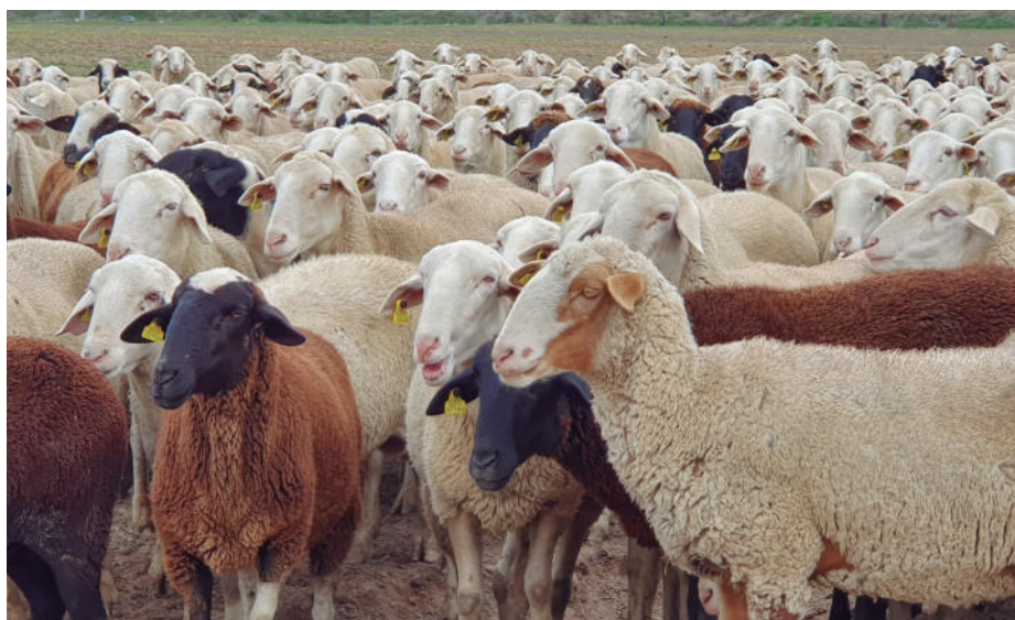
Una explotación de ovino, en la provincia de Salamanca.

En este aspecto, la provincia de Salamanca recibirá 610.284 euros. ●