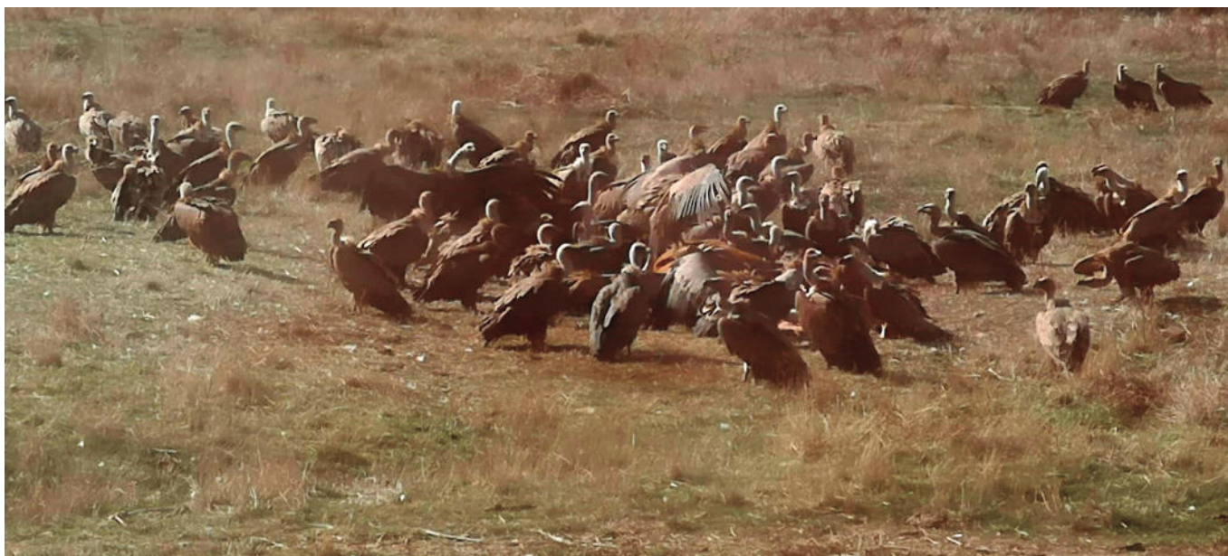
En la imagen superior, buitres devorando una vaca en la provincia de Salamanca.

ASAJA Salamanca anima a los ganaderos a denunciar los hechos para elaborar un censo por los daños de las rapaces