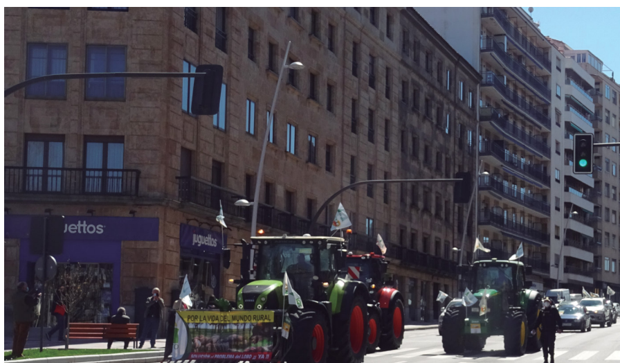
El tractor de ASAJA Salamanca lideró la manifestación.

Éxito rotundo en la manifestación, celebrada el 24 de marzo, contra la sobreprotección del lobo