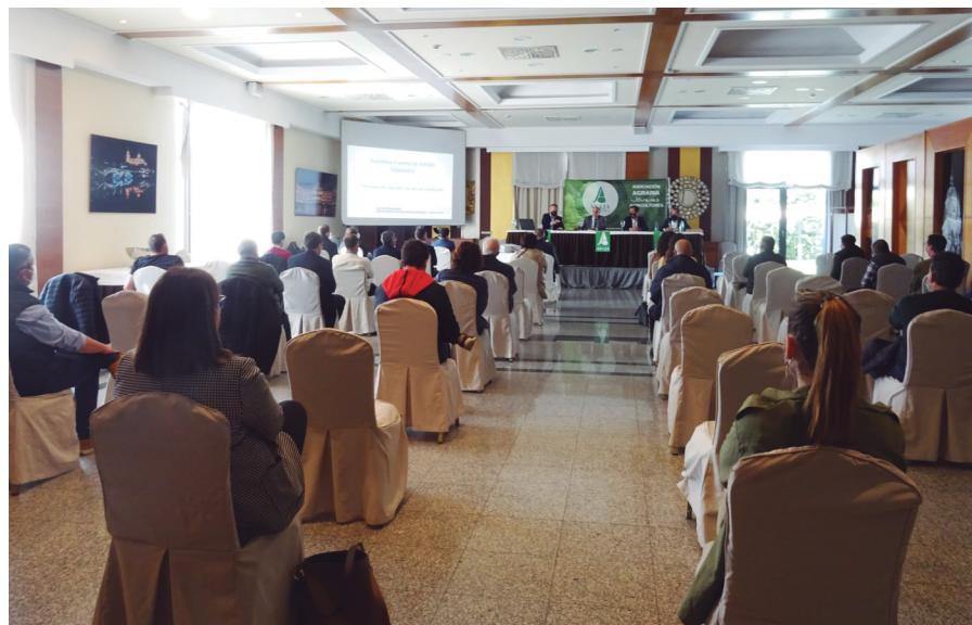
Asistentes, durante la 30ª Asamblea General.

Los presidentes, provincial y regional, lamentaron además los