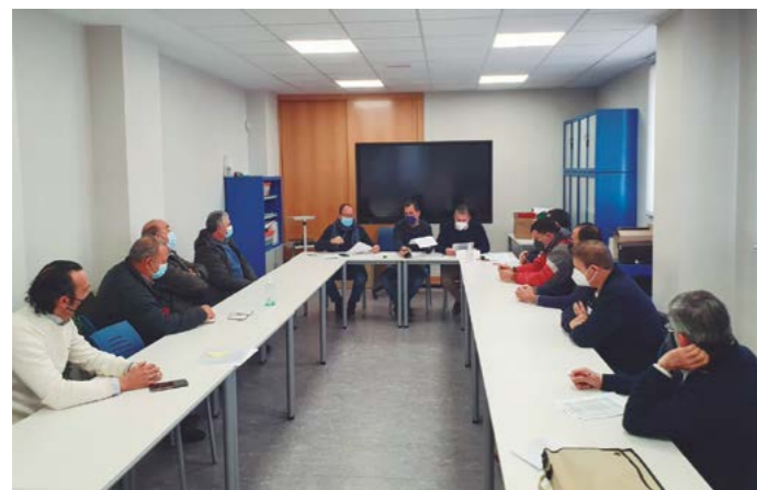
Sectorial de cereales de ASAJA Salamanca, celebrada el 21 de marzo de 2022.

ASAJA Salamanca solicitó a las administraciones que tomen medidas urgentes por las que el agricultor evite 'la tentación' de no sembrar o abandonar determinados cultivos ante las desorbitadas facturas a las que se exponen, cada día, a causa de los precios en las tarifas eléctricas o el gasoil. Situaciones que preocupan al sector para la siembra de la futura campaña y por las que ya se percibe un cambio de tendencia en los cultivos, como es el caso del maíz, en la provincia salmantina. Éste fue uno de los temas que trató ASAJA Salamanca en la sectorial de cereales que celebró el lunes, 21 de marzo, donde se analizaron otras posturas respecto al funcionamiento de la Lonja, la revisión de los seguros agrarios que penalizan por siniestros que no se pueden controlar ya que son causados por la climatología, el ánimo al cooperativismo agrario, y la petición de poder utilizar los barbechos en esta campaña, que más tarde la Administración dio luz verde. ●