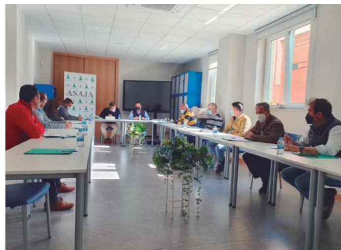
Sectorial de vacuno de ASAJA Salamanca, celebrada el 21 de abril de 2022.

La sectorial de vacuno de ASAJA Salamanca se reunió el pasado 21 de abril, un día después de que salieran los datos oficiales de la campaña de saneamiento de 2021 de la Junta de Castilla y León. Ninguno de los representantes de la organización se explica cómo ha podido subir la incidencia de la tuberculosis en la provincia de Salamanca, después de las restricciones a los ganaderos de la provincia, asfixiados por las medidas de control que impone la administración regional.