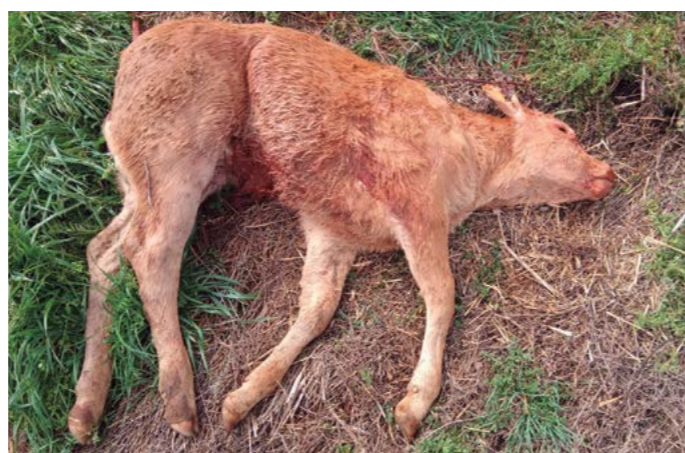
Sectorial de vacuno de ASAJA Salamanca, celebrada el 21 de abril de 2022.

El último suceso denunciado por la OPA tuvo lugar en La Mata de Ledesma, donde las aves acabaron con la vida de una ternera. ●