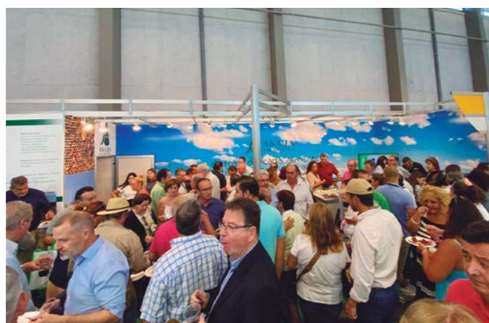
El expositor de ASAJA Salamanca, con socios y simpatizantes.

ASAJA no desperdició la ocasión de contar un año más con un expositor en el pabellón central, lugar donde se propicia un espacio de charla distendida con socios y visitantes que quieran información y aquellos que deseen pasar un buen rato con el agradable ambiente que se genera en la feria.. ●