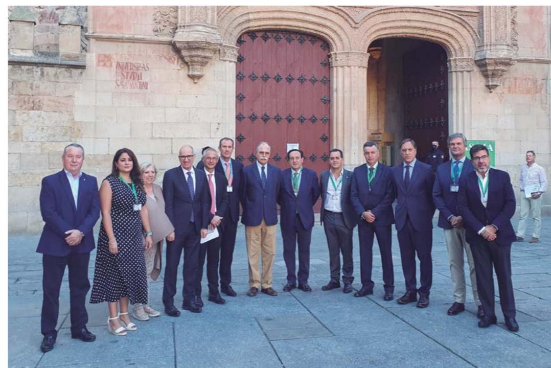
Representantes de ASAJA y CAP, frente a la fachada de la Universidad de Salamanca.