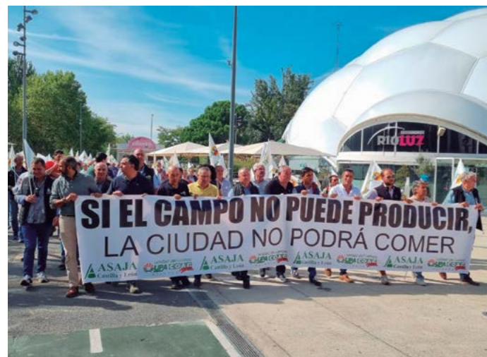
La manifestación trascurrió por las calles de Valladolid el 23 de septiembre.

ASAJA Salamanca se manifestó el pasado 23 de septiembre en Valladolid, junto a la regional, para reclamar soluciones a los altos costes de producción que soportan los agricultores y ganaderos y que, por ello, se pone en peligro la producción agraria de la campaña. La subida generalizada que han sufrido todo tipo de útiles como carburantes, abonos, fitosanitarios, semillas, piensos, electricidad, agua, plásticos... está llevando al límite a los agricultores y ganaderos, con el riesgo de que esta situación provoque el desabastecimiento de alimentos en las superficies comerciales, al no poder asumir las explotaciones familiares los elevadísimos gastos para ponerse a producir alimentos.