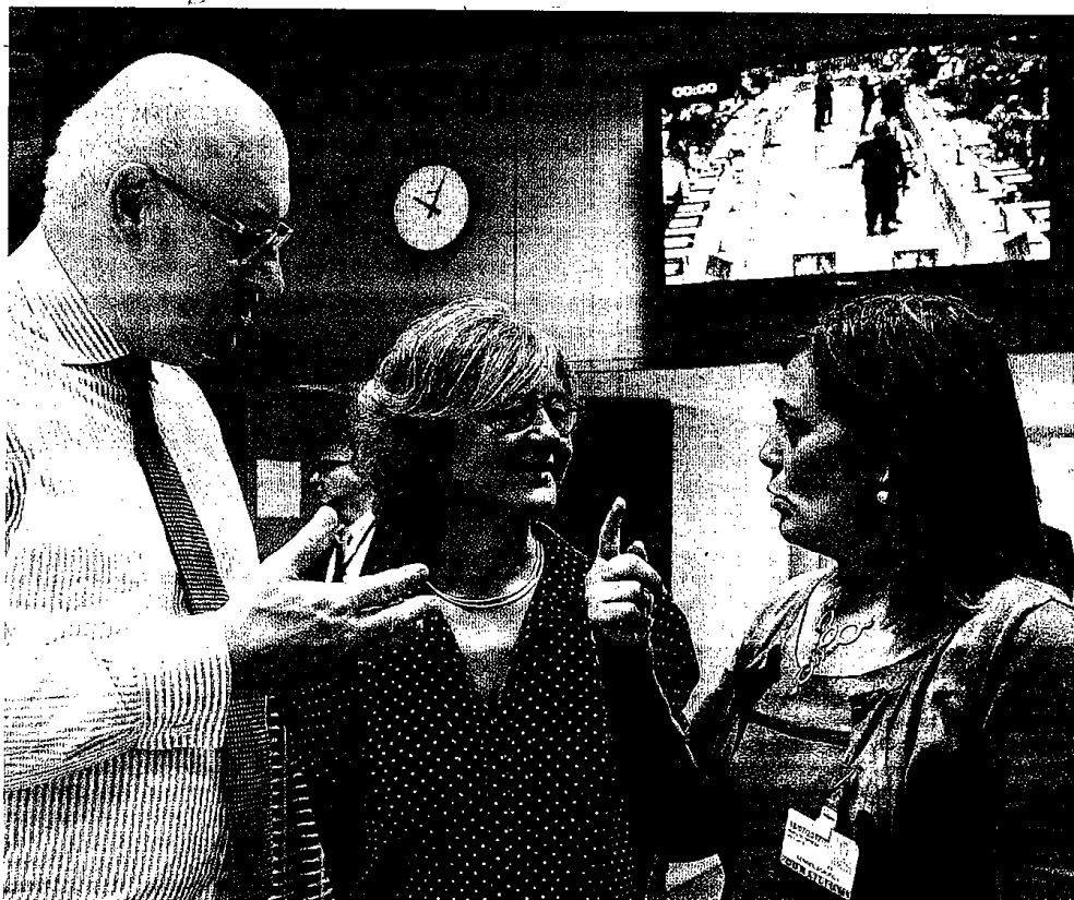
La ministra y la consejera conversan con el Comisario Europeo de Agricultura y Desarrollo Rural, Phil Hogan

«Deriva de un seguimiento de imágenes vía satélite que permiten la identificación de los cultivos sin necesidad de hacer esos controles de campo», de-