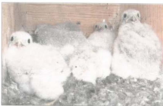
Polluelos nacidos en una de las cajas instaladas.

En total, 240 cajas-nido en el entorno de Villalón, que podrían am-