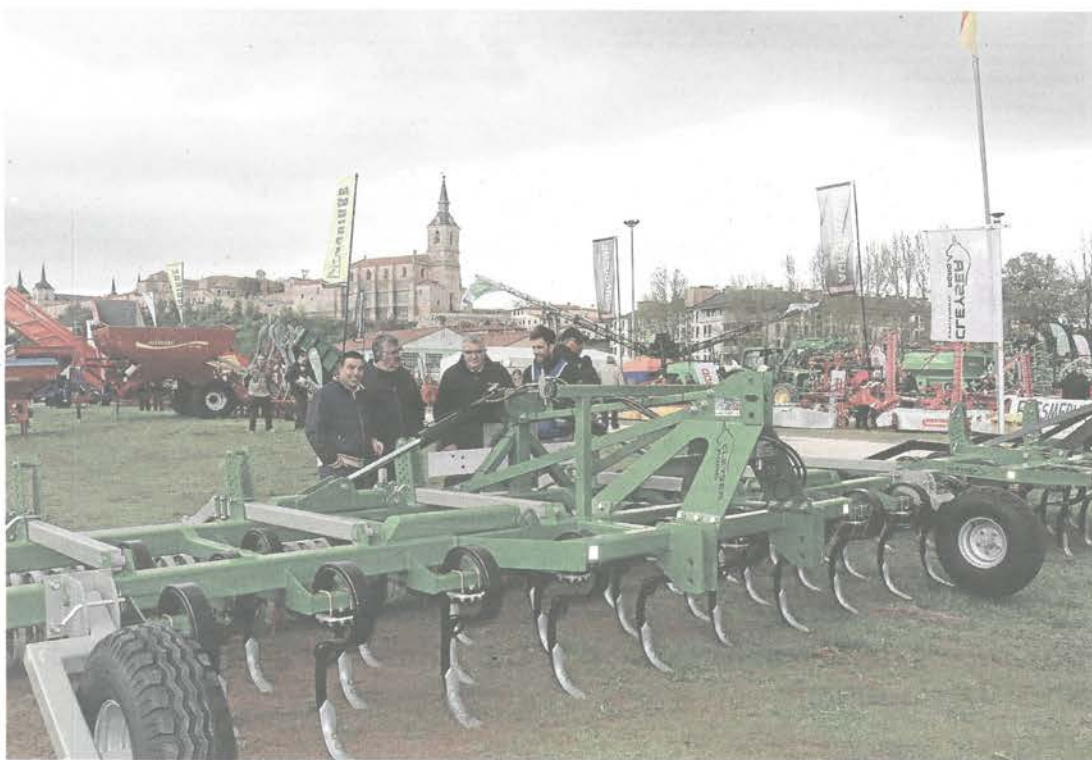
Feria de Maquinaria Agrícola de Lerma.

Para los fabricantes, los distribuidores y las marcas que participan en el encuentro profesional, la feria es un lugar idóneo para mostrar los últimos avances tecnológicos y, sobre todo, hacer contacto con clientes potenciales. Sin