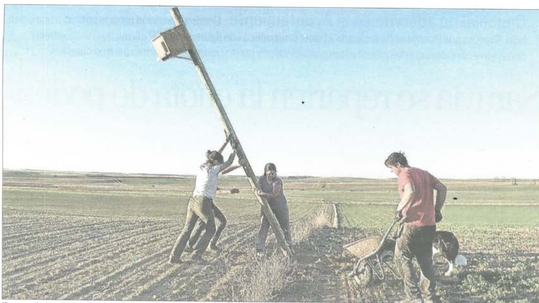
Un grupo de trabajo instala una caja nido en una tierra de cultivo de Cuenca de Campos el pasado año.