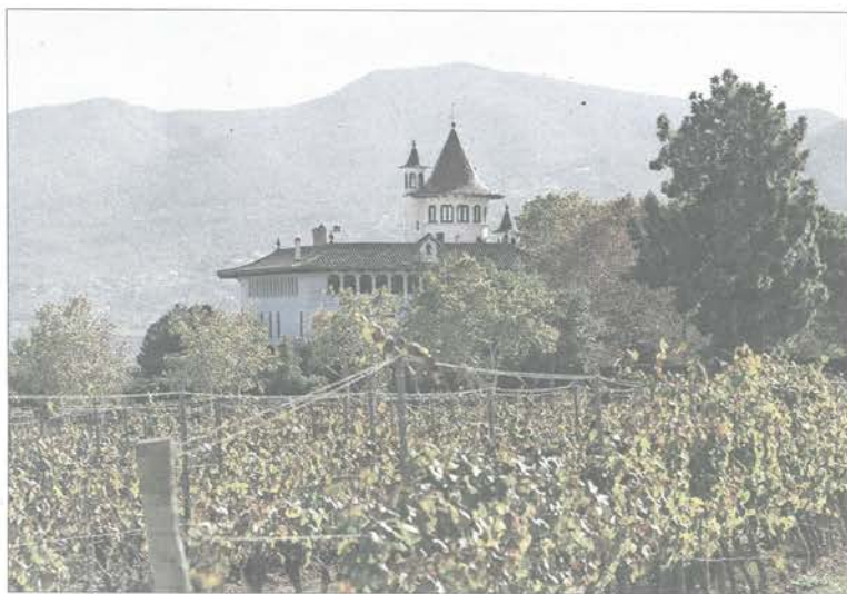
Campos de Codorniu en Sant Sadurn d'Anoia.

17 elaboradores dejan la Denominación de Origen y crean una marca propia para reivindicar el espumoso de calidad