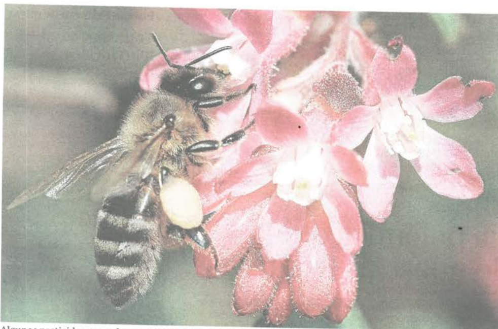
Algunos pesticidas, como los neonicotinoides, son la causa del descenso de la población de abejas