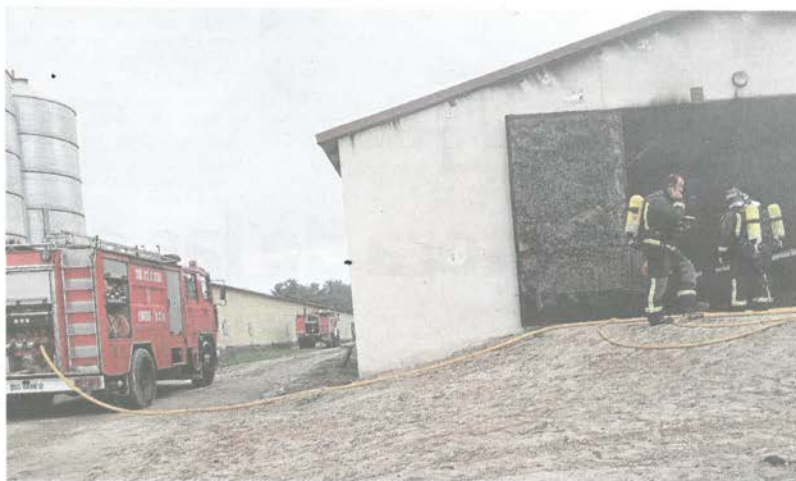
Intervención de los bomberos en la granja avícola de la localidad segoviana de Mudrián.

los municipios de San Martín y Mudrián cuatro bomberos con dos camiones autobomba, aunque cuando llegaron probablemente habían muerto la mayoría de los pollos.