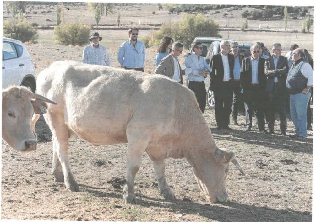
Miembros de la UE, ayer en su visita a una explotación de ganado en extensivo en la provincia de Ávila

En este sentido, apuntó que «la primera alternativa es ver qué medidas de prevención pueden ser más eficaces y cuándo», para, después, si eso no funciona, ejercer un control de la población del lobo viendo «en qué con-