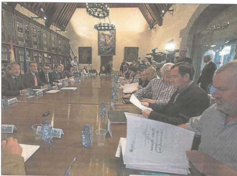
Asistentes a la reunión con representantes de la Unión Europea celebrada ayer en Ávila.

Al respecto, elogió los posibles efectos positivos que podría tener el «Plan de Acción para la naturaleza, las personas y la economía», cuyo