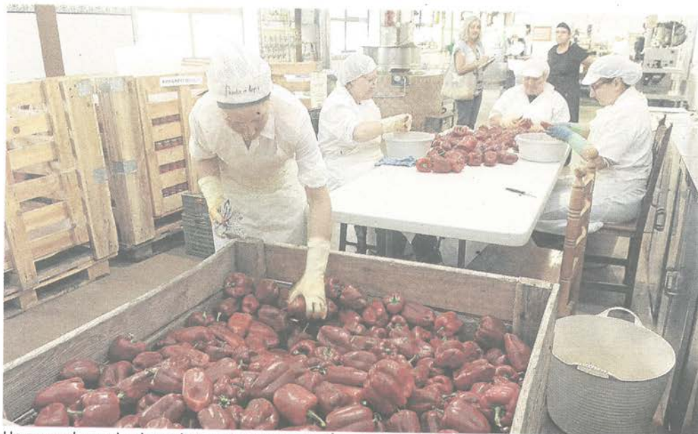
Un grupo de empleadas trabaja en la elaboración industrial de pimientos asados en El Bierzo.

El informe pone de relieve que el sector agroalimentario en Castilla y León basa buena parte de su negocio en las exportaciones. En el año 2017, la región exportó alimentos por valor de 1.967 millones de euros, lo que supone una subida del 7,6% respecto a 2016. También aumentó ligeramente el número de empresas exportadoras en la región, que pasó de 1.688 en 2016 a 1.711 en 2017.