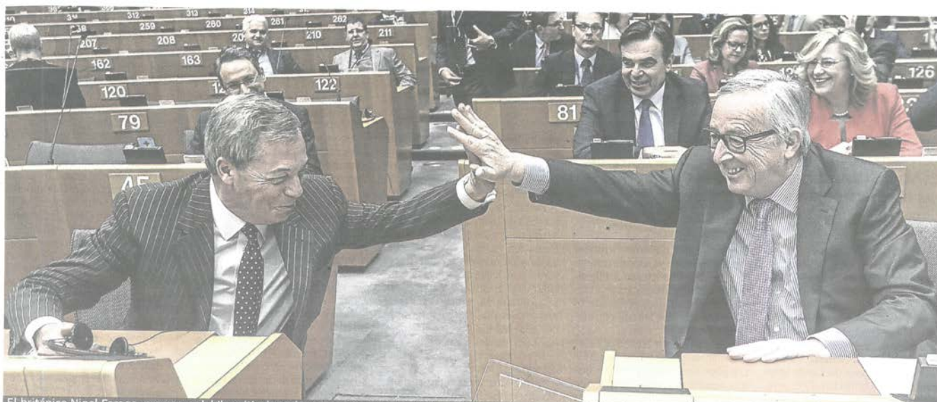
El británico Nigel Farage, precursor del 'brexit', choca las manos con el presidente de la Comisión, Jean-Claude Juncker, ayer en la Eurocámara.

La Comisión propone además crear tres nuevas fuentes de ingresos, cuyo objetivo es reducir las aportaciones nacionales de los Estados, que en la actualidad financian el 80%. En primer lugar, una tasa al plástico de 0,80 euros por kilo no reciclado. También pide quedarse con el 20% de los ingresos procedentes del sistema de comercio de emisiones de CO2. Finalmente reclama un 3% del impuesto de sociedades cuando se cree una base tributaria armonizada en la UE.