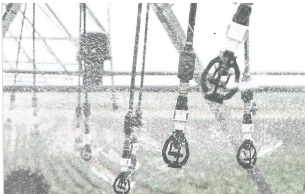
El sector apuesta por la modernización de regadíos y el uso de energías renovables para ahorrar costes y optimizar el uso del agua.