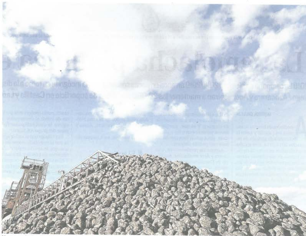
Montones de remolacha acumulados en plena campaña de recepción en la fábrica de Acor en Olmedo.

Por eso, han propuesto a la Junta un Plan que abarca la modernización de 40.000 hectáreas en zonas de sondeos de aguas subterráneas. Un impulso que se debe unir, en su opinión, a otras medidas para ser más competitivos, en la línea del ahorro de costes, un abonado eficiente o distintos ajustes en la tarifa eléctrica.