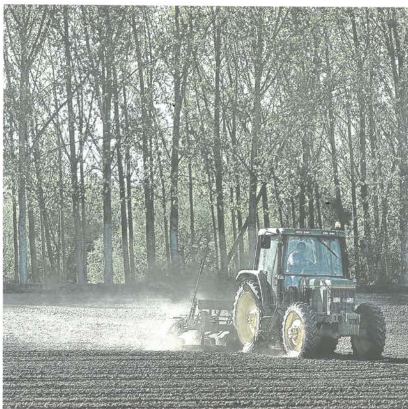
Un agricultor realiza distintas labores en el campo en una parcela de la provincia de Salamanca.