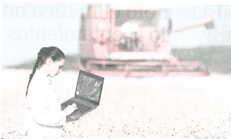
Peritaje de una parcela agrícola en Castilla y León.

¿Y el fraude? Grigelmo dice que es «inexistente». Sobre todo hoy en día, pues basta una tablet para acceder a la base de datos del Sigpac, los números de cada parcela, la ubicación exacta o las características de cada póliza. «Más que de fraudes hablaría de picarresca», agrega García, cuya percepción de «fraude cero» no quita para recordar, junto a Grigelmo, anécdotas de antaño como las de algún que otro agricultor que solo quería enseñar las zonas más afectadas e incluso «vender» como suyas tierras dañadas del vecino.