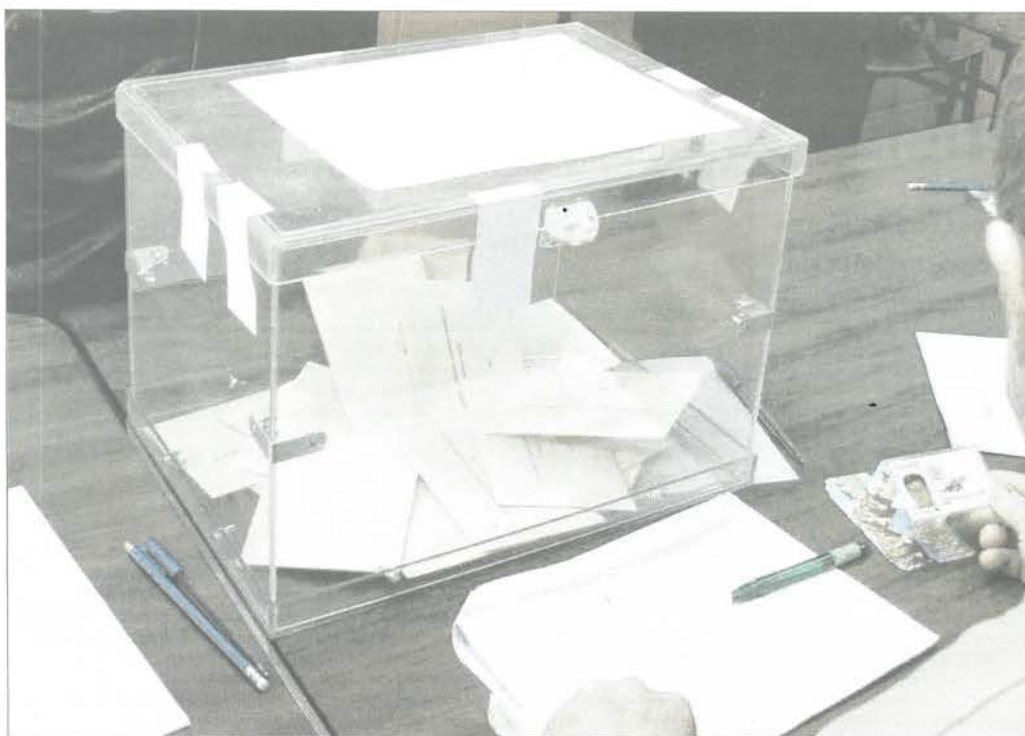
Un momento de la votación en las últimas elecciones agrarias de 2012.