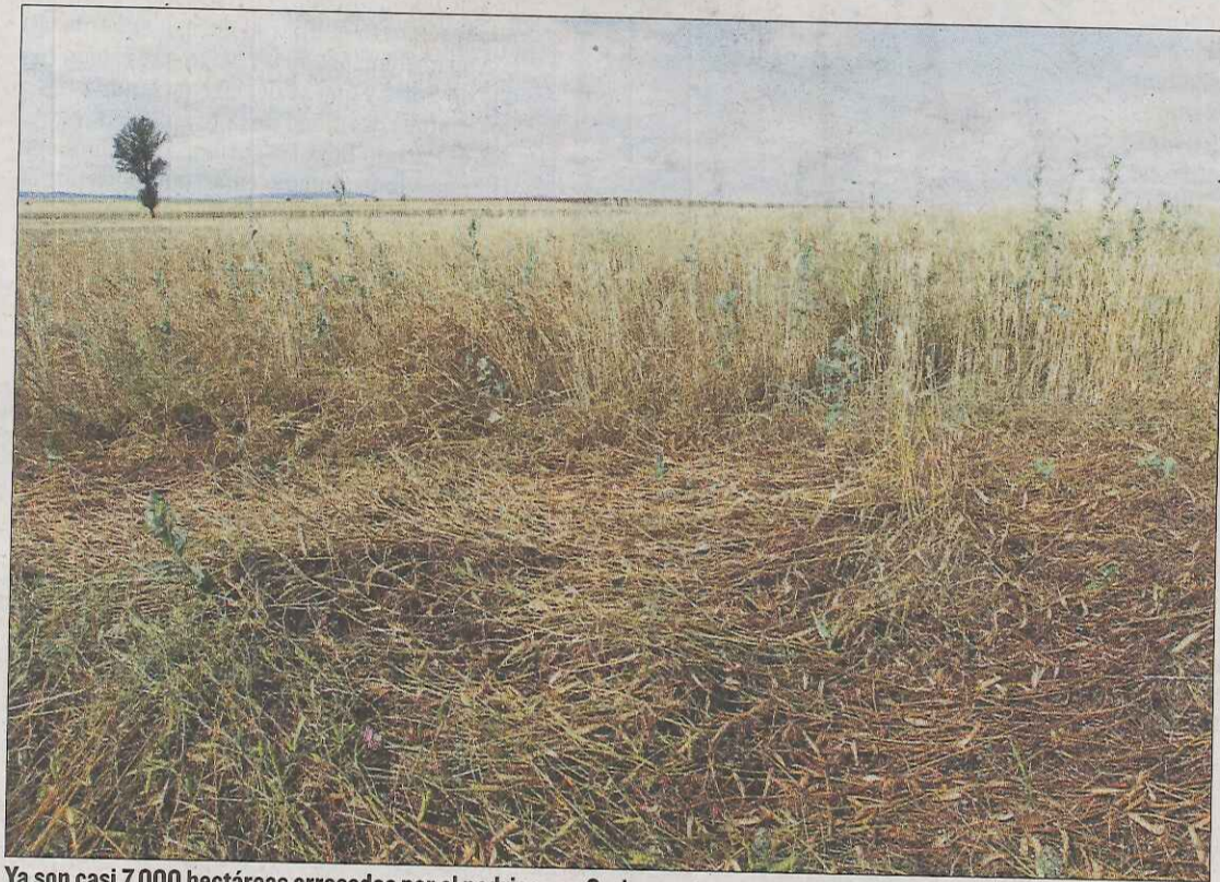
Ya son casi 7.000 hectáreas arrasadas por el pedrisco en Soria.

Así, a las casi 1.000 hectáreas afectadas por las tormentas del Lunes de Bailas y del Martes a Escuela (el 1 y 2 de julio) se suman otras 6.000 arrasadas el lunes. Y la zona más dañada ha resultado esta vez Campo de Gómara, con 2.044 hectáreas (de 1.827 parcelas), lo que supone que casi un