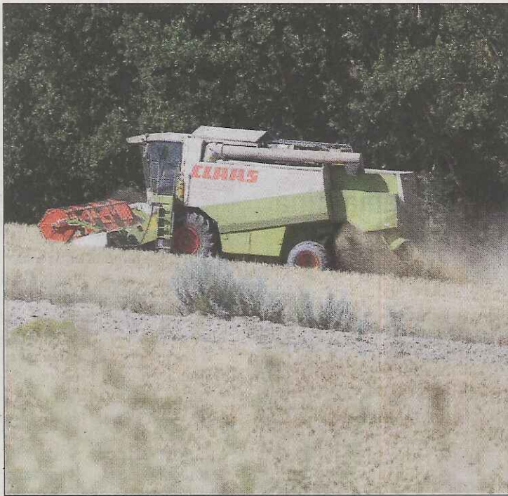
Una cosecha dora recorre el campo de cultivo . v.g.