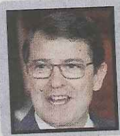
PRESIDENTE Alfonso Fernández Mañueco

El nuevo Gobierno autonómico de coalición PP-Cs que preside Alfonso Fernández Mañueco cuenta con una vicepresidencia, para su socio de gobierno Francisco Igea, y diez consejerías, con la nueva de Transparencia, Ordenación del Territorio y Acción Exterior, para el propio Igea, y ocho viceconsejerías, además de las gerencias regionales de Sanidad y de Familia e Igualdad de Oportunidades. El organigrama está casi cerrado, a falta de dos altos cargos por designar.