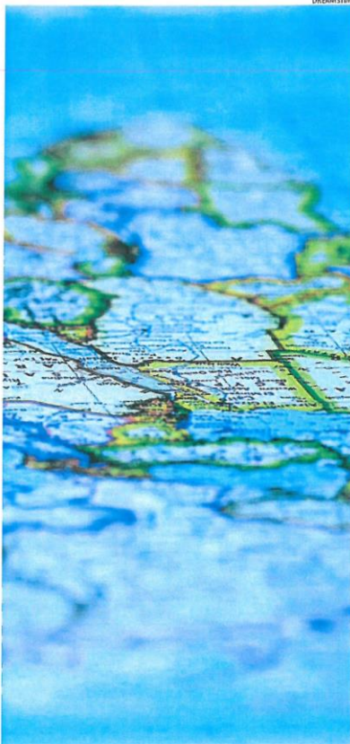
En el sur de Europa, los verdes no tienen tanto peso político todavía. En España, por ejemplo, solo cuentan con un diputado en el Parlamento

puesta a la crisis de los chalcos amarillos con intención de que articularan en una serie de medidas un objetivo: reducir las emisiones de efecto invernadero francesas un 40% en la próxima década. Entre las propuestas presentadas se incluye bajar el límite máximo de velocidad en carretera a los 110 km/h, la renovación energética de los edificios para 2040, reducir el uso de fitosanitarios en el campo o garantizar una alimentación más vegetal.