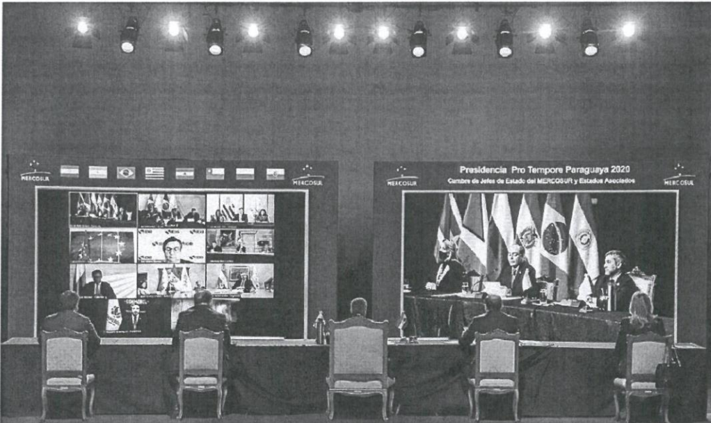
El presidente de Paraguay, Mario Abdo Benítez (C), preside una reunión virtual de líderes del bloque comercial Mercosur, ayer, en Asunción (Paraguay).

► CONDICIONALIDAD. La idea inicial era condicionar el desembolso de dinero a la aprobación de reformas. Todos están de acuerdo. Cada país enviará un Plan Nacional y tendrá que ir demostrando que va poniéndolos en marcha. Sin embargo, para los frugales no es suficiente. No se fían del llamado Semestre Europeo y las recomendaciones específicas de la Comisión. Y no aceptan siquiera la opción de la llamada Comitología , que es un proceso que implica a los gobiernos nacionales, pero que da la primacía a la Comisión. Y por eso quieren un mecanismo nuevo que permita a las capitales tener más peso y pronunciarse sobre los planes y el cumplimiento de los mismos.