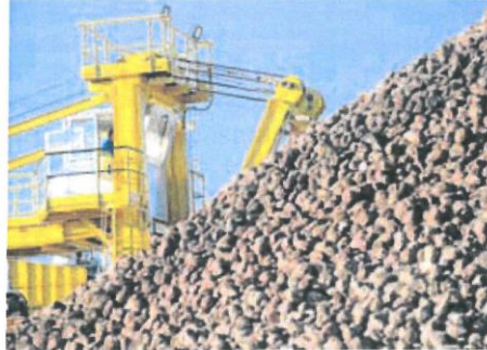
Instalaciones de Acor en Olmedo.

El comprador, un fondo de inversión, transfirió seis millones de euros a la firma de la operación en marzo y antes del 30 de junio ha efectuado otro ingreso por importe de 9.817.879 euros. Este segundo pago estaba ajustado en 10 millones pero sujeto al análisis técnico solicitado por el comprador, que una vez valorado el estado de la instalación, ha penalizado una posible pérdida