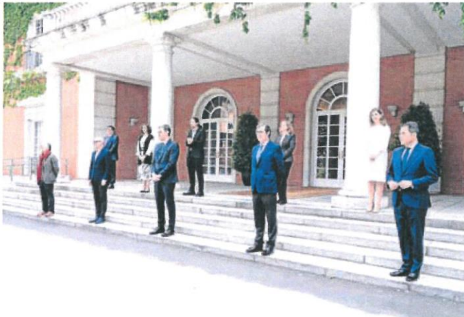
El presidente del Gobierno (centro) junto a ministros, líderes de la patronal y sindicatos, en La Moncloa.

Esta edición del renove estará dotada con 250 millones de euros, que se sumarán a los 100 millones del Moves para eléctricos, después de que las matriculaciones estén cayendo un 50% en lo que va de año con 340.000 vehículos comercializados desde enero. Las ayudas priorizarán los modelos eficientes, de forma que la adquisición de turismos con etiqueta 'Cero' se subvencionará con 4.000 euros, mientras que si se compra un modelo 'Eco' se recibirán entre 600 y 1.000 euros y entre 400 y 800 euros si tiene etiqueta 'C' (diésel y gasolina). Las pymes, recibirán 3.200 euros para los 'Cero', de entre 500 y 800 euros para los 'Eco' y de entre 350 y 650 euros para los 'C'.