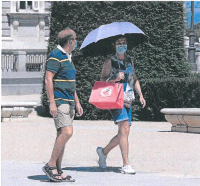
Das personas pasean por el centro de Madrid a pleno día bajo un fuerte calor.

Asimismo, el nivel del mar ha acelerado su subida. Y la extensión del hielo marino del Ártico en 2019 estuvo por debajo de la media, siguiendo la senda iniciada en los años 80, en la que cada década ha tenido una superficie helada menor que la anterior. La extensión de la cobertura de nieve en el hemisferio norte estuvo el año pasado cerca del promedio, pero en las últimas décadas se ha reducido de forma significativa, sobre todo en primavera.