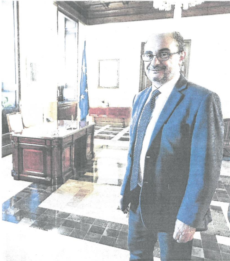
El presidente del Gobierno de Aragón, Javier Lambán, posa en su despacho.

El político no duda en afirmar que las comunidades autónomas con retos demográficos comunes «no podemos esperar más». «Es por ello que intentamos asumir este reto y la lucha contra la despoblación a través del ejercicio de nuestras