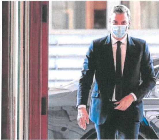
El presidente Pedro Sánchez confirmó ayer su ofensiva fiscal

En el caso germano, la reforma fiscal abarca reducciones en el IVA de tres puntos porcentuales hasta dejarlo en el 16% en el tipo general y de dos puntos hasta situarlo en el 5% en el caso del tipo reducido. El objetivo: fomentar el consumo y la inversión para