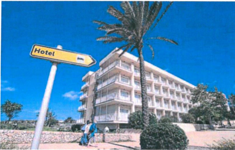
Varias personas caminan junto a un hotel cerrado en Menorca.