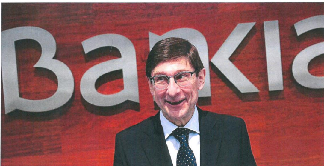
El presidente de Bankia, José Ignacio Goirigolzarri, en la presentación de resultados de la entidad.