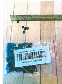
En España la norma incluye cerca de 200 especies invasoras

España no es el único país donde se han producido estos misteriosos envíos. Las autoridades de Alemania, Francia, Irlanda, Países Bajos, Reino Unido y Estados Unidos, Canadá, India o Japón también han alertado de estos eventos. De hecho, el departamento de