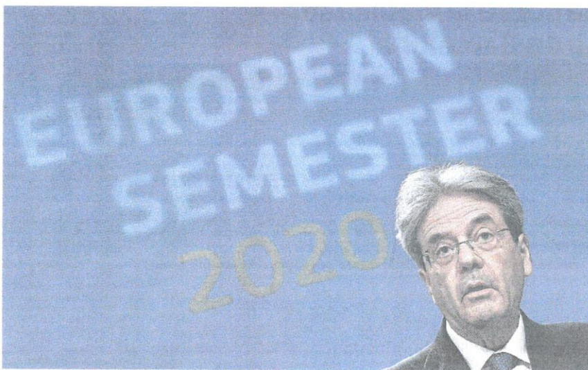
El comisario europeo de Economía, Paolo Gentiloni, ayer en rueda de prensa.

La cláusula de «escape» se desactivará «cuando se llegue a las condiciones necesarias. Y puede haber divergencias así que eso también habrá que tenerlo en cuenta a la hora de comprometer los nuevos objetivos», ha señalado el comisario de Economía, Valdis Dombrovskis. Un año, como poco. Bruselas volverá a leer la cartilla.