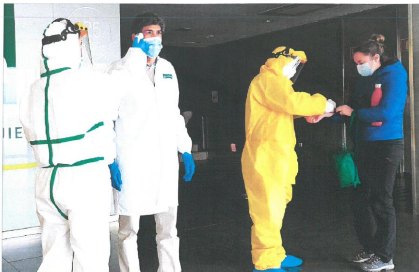
Personal de Galletas Gullón con equipos de protección en la fábrica de Aguilar del Campoo.