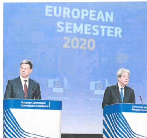
Dombrovskis, Gentiloni y Schmit, de izquierda a derecha, ayer en Bruselas

deberán volver a ser aplicadas. «Cuando las condiciones económicas lo permitan, las políticas fiscales deberían tener como objetivo alcanzar una posición fiscal prudente a medio plazo y a garantizar la sostenibilidad de la deuda, a la vez que se impulsa la inversión» ha dicho el responsable del Ejecutivo comunitario. Además, cuando se apruebe el fondo de recuperación que está siendo diseñado por la Comisión, su aplicación en los países que necesiten más ayudas, entre los que se encuentra España, deberá estar condicionada a las prioridades de las instituciones comunitarias y a las recomendaciones del semestre europeo. Su colega, el comisario de Economía Paolo Gentiloni, reiteró esta idea de condicionalidad que acababa de mencionar el vicepresidente para subrayar que efectivamente «habrá una conexión entre las recomendaciones y el plan europeo de recuperación». El plan de recuperación se pretende conectar con el presupuesto europeo y su diseño ha de ser aprobado por los países miembros. Francia y Alemania han propuesto un fondo basado en 500.000 millones en inversiones no reembolsables, pero otros países insisten en