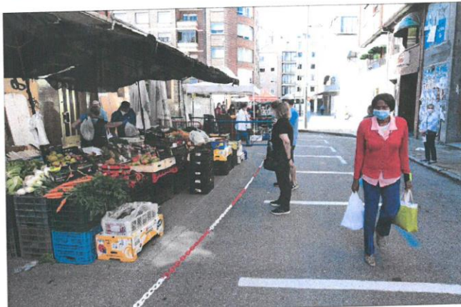
Puestos de verduras en el primer día de actividad en el mercado de Ponferrada durante la fase 1.

De momento, la reapertura mercadillo textil que semanalmente se habilita en distintos puntos de la ciudad tendrá que esperar. Según detalla la concejala de Comercio, Lola Ovejero, fue el propio sector quien tomó la decisión ante la imposibilidad de ubicar todos los puestos en un mismo emplazamiento. Se barajó la opción del «sorteo», pero los vendedores veían «más viable esperar a que haya menos restricciones», de tal manera que se les permita «aumentar el aforo».