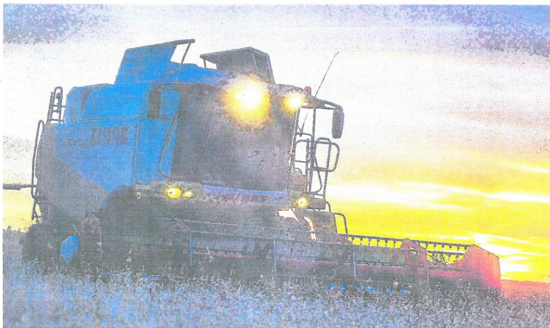
La digitalización del campo ha de ir de la mano de una agricultura sostenible. / PABLO LORENTE