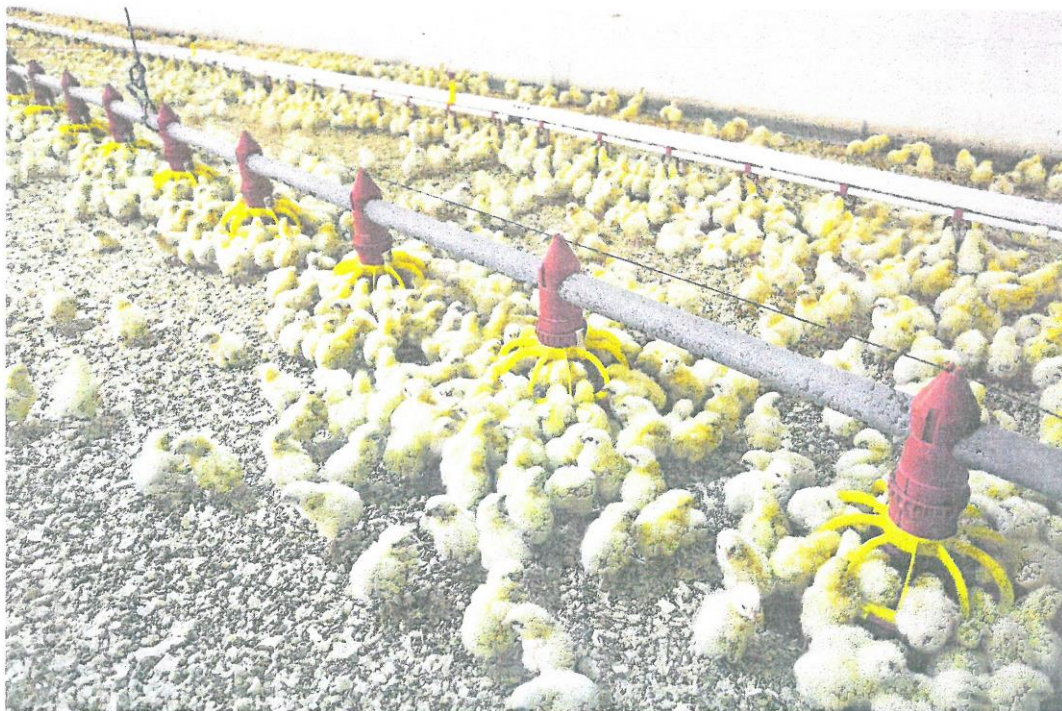
Los pollos que no tienen salida comercial deben seguir siendo alimentados en granja, con los gastos que eso conlleva.