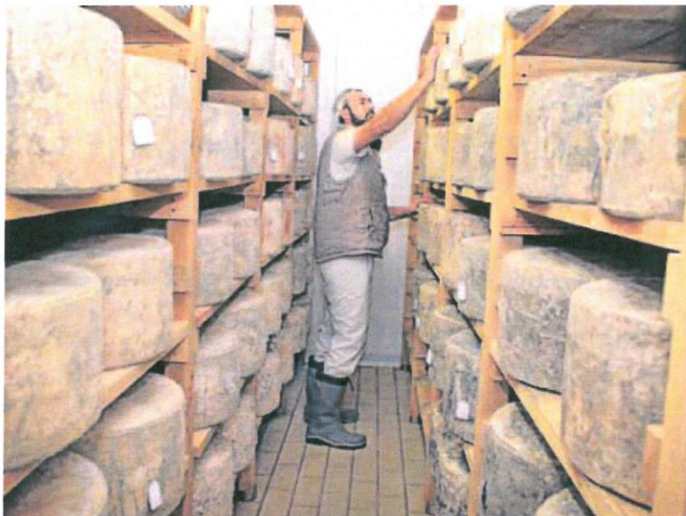
Quesería artesanal en la localidad vallisoletana de Ramiro.

La esencia del proyecto será «que los agricultores o ganaderos puedan vender en sus explotaciones lo que producen ellos,