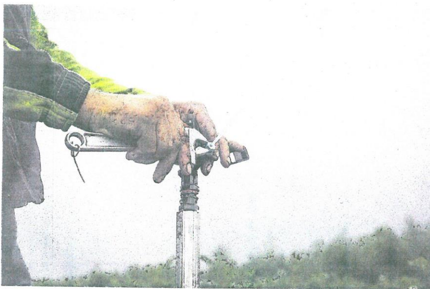
Estas acciones suponen el cumplimiento del 79% de los compromisos de la legislatura.