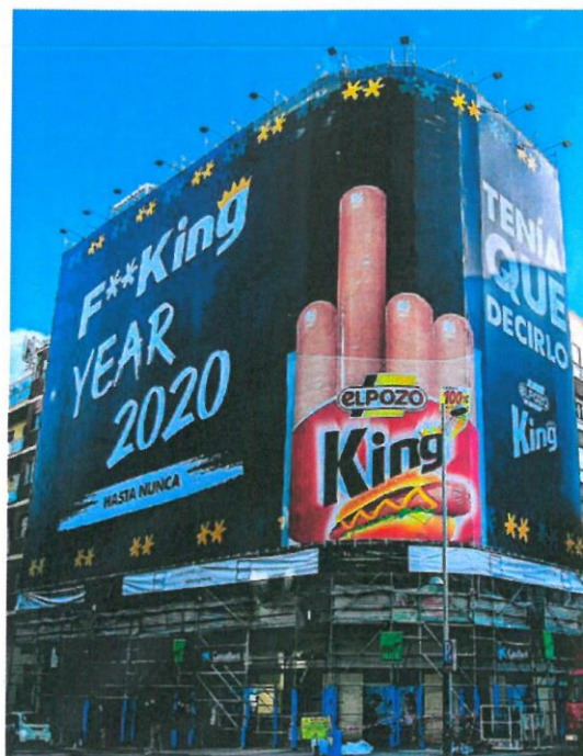
imagen de la lona ha comenzado a compartirse masivamente entre grupos de usuarios e «influencers», atraídos por su contundente mensaje, con el que se sienten identificados.

Este mensaje podrá ser visto en la fachada del edificio ubicado en la calle Zurbarán 8, entre Alonso Martínez y Rubén Darío