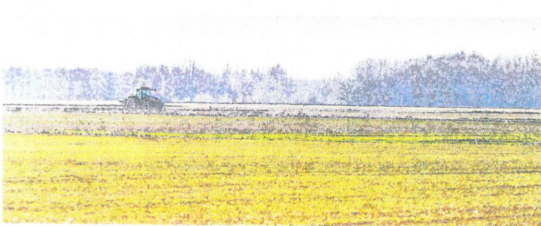
Se contempla la figura del agricultor genuino plus para aquellos que tengan al menos la mitad de sus ingresos totales en esta actividad. / LUIS LÓPEZ ARAICO

Los consejeros de Agricultura de las comunidades autónomas y el Ministerio no mantienen posiciones exactamente coincidentes en relación con el contenido del futuro Plan Estratégico que se elabora desde hace más de un año con el que aplicar y distribuir los 47.724 millones de euros comunitarios asignados a España a través de la Política Agrícola Común. Sin embargo, a raíz de la última cumbre celebrada en Atocha la pasada semana, todo parece indicar que hay un cierto consenso entre la mayoría de las regiones y la administración central acerca de las líneas básicas sobre las que debe avanzar la nueva política agraria desde 2023. Un consenso que, por una parte, supone impulsar y potenciar anteriores medidas necesarias para el sector agrario; pero, por otra parte, también rompe con otras políticas implantadas a raíz de la anterior reforma en 2014 que no han dado los resultados necesarios, especialmente en materia de convergencia y distribución de ayudas al mantener y agrandar situaciones de discriminación entre