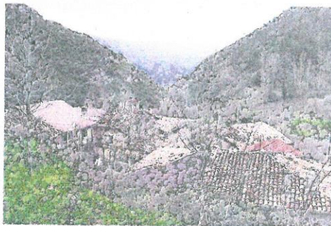
La iniciativa ayuda a emprendedores a instalarse en el medio rural. / A C

El proyecto ( www.holapueblo.com ), da respuesta directa a los Objetivos de Desarrollo Sostenible 8, 10, 11, 12 y 17 de la Agenda 2030 a través de la fijación de nuevos emprendedores en el medio rural, el fomento del desarrollo de negocios sostenibles con el medio ambiente, la generación de impacto positivo en las comunidades rurales y la reactivación de la actividad económica del territorio.