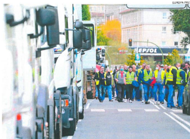
Los camioneros protestan por los precios de los carburantes en Lugo