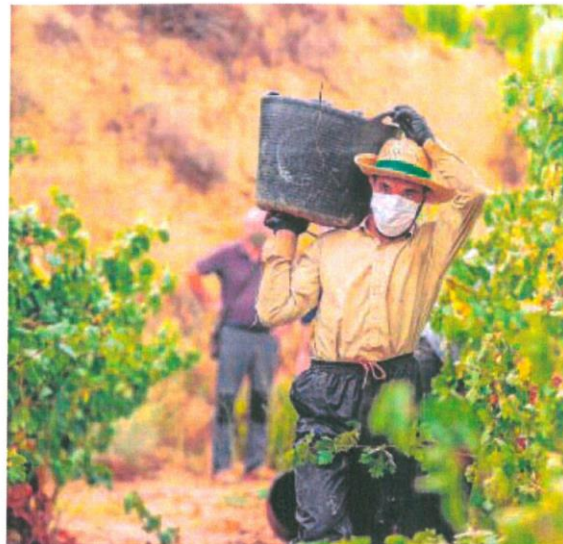
Temporero en vendimia en la localidad de Lapuebla de Labarca (La Rioja)

En concreto, en materia de empleo se abre la puerta al aplazamiento de las cuotas a la Seguridad Social para empresas dadas de alta en el Sistema Especial Agrario y para los autónomos incluidos en el Sistema Especial para Trabajadores por cuenta propia (SETA) con un interés del 0,5%. En el caso de las empresas, el periodo de devengo serán entre los meses de marzo a mayo de 2022 y para los trabajadores por cuenta propia, de abril a junio. De igual modo, se reduce el número mínimo de jornadas reales cotizadas de 35 a 20