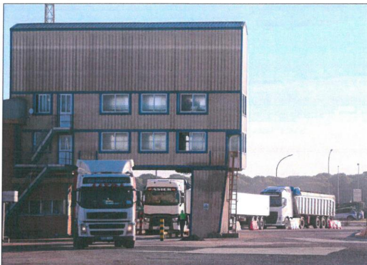
Varios camiones descargan remolacha en la planta de Acor.