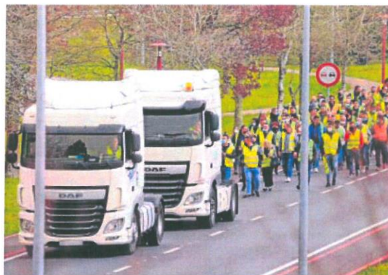
Segunda jornada de huelga de transportistas

Desde UNO señalan que ayer se registraron «pinchazos a camiones, roturas de lonas y lanzamiento de piedras» a los transportistas que no secundaron la huelga que provocaron que muchas empresas no acometan sus rutas previstas debido a la inseguridad existente.