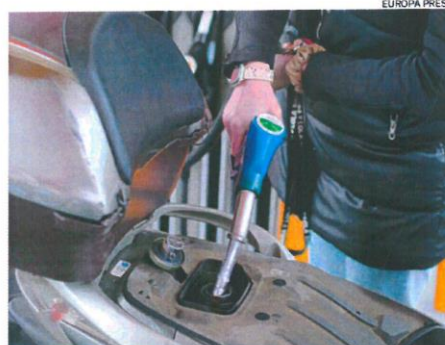
La mitad de cada depósito se va en impuestos

«La subida de los precios afecta fundamentalmente a bienes que tienen una elevada inelasticidad», principalmente productos energéticos como el gas, el petróleo o la electricidad y que ello «genera unos mayores ingresos para el Estado», detalló Herrero, a la vez que indicó que las cuentas públicas también pueden verse favorecidas por el efecto de la inflación al provocar una reducción en el ratio de deuda, y es que «si la previsión de déficit era de cerca del 8,5% (del PIB), las previsiones de Airef estarían en el 7% o incluso por debajo». De no realizar este ajuste, para He-