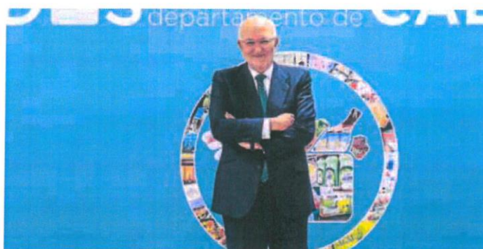
Juan Roig, ayer, durante la presentación en Valencia de los resultados económicos de Mercadona en 2021.