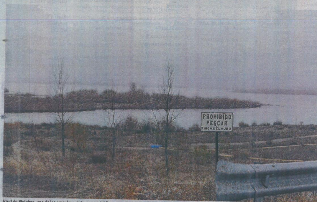
Azud de Riobobos, uno de los embalses de la cuenca del Duero donde el Ministerio estudia autorizar la instalación de plantas fotovoltaicas flotantes.

Con una extensión de 90,2 hectáreas, se ubica en Valladolid. Podría haber placas en 13,5 hectáreas.