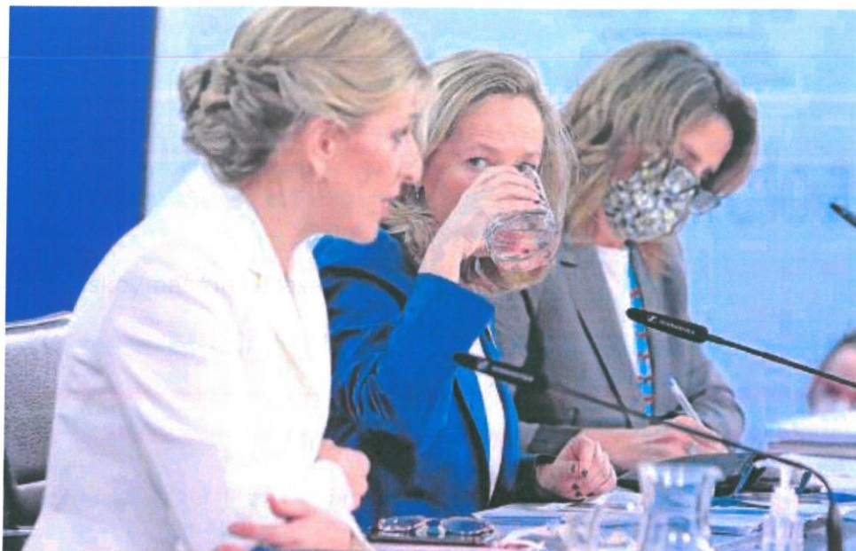
Las vicepresidentas Yolanda Díaz, Nadia Calviño y Teresa Ribera tras aprobar el plan de choque