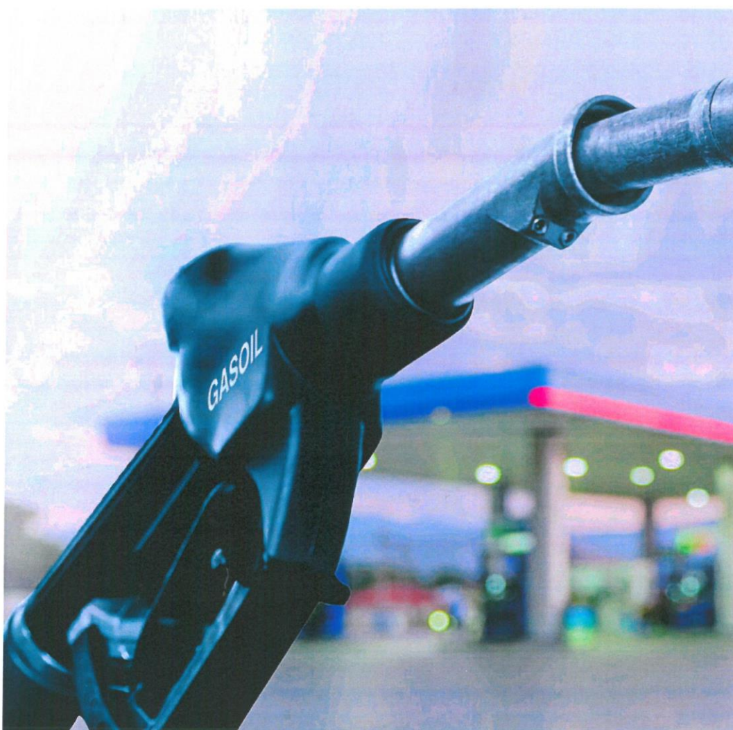
Hoy llenar un depósito de gasoil es hasta 35 euros más caro que hace un año

cas (CSIC) y autor del libro «Petrocalipsis: crisis energética global y como (no) la vamos a solucionar»: «El pico de producción del crudo convencional se alcanzó en 2005. Desde entonces, ha aumentado la producción de petróleo alternativo, como los provenientes del fracking, pero muchos de ellos ya no son tan adecuados para producir diésel. De hecho, el pico de producción de diésel tuvo lugar hacia 2015. Luego se ha mantenido más o menos estable hasta 2018 y desde entonces ha bajado un 15%. Se está refinando cada vez menos gasóleo y el precio sube». El investigador recuerda que cada refinería se ha ido especializando en estos años en la producción de diésel a partir