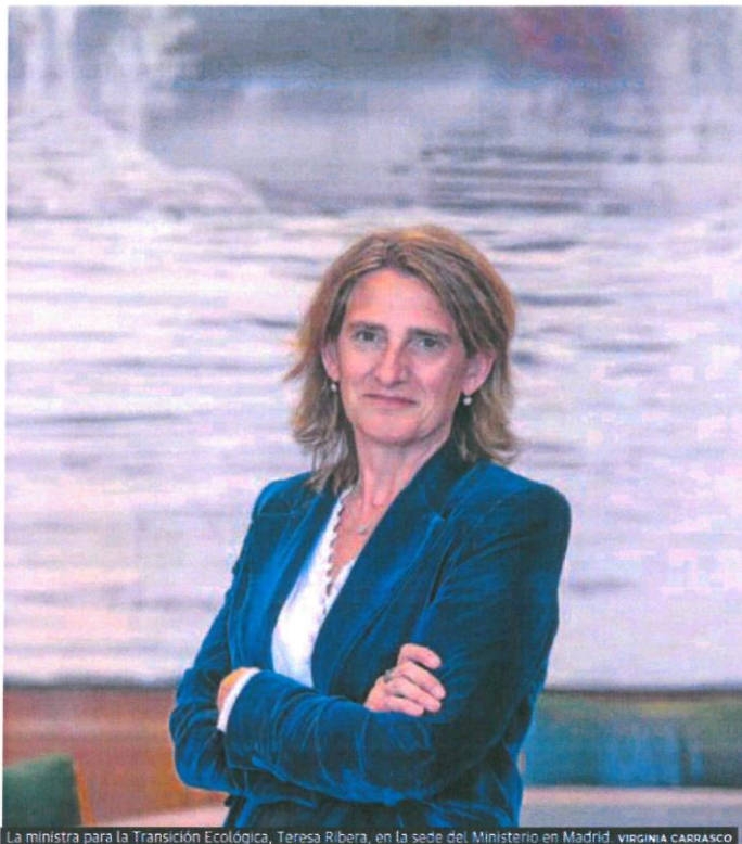
La ministra para la Transición Ecológica, Teresa Ribera, en la sede del Ministerio en Madrid. VIRGINIA CARRASCO

—Al hilo de los precios del gas, la propuesta hispano-lusa de limitarlo a 30 euros/MWh se ha ido finalmente a los 50 euros/MWh. No han conseguido su objetivo inicial y casi ha sido el doble de lo planteado. ¿Por qué?