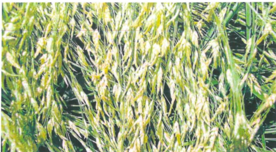
Superficie destinada al cultivo del teff. EL NORTE