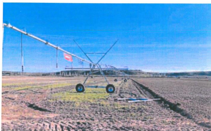
Pívot preparado para el riego en la provincia de Valladolid. s. a.

La situación a día de hoy, asume que es diferente, y el próximo martes tendrán datos oficia-