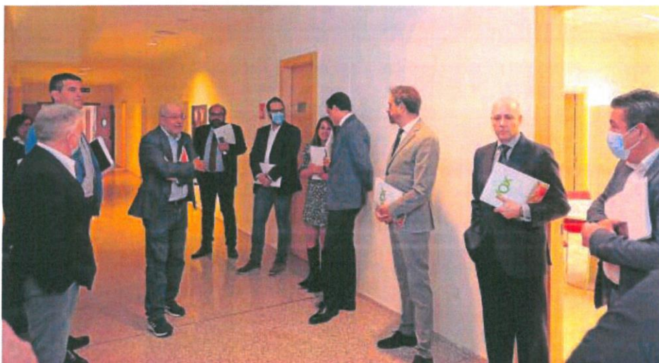
Representantes de los diferentes grupos parlamentarios, antes de comenzar la Junta de Portavoces de ayer