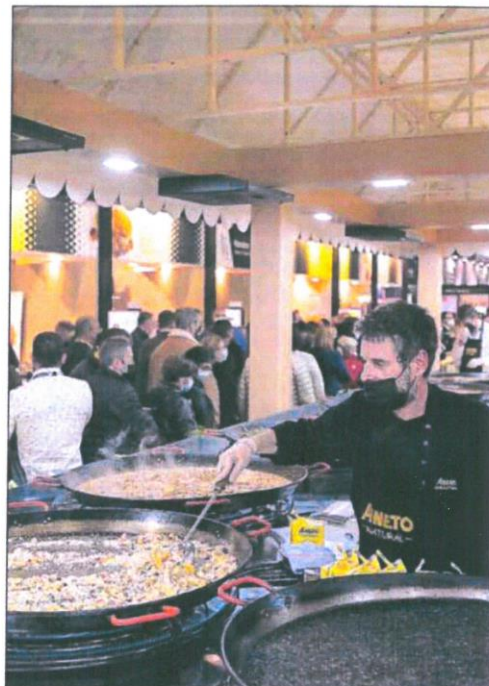
Un hombre cocinaba el lunes en un puesto del salón Alimentaria.