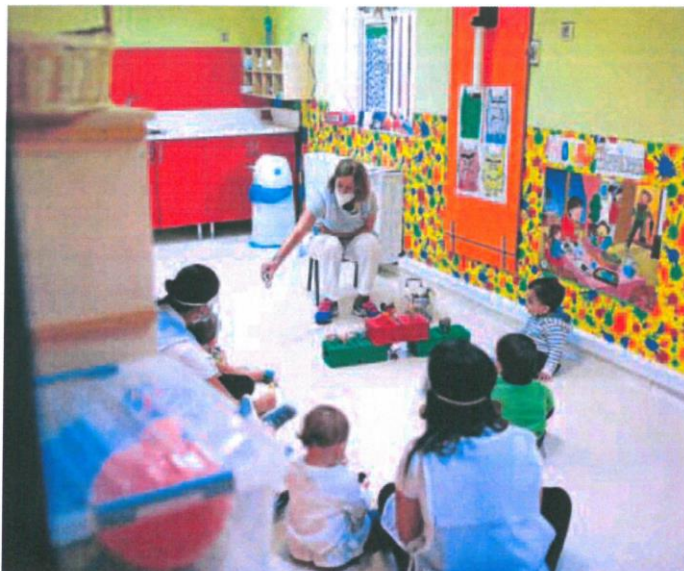
Profesores y niños en una guardería, uno de los gastos desgravables.