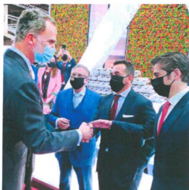
Su Majestad el Rey Felipe VI saluda a los directivos del Grupo Fuertes y de El Pozo Alimentación

Con un diseño moderno y funcional, el stand dispone de 460 metros cuadrados de superficie distribuidos en dos plantas y se compone, entre otros materiales, de metacrilato, madera, entramados de celosía y jardineras verticales. Además, está dotado con un gran frontal semicircular con pantalla led y otros soportes au-