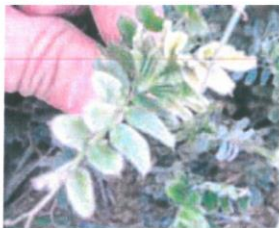
Veza. EL NORTE