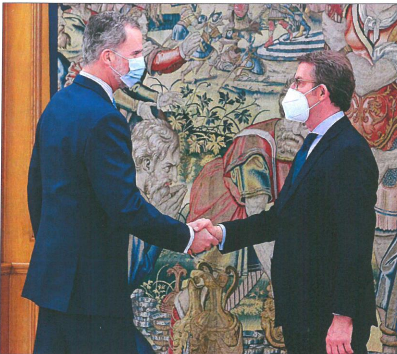
El Rey Felipe VI saluda al nuevo líder del PP, Alberto Núñez Feijóo, ayer en el Palacio de La Zarzuela.

El argumentario que manejan diputados del PP hace una enmienda a la totalidad de las formas del presidente del Gobierno, y no entra apenas en el fondo. Es una manera de establecer el marco en la institucionalidad sin entrar en las políticas concretas. Esto último se reserva para la reunión. Fuentes de Gé-