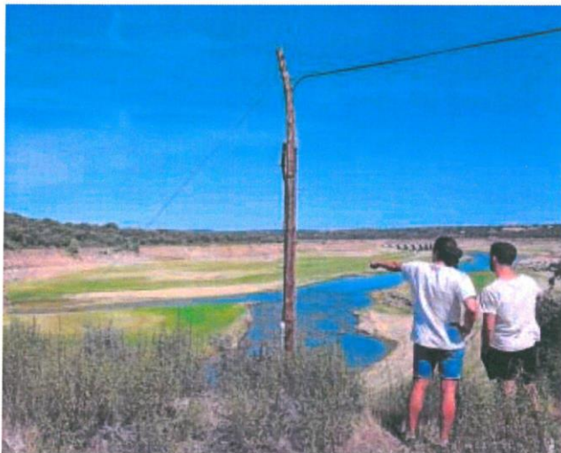
Imagen del pantano el pasado mes de julio

Los denunciantes aludieron problemas de abastecimiento y daños al medio ambiente, los cultivos, la ganadería y el turismo de la zona para presentar las acciones judiciales en la vía penal ahora archivadas. En su argumentación, el juzgado instructor menciona el informe del Seprona que constata que hubo un «descenso importante de las aguas» en el mes de julio del año pasado pero no se apreció afección grave que atentara contra el medio ambiente o la fauna. Sobre el desabastecimiento de poblaciones, ese informe apuntó a que únicamente se pudo ver afectada la captación de agua de la urbanización del Esla y la de riego en la dehesa de Valdellope. El juzgado también alude a la concesión del aprovechamiento hidroeléctrico de la central de Ricobayo por parte de Iberdrola, que debería haber vencido en el año 2010, «sin que hubiera procedido su prórroga ante el incumplimiento de las condiciones a las que es-