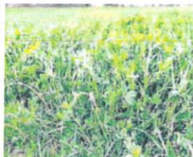
Alfalfa. EL NORTE

Todavía es pronto para hacer un balance definitivo y confía en que estas vezas puedan experimentar algo de mejora. «Pienso que se recuperarán. Si que puede haber alguna merma en el rendimiento, pero si hace calor se recuperan». En esta época del año, las vezas acababan de salir del estado vegetativo y ahora, como consecuencia de las heladas, las puntas se han quemado, por lo que a la planta le resulta más complicado hacer la fotosíntesis. Fradejas se plantea aplicar algún tipo de bioestimulante que favorezca el crecimiento.