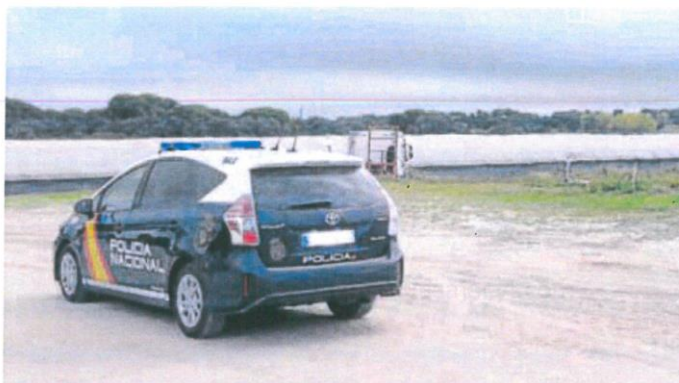
Vehículo policial frente a una nave agrícola en la provincia.