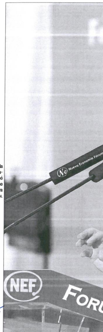
El vicepresidente de la Junta, Juan García-Gallardo, participó ayer en el desayuno organizado por Nueva Economía Fórum.

En este sentido, García-Gallardo confirmó que uno de los objetivos políticos fundacionales de Vox es la derogación del Estado autonómico y así lo mantiene, bajo la convicción de que «solo ha servido para alimentar los bolsillos de los sepa-