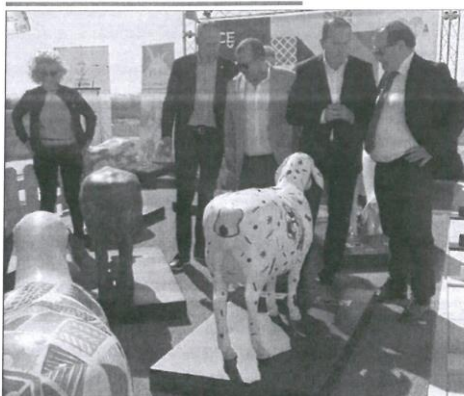
Presentación de la exposición de ovejas en Zamora. E. M.