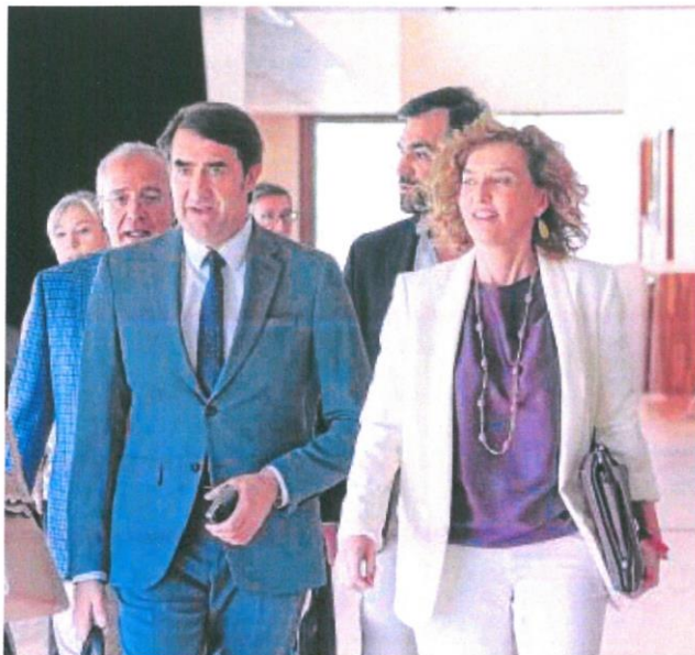
El consejero de Fomento, con parte de su equipo ayer en las Cortes