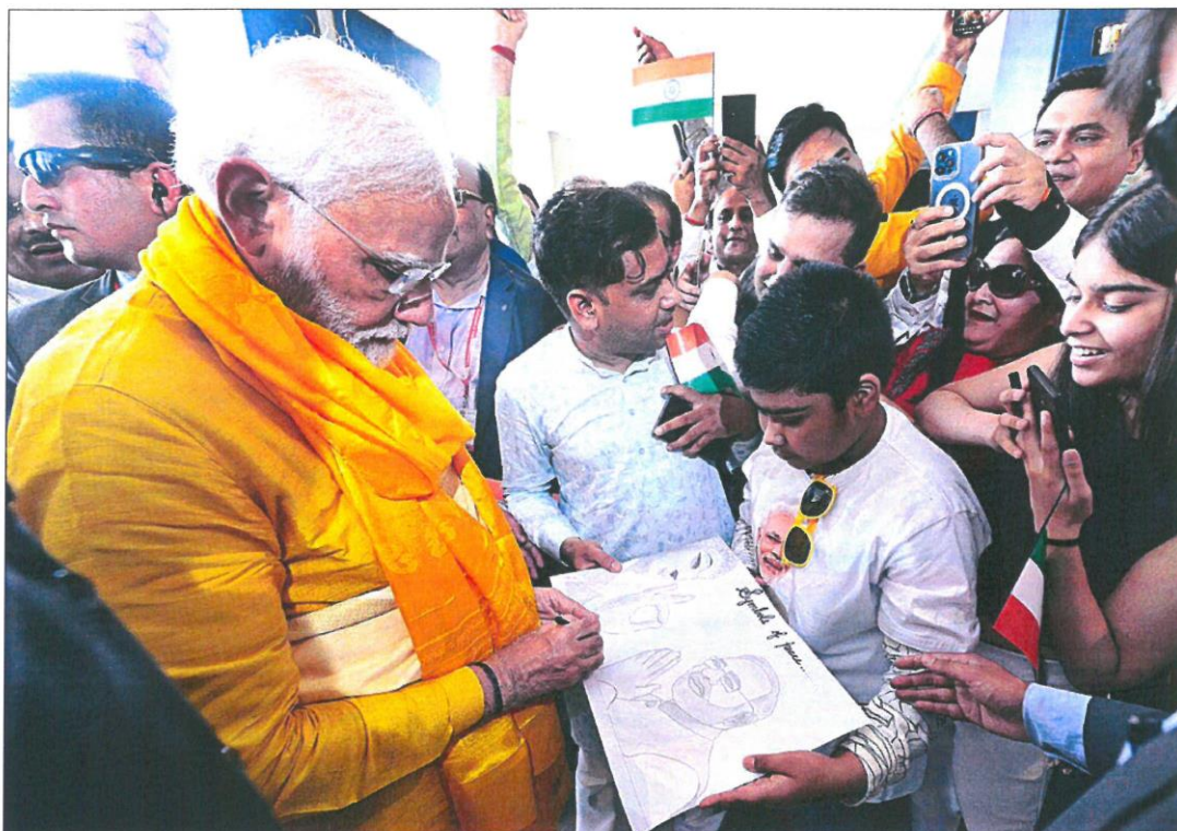
El primer ministro indio, Narendra Modi, firma un dibujo a un joven durante una visita reciente a Nepal.