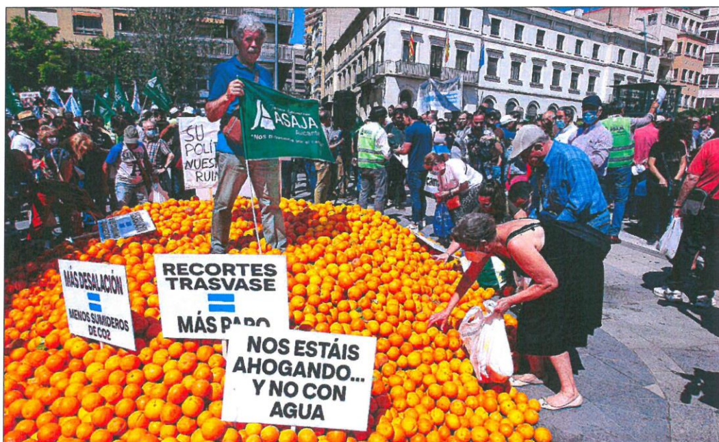
Concentración de los regantes en protesta por el recorte del trasvase Tajo-Segura, ayer en Alicante.