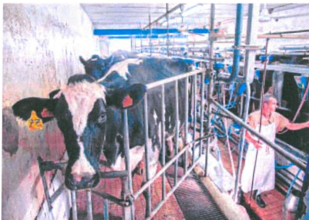
Los alzas de la electricidad y de los piensos han impactado sobre el sector

Además, el nuevo real decreto también disminuye los umbrales productivos necesarios para constituir organizaciones de productores tanto en leche de vacuno como caprino. A todo esto se añaden las ayudas de 169 millones de euros aprobadas en el real decreto anticrisis. El ministro de Agricultura, Pesca y Alimentación, Luis