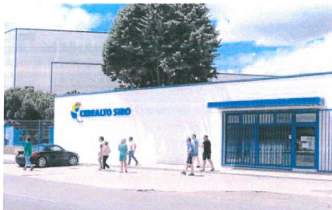
Acceso a las instalaciones de Cerealto Siro en Venta de Baños.