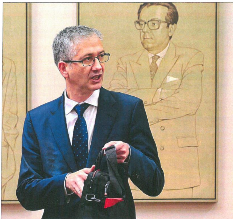
El gobernador del Banco de España, Pablo Hernández de Cos, ayer en el Congreso de los Diputados.

El gobernador, sin embargo, incidió en que «de acuerdo con las estimaciones del impacto las medidas adoptadas en la primera fase de la reforma, son necesarias medidas adicionales para equilibrar el sistema en el largo plazo». Además de las previstas para la segunda parte de la reforma y entre las que están el «desarrollo de los planes