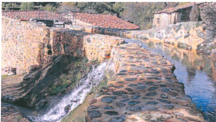
ANTIGUO MOLINO CONVERTIDO EN EL MUSEO DEL AGUA DEL VALLE DEL CORNEJA

El Valle del Corneja, en el sudoeste de la provincia de Ávila, se rebela contra la explotación minera a cielo abierto bautizada como 'Polonia 1.152'