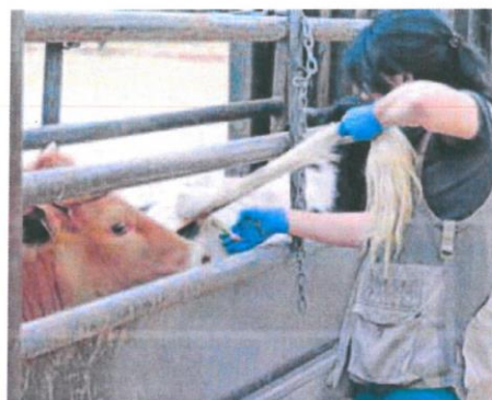
Una veterinaria realiza una prueba a una vaca en Salamanca.

«Mientras en la Junta no haya un jefe de Sanidad Animal y un director general, es difícil saber a qué atenerse»