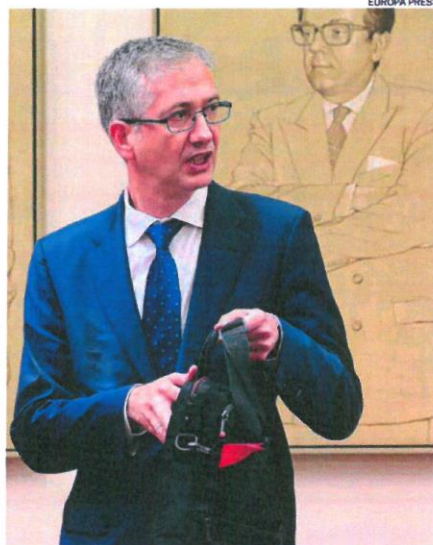
El gobernador del Banco de España, Pablo Hernández de Cos, ayer

De Cos hizo esta reclamación en su comparecencia ante la Comisión de Asuntos Económicos del Congreso para analizar la situación económica de España tras la publicación del Informe Anual 2021 de la entidad supervisora. En ella, no eludió ningún aspecto y anunció que en unos días el Banco de España va a revisar a la baja sus previsiones de crecimiento para la economía española este año ante un «escenario de incertidumbre», para el que recomienda «moderación salarial» a través de un «pacto de rentas» que reparta la carga, y una