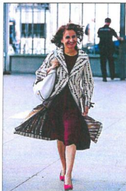
Montero, ayer, en Madrid.

«Es como mejor hemos creído que podemos combatir la inflación [con la rebaja sobre la factu-