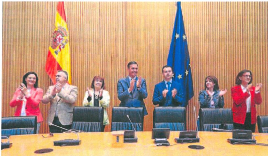
El presidente del Gobierno, Pedro Sánchez, con la dirección del grupo parlamentario socialista ante el que realizó el anuncio.

En principio, según fuentes gubernamentales, el nuevo decreto en el que se está trabajando