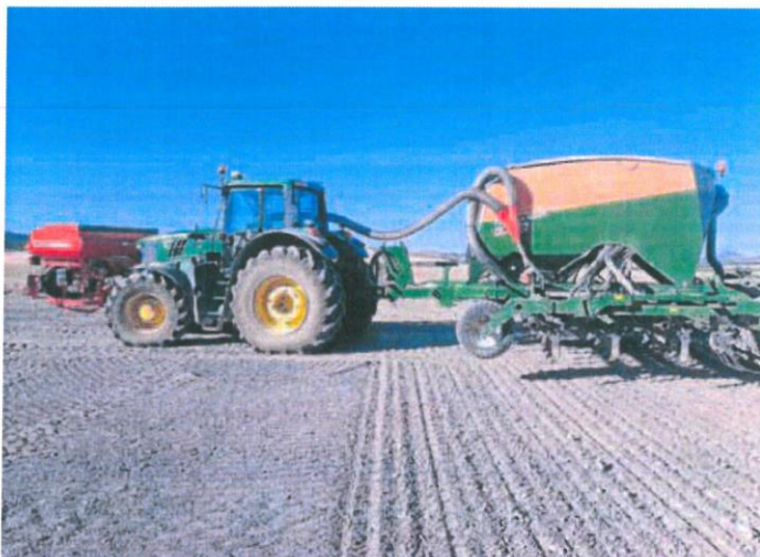
Un tractor siembra mientras se tira el abono en una tierra de Villarmentero de Esgueva.