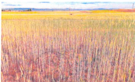
Tierra sembrada de cereal, en la provincia de Segovia