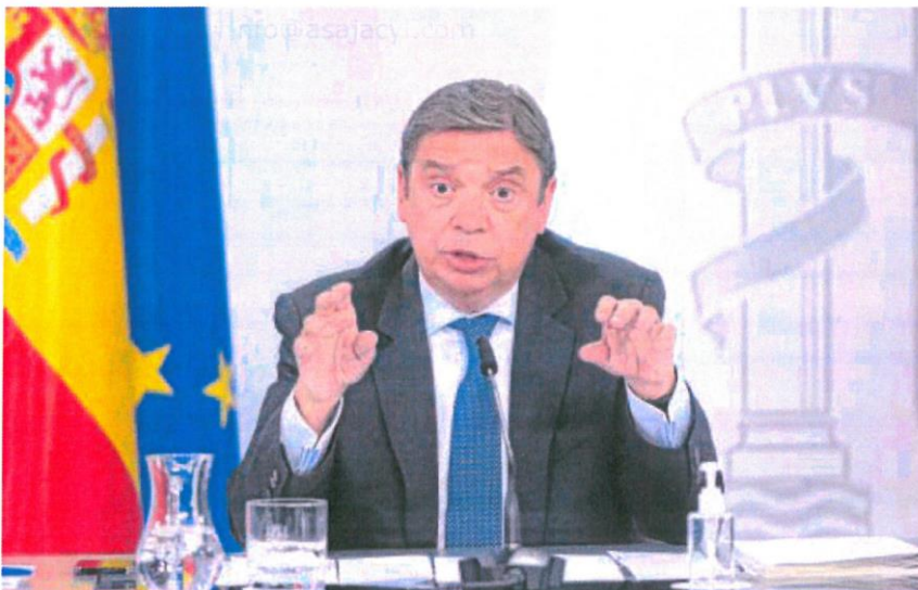
El ministro de Agricultura y Pesca, Luis Planas, ayer en la rueda de prensa tras el Consejo de Ministros

Los comercios al por menor también estarán obligados a contar con una línea de venta, más económica, con productos «feos, imperfectos o poco estéticos», es decir, que por su exterior no sean tan apetecibles como otros