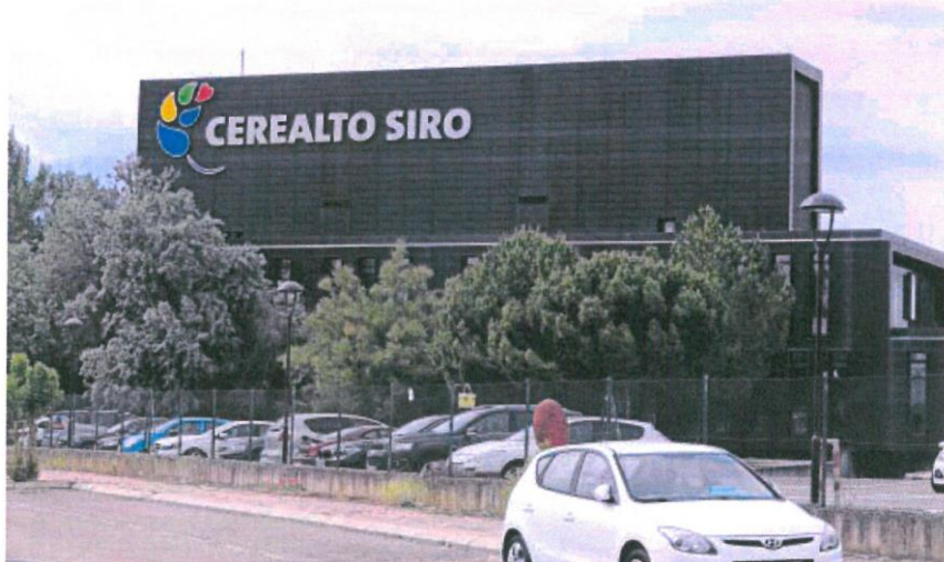
Instalaciones de Siro en la localidad palentina de Venta de Baños

empleo de las personas a las que representan y no con soflamas que «pueden estar bien pero que no son la solución». «No vale levantarse por la mañana y decir: ¡Viva España y todo por España!, que está muy bien, pero es insuficiente porque, después, se olvida de las 1.500 personas que trabajan en el Grupo Siro», recriminó el dirigente de CC.OO.