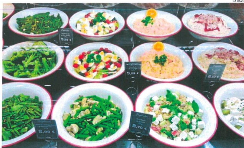
La nueva norma podría entrar en vigor el próximo 1 enero de 2023