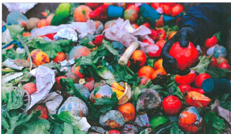
Un agricultor coge un tomate entre un montón de frutas y verduras desperdiciadas.

Según esta ley, que comienza ahora su tramitación parlamentaria, todas las empresas tendrán que tener este plan, excepto los comercios con menos de 1.300 metros cuadrados. Los bares y restaurantes, otro de los focos de desperdicio, tendrán la obligación de facilitar al consumidor que pueda llevarse lo que no haya consumido.