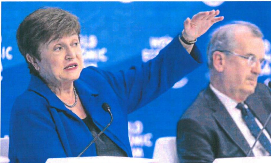
La directora gerente del Fondo Monetario Internacional (FMI), Kristalina Georgieva, en una rueda de prensa en mayo.

El Banco Mundial calcula que la eurozona crecerá solo un 2,5% este año por la inflación, 1,7 puntos menos de lo esperado