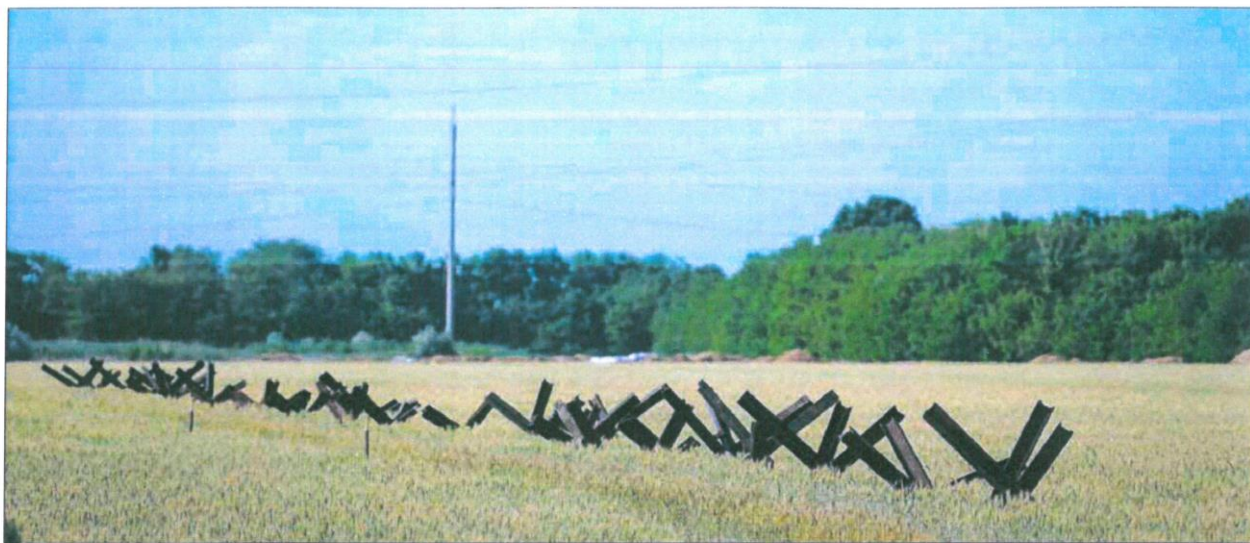
Una barricada antitanques levantada en un campo de cereal cercano a Odesa, ayer.