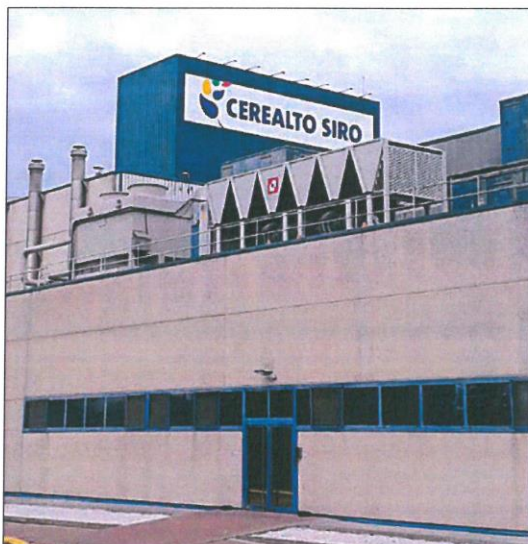
Fachada de una de las factorías de Grupo Siro en Venta de Baños. E. M.

El anuncio de la suspensión del abono de las nóminas se produce tras sucesivos retrasos en el pago de los salarios desde hace varios meses, aunque dicha medida solo afectó a las plantas españolas, dado que las ubicadas en el extranjero