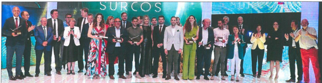
Foto de familia de los premiados y de las autoridades que les entregaron los galardones de los Premios Surcos 2022 de CyLTV.