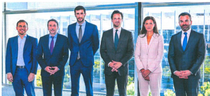
Imagen tras la firma del acuerdo, con el consejero delegado de Repsol, Josu Jon Imaz, segundo por la izquierda