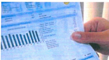
Un cliente con una factura de la luz.

La vicepresidenta tercera y ministra para la Transición Ecológica y el Reto Demográfico, Teresa