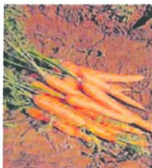
Manejo de zanahorias. r. j.

tre el precio en origen y el precio en destino. Así, el caso más abultado es el de la zanahoria, con un 833% de diferencia, pues mientras el productor percibe 0,18 euros por un kilo, el consumidor debe abonar 1,50 euros para llevarlo a su cesta de la compra. En el caso del puerro esa diferencia se eleva hasta el 673%.