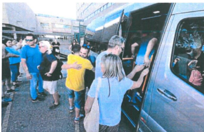
Representantes del comité de Siro suben al autobús para dirigirse a la reunión en Madrid. CARLOS ESPESO