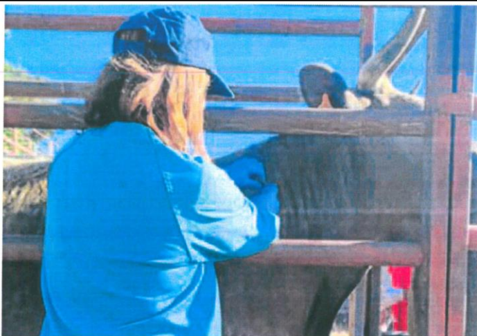
Una veterinaria realiza una prueba de saneamiento en una explotación salmantina.