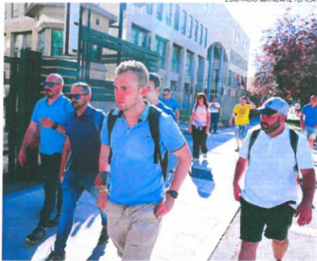
Los trabajadores de Siro tras la reunión mantenida en Valladolid

► Afendis y Davidson Kempner presentan una oferta mejorada