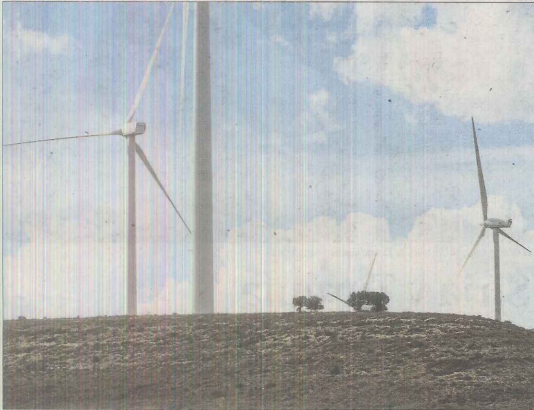
Un parque eólico en un monte de la provincia de Soria. MARIO TEJEDOR

La polémica viene al desarrollar esas «excelentes condiciones» ya que, entre paréntesis, explica que se refiere a la abundancia del recurso solar y eólico y a las «bajas densidades de población en gran parte del