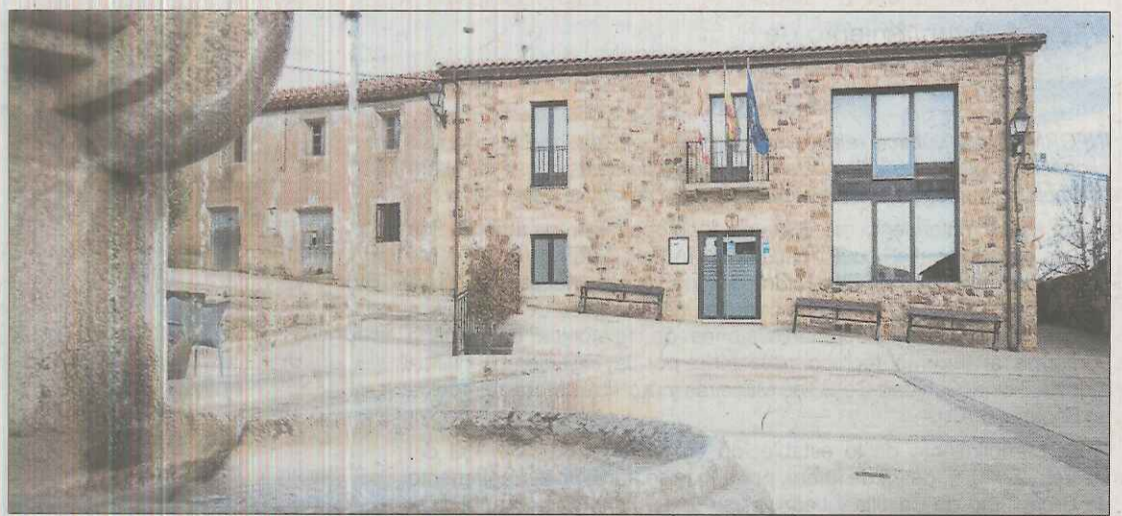
Vista del Ayuntamiento de Narros. M. T.

En Castilla y León también se han detectado movimientos significativos en este sentido. La cifra total es de 53 municipios con incremento de población 'extraño', y 46 de ellos incurrieron, según el INE, en incrementos del número de residentes «significativos sin resultar justificados», tras los requerimien-