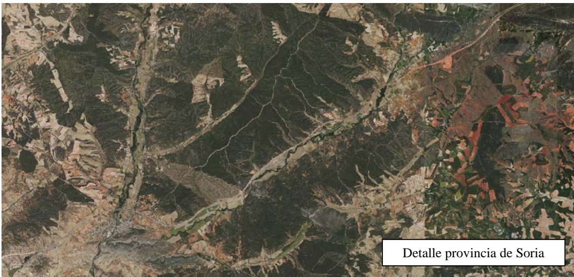
Detalle provincia de Soria