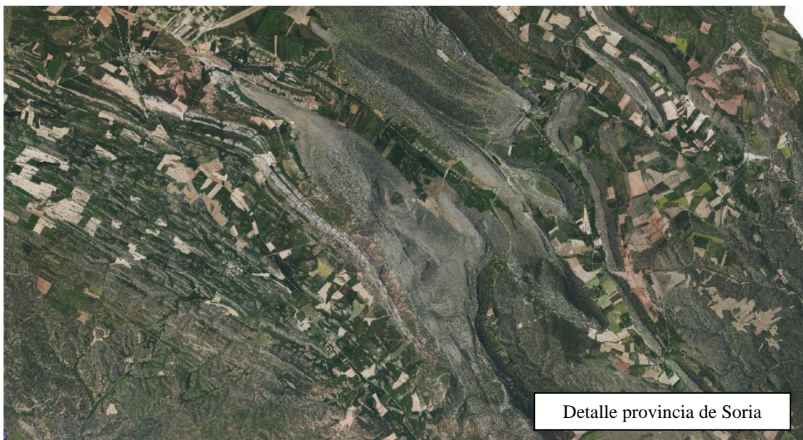
Detalle provincia de Soria

Estas características hacen que la contaminación por fitosanitarios sea prácticamente despreciable pues no existen superficies arables continuas considerables, pues el monte ocupa la mayor parte del territorio. Tanto es así que por norma general muchos caminos rurales transcurren en la parte de estas pequeñas vegas que lindan con el monte, no con el río o cauce, pues la tierra arable es un bien escaso en el territorio.