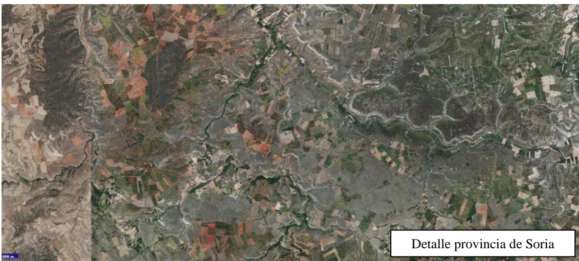
Detalle provincia de Soria