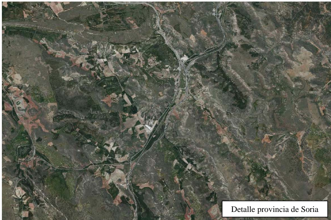
Detalle provincia de Soria

Esta realidad hace que toda la superficie esté surcada por numerosos cauces pequeños, muchos de ellos intermitentes, que transcurren entre estrechos valles rodeados por amplias masas de monte.