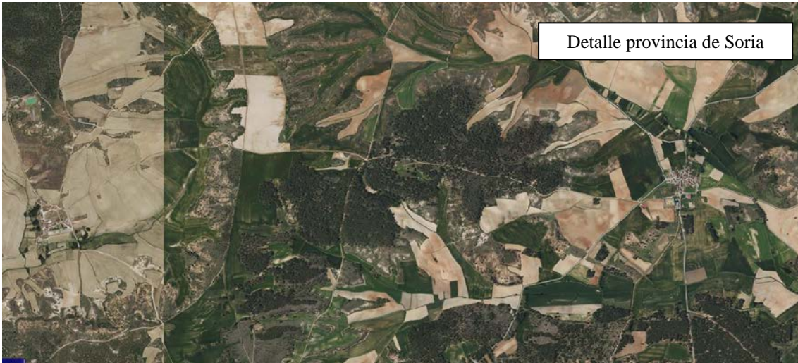
Detalle provincia de Soria