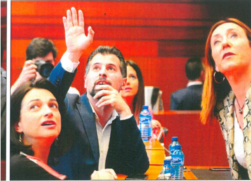
Tudanca y varias procuradoras socialistas observan la parte alta del hemiciclo antes de comenzar la sesión. ICAI.