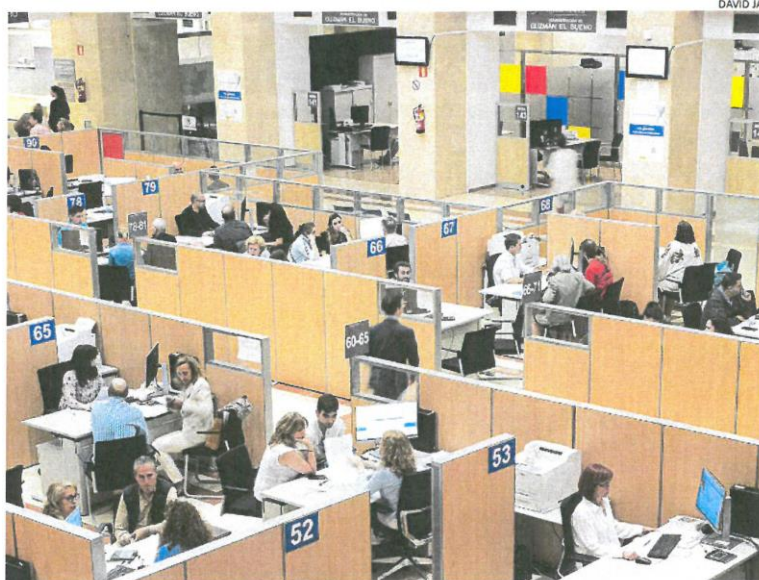
La atención presencial en las oficinas de la Agencia Tributaria comenzará el 1 de junio

En cuanto a la modalidad de tributación, se esperan un total de 19.578.000 declaraciones individuales, un 4,1% más respecto al ejercicio pasado, mientras que se prevén 3.321.000 declaraciones conjuntas, un descenso del 0,7%.