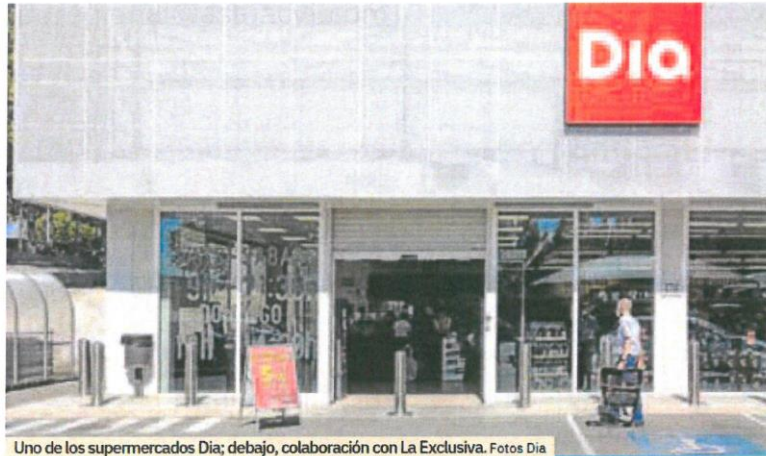
Uno de los supermercados Dia; debajo, colaboración con La Exclusiva.

Dia es proximidad, cercanía. Y desde la posición única que le ofrece su gran red de tiendas en España y la cobertura de su canal 'online', la compañía se ha comprometido con «lograr un impacto real en la sociedad a través de una palanca clave para las familias: que los alimentos y bienes de primera necesidad estén al alcan-