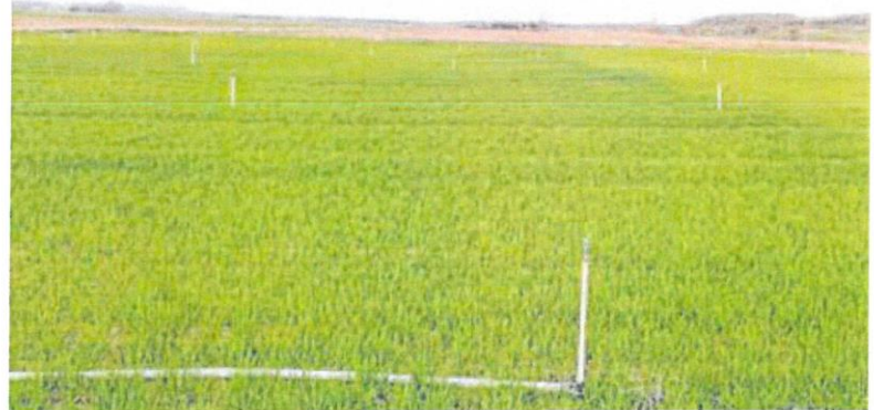
Cereal en el Bajo Duero, en la campaña actual.