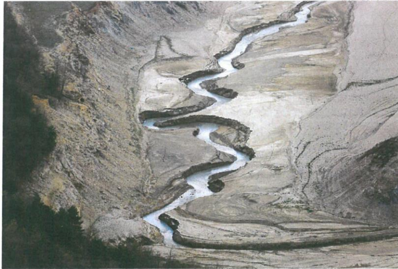
El embalse de la Baells, en la comarca del Bergadà, en la provincia de Barcelona

Los niveles continúan muy por debajo de los registros de 2022, cuando se alcanzaba los 4.126 hm 3 en la misma semana (573 hm 3 más que hoy), según el Gobierno andaluz, que insiste, según recoge Europa Press, en la necesidad de hacer un uso responsable del agua ante esta situación de sequía. Respecto a las diferentes cuencas del territorio andaluz, en la demarcación hidrográfica del Guadalquivir el agua embalsada es de 2.070 hm 3 , con un descenso de 4 hm 3 (-0,05), con respecto a la pasada semana. En comparación con las cifras del pasado año hay 352 hm 3 menos que la misma semana de 2022.