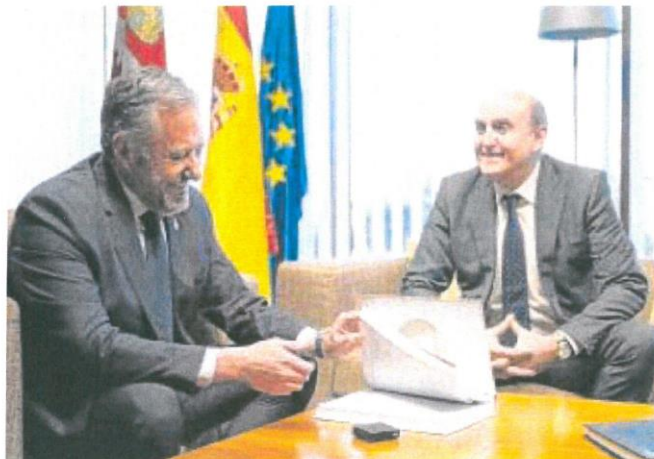
El presidente de las Cortes recibe al Procurador del Común

Además, los temas más recurrentes de cada año han dado paso a otros problemas, como la instalación de los parques eólicos o fotovoltaicos en determinados municipios, que han supuesto una de las quejas denominadas múltiples. También es una de esas peticiones que aglutina varios expedientes la presentada en contra de una adjudicación de un comedor escolar que ha llegado a reunir a 2.000 ciudadanos descontentos. Como es habitual, es León la provincia que más se dirige al Procurador del Común, con 389 reclamaciones.