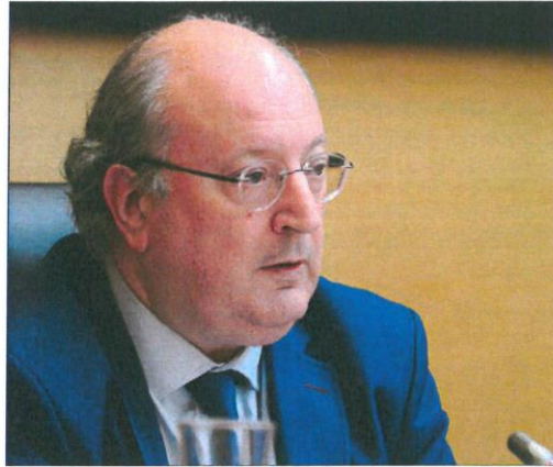
El presidente del CES, Enrique Cabero, en su comparecencia en Cortes.

cución de un «doble pacto» al precisar que la elección del presidente determina la renovación del Pleno del CES. Con motivo de su comparecencia en la Comisión de Industria, Comercio y Empleo de las Cortes para presentar la memoria de actividades del CES del año 2022, Cabero recordó que la reforma de la ley en 2013 acertó al tener que ser necesario el doble acuerdo.