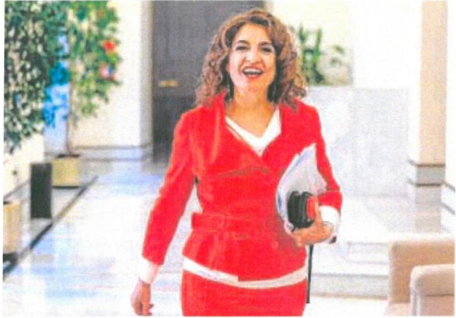
La ministra de Hacienda, María Jesús Montero

Entre el reconocimiento del pago de esos recursos y el pago efectivo de los mismos suele pasar un tiempo que es menor en el caso de la asignación de subvenciones y mayor en el caso de la contratación de obras y servicios, que no se pagan hasta que se realizan. Por eso los pagos reales se quedaron en 11.271 millones.