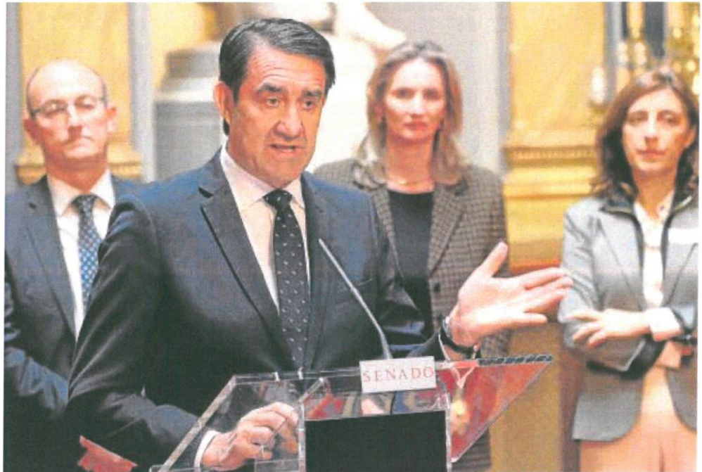
Pie de foto XXXXXXXXXXXX