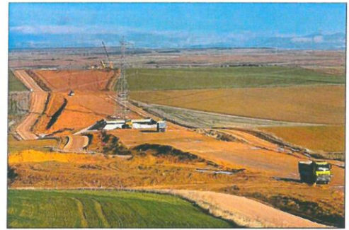
Terreno de la línea de Alta Velocidad entre Palencia y Santander. ADIF

Las obras serán realizadas, en un plazo de 48 meses, por la Unión Temporal de Empresas (UTE) integrada por CHM Obras e Infraestructuras, COPISA Constructora Pirenaica y Construcciones Rubau. El tramo que iniciará ahora su construcción se suma a otros en ejecución, y que suman 64,7 kilómetros. La conexión