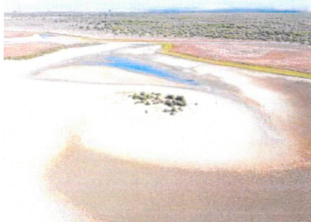
Una de las lagunas del Parque Nacional de Doñana