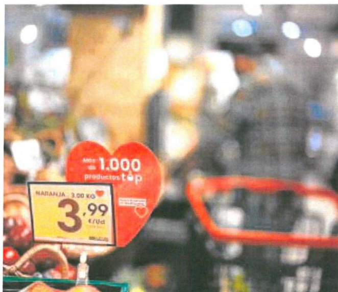
El detalle de una etiqueta en un supermercado de Eroski

sumo, con bajos márgenes comerciales y con un surtido reducido. En este sentido, la marca blanca es la gran protagonista en los lineales de estas tiendas, donde la política de la compañía está basada en el control constante de costes.