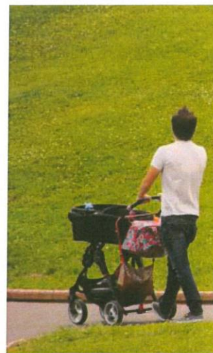
Los partidos buscan el voto de las familias

Además, el PSOE quiere promover un gran acuerdo social por el pleno empleo. Quiere flexibilizar el trabajo con incentivos a las empresas que fomen-