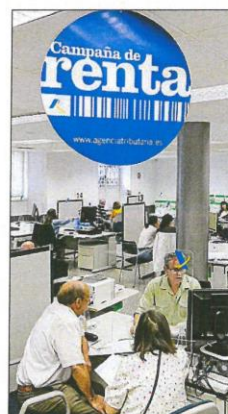
Oficina de la Agencia Tributaria.

Preguntada sobre la posibilidad de que un cambio de Ejecutivo impida el desarrollo de la nueva OEP, la ministra advirtió que el real decreto «establece obligaciones», aunque añadió que no contempla otro escenario que el de un «Gobierno de progreso» que sea