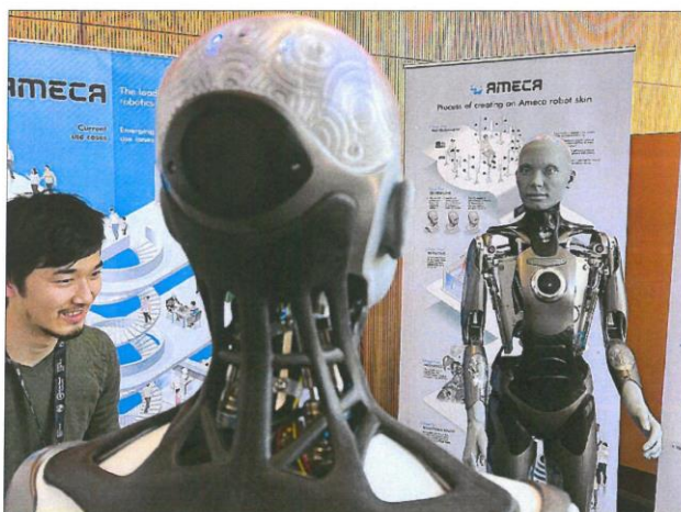
Varios dispositivos en la Cumbre sobre Inteligencia Artificial de la ONU en Ginebra.