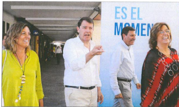
MAÑUECO LLAMA A CONCENTRAR EL VOTO. El presidente de la Junta, Alfonso Fernández Mañueco, dijo ayer en Palencia que, pese a que el debate entre Pedro Sánchez y Alberto Núñez Feijóo «estuvo bien hay que remarcar la faena» con una movilización y con la concentración del voto en el PP para lograr una victoria contundente.

Los que cuentan con expectativas normales para el trimestre que comienza se sitúan en el 60,8%.