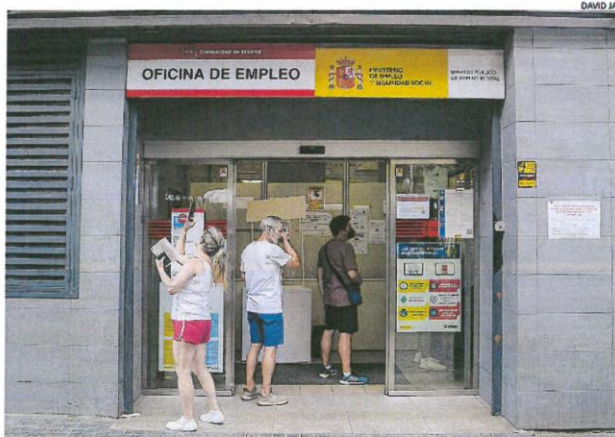
La OCDE señala que la mejora en la seguridad laboral de los temporales por la reforma es aún «incierto»

En cuanto al empleo, la OCDE pone en tela de juicio los beneficios de la reforma laboral aprobada por el Gobierno de Sánchez en lo referente al combate a la temporalidad, con la potenciación de