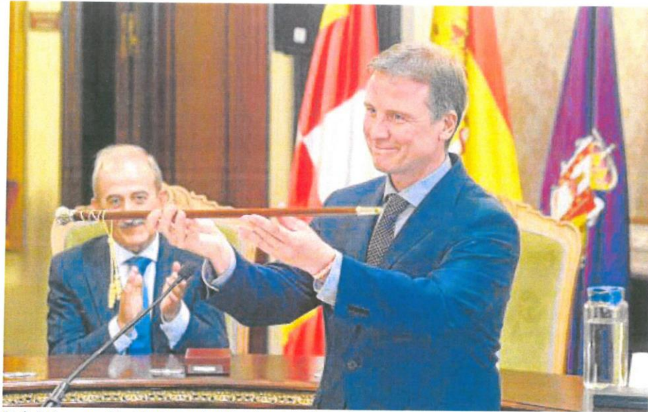
Borja Suárez, con el bastón de mando de la Diputación de Burgos