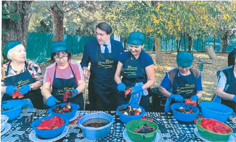
El consejero de Medio Ambiente, Ordenación del Territorio y Vivienda participa en la Feria de la Fruta y la Hortaliza de Carracedelo (León)

► Suárez-Quñones recuerda a Sánchez que está «pendiente» la transformación de 4.000 hectáreas del Canal Bajo del Bierzo, que permitirían «duplicar» la superficie regable