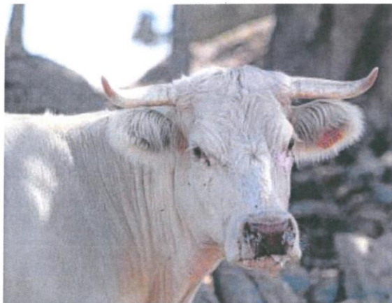
Los datos de mortalidad se han disparado este año en la cabaña bovina