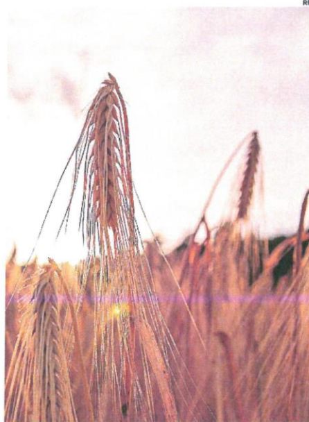
El mercado de cereales está a la baja

Por otro lado, en aceite de oliva, el mercado lleva ya varias semanas dando muestras de cierta debilidad, con ligeras caídas. Ahora falta por ver la incidencia que tendrá en la evolución de las cotizaciones la aparición del primer aforo de la nueva campaña hecho por la Junta de Andalucía. Se presentó el