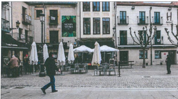
Varias personas en una plaza de la ciudad de Soria. ICAI

La llegada de población migrante, como también indican los balances de población más recientes publicados en los últimos meses por el INE, vienen empujando al alza el crecimiento demográfico en Castilla y León. En total, la Comunidad tiene 238 millones de empadronados, que son 7,50 más que en enero de 2022. Por provincias, Zamora, León y Palencia merman sus