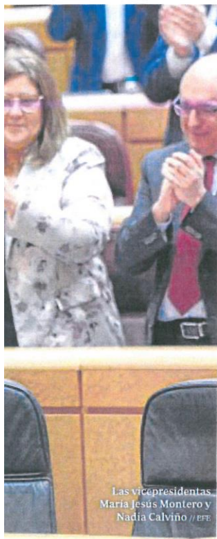
Las vicepresidentas María Jesús Montero y Nadia Calviño

El otro campo de batalla que seguía abierto era el de las ayudas para la gratuidad del transporte, cuyo mantenimiento Sánchez garantizó para menores, jóvenes y desempleados, pero que Sumar quiere mantener sin cambios, lo que implicaría el mantenimiento de un coste de 2.000 millones de euros. A última hora de ayer fuentes del Gobierno daban por hecho que se mantendrá la gratuidad de los trenes de Cercanía y Media Distancia.