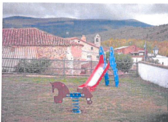
Villar del Río, en Soria, una de las localidades más despobladas