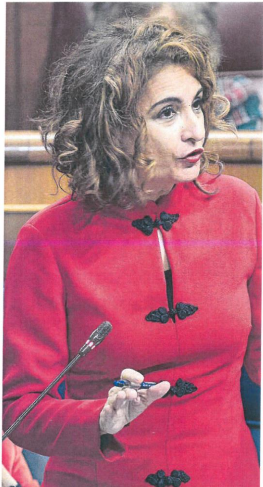
Yolanda Díaz, ministra de Trabajo, y María Jesús Montero, de Hacienda

La CEOE ha reclamado infinidad de veces que el incremento del SMI debe ir acompañado de una subida similar del importe de