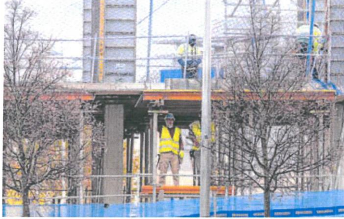
Trabajadores de la construcción. ESTHER VAZQUEZ

De igual forma, las bases mínimas de cotización comenzarán el año congeladas en los actuales 1.260 euros al mes, pue-