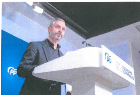
El vicesecretario de Economía del PP, Juan Bravo