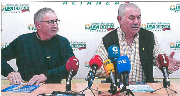
Los coordinadores de la Alianza UPA-Coag en la presentación del balance del año agrario, ayer.