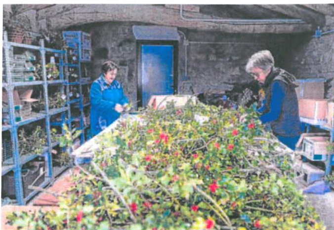
Elaboración de centros ornamentales con acebo en Torrearévalo, Soria.

El límite de corta de ramilla ornamental para este año supera los 20.800 kilos en la provincia de Soria. El año pasado la cifra se fijó en 16.620 kilos en cinco localidades. La mayor cantidad de acebo se obtiene anualmente del acebal de Garagüeta en Arévalo de la Sierra, seguido de La Póveda y Oncala. «La producción y recogida es muy variable. Pese a que existe más oferta que demanda de acebo, el precio es ele-