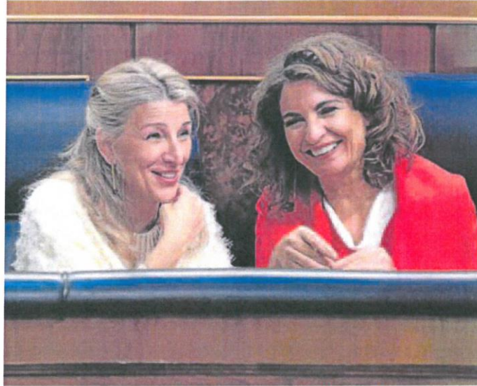
Las vicepresidentas Yolanda Díaz y María Jesús Montero, en el Congreso de los Diputados.

Actualmente, los hogares españoles se benefician de la baja del IVA al 5% en sus recibos. Y al menos hasta el 31 de diciembre se aplica también la rebaja del Impuesto Especial sobre la Electricidad al 0,5%, así como la suspensión del impuesto sobre el valor de la producción de la electricidad. El Banco de España calcula que esas rebajas implican una pérdida recaudatoria de unos 3.000 millones de euros anuales. Pero, al mismo tiempo, devolver los impuestos a su tarifa normal (21% de IVA y 6,18% el tipo real del Impuesto Especial de la Electricidad) tendría un impacto negativo en la inflación, aunque facilitaría la reducción del déficit público con el regreso de las reglas fiscales de Bruselas. Según