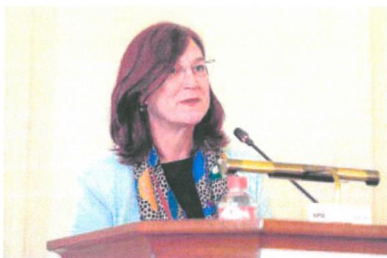
La presidenta de la CNMC, Cani Fernández