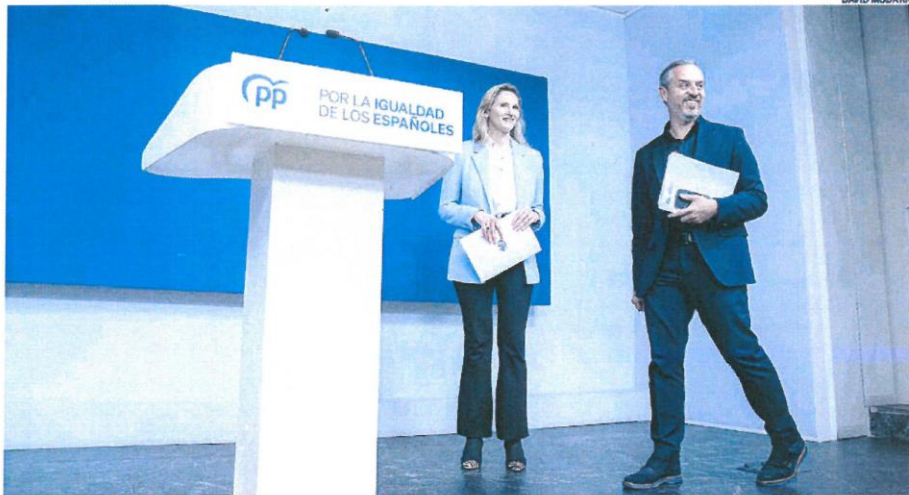
El vicesecretario de economía del PP, Juan Bravo y la vicesecretaria de Desarrollo Sostenible, Paloma Martín, ayer en la sede nacional del partido

Sobre un eventual apoyo del Partido Popular a esta norma que aprobará el Ejecutivo si se incluyen sus peticiones, el vicesecretario de economía de los populares subrayó que primero tendrían que encontrar «lealtad» y que no se aglutinaran todas las medidas en un real decreto. «Para hacer trampas, no (...) si es para beneficiar a todos los españoles, sí», zanjó.