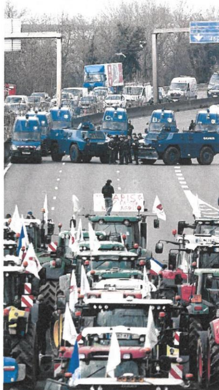
Miles de camiones en la autopista del sur de París, ayer

En medio de este polvorín agroalimentario que se extiende por varios países de Europa -incluyendo España- la Comisión Europea propuso ayer varias «medidas de salvaguarda» como prorrogar la exención de derechos de aduana que se aplican a los productos agrícolas que entran a la Unión Europea, limitando los volúmenes de los productos más sensibles. Una especie de «freno de emergencia» para la importación de productos como las aves de corral, los huevos y el azúcar. La idea es aplicar una tasa de aduana cuando la importación supere un cierto volumen, promediado en-