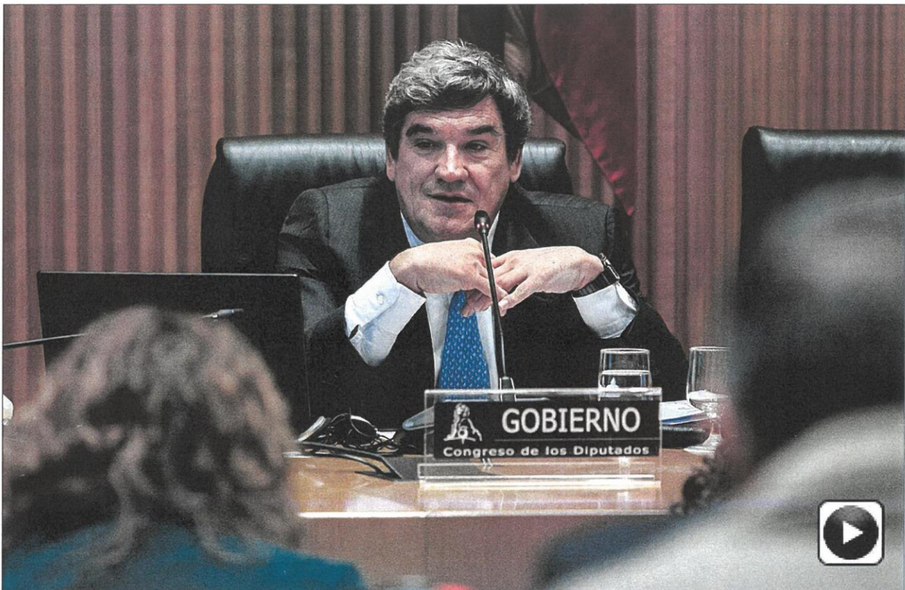
El ministro para la Transformación Digital y de la Función Pública, José Luis Escrivá, ayer en el Congreso.