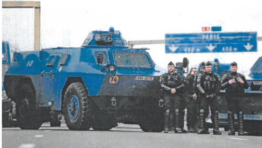
Un grupo de gendarmes franceses vigila una de las carreteras que quieren cortar los agricultores

Un sondeo que publica 'Le Figaro' recuerda que el 58% de los franceses confían en los agricultores, cuando más de un 60% desconfían de Macron. Se trata de otro indicador de la tendencia que confirma el giro a la derecha de la opinión pública francesa.