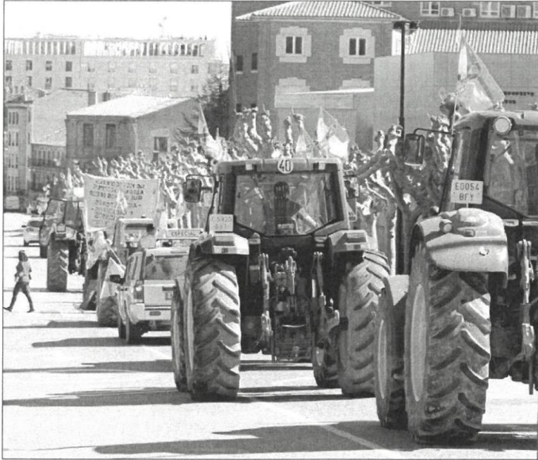
Imagen de una tractorada en una imagen de archivo. HDS

que ya se han unido a los grupos de whatsapp más de un millar de personas, y esperan «al menos 800 tractores» entre las tres concentraciones, una cifra que les ha sorprendido, dado que casi son la mitad de los profesionales que hay en Soria, unos 2.500. Además, confían en que se se-