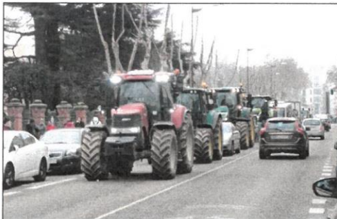
Concentración de tractores en Zamora.

bién lamentó que «el riego está sufriendo una barbaridad y se paga muchísimo dinero» y «donde no hay riego, por el pie se riega muy mal, con tres o cuatro riegos».