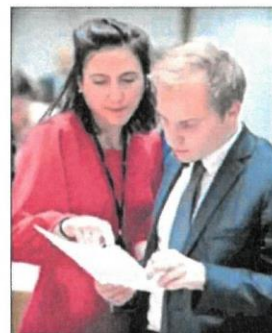
Valérie Hayer, con un funcionario en el Parlamento Europeo.

No será una tarea fácil. Toma el testigo de otro francés muy ligado al macronismo, Stéphane Sejourne, que abandonó Bruselas por París para asumir la cartera de Exteriores de un nuevo Gobierno que busca frenar el impulso de la ultraderecha comandada por Marine Le Pen, a menos de seis meses de las elecciones europeas. Es una cita que se