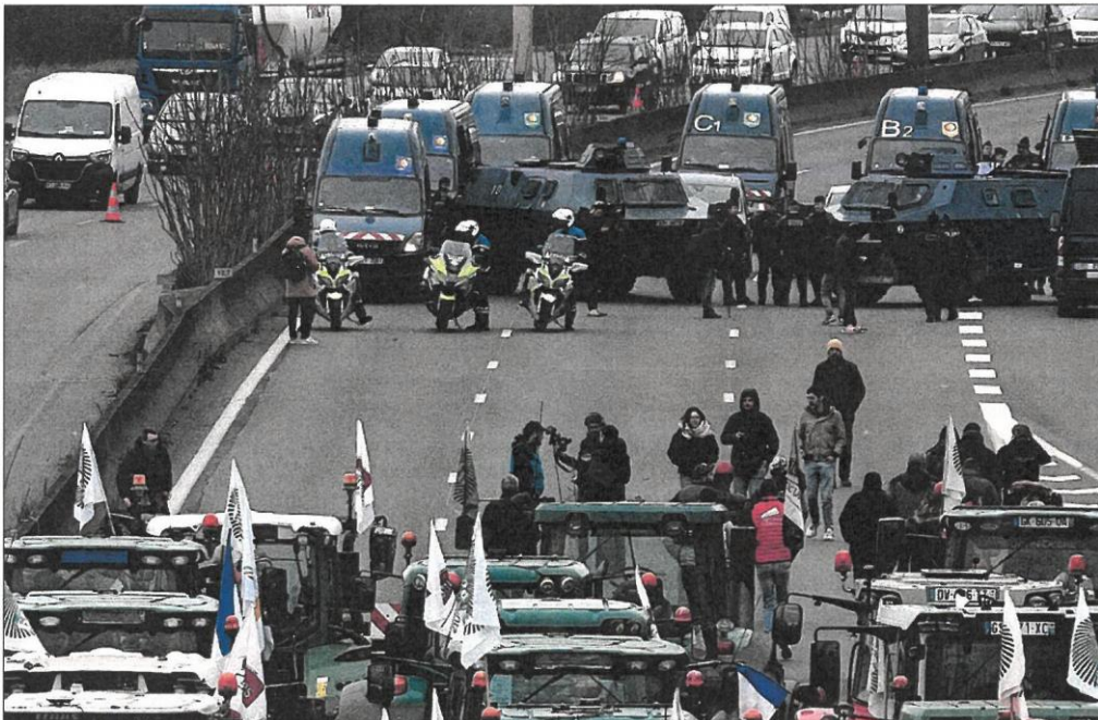
Un despliegue policial bloquea el paso a los tractores que protestaban ayer en la autopista cerca de Chilly-Mazarin, en el sur de París.

Los gobiernos de Francia, Alemania e Italia pedirán en el Consejo Europeo medidas concretas para los agricultores europeos, como la rebaja de las exigencias medioambientales, así como un reparto más equitativo de los presupuestos agrarios, en especial de la partida de 50.000 millones de euros que la UE tiene previsto enviar a los agricultores de Ucrania para aliviar la incidencia de la guerra, una cantidad que la mayoría de países considera desorbitada.