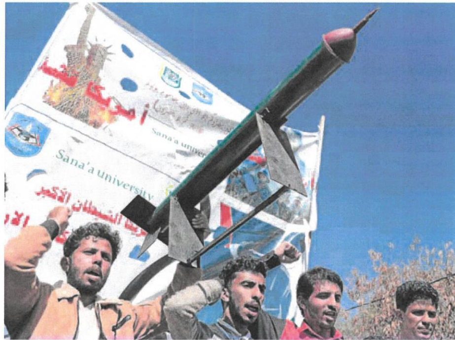
Universitarios yemeníes portan la réplica de un misil durante una manifestación de apoyo a los rebeldes huties.

Los titulares de Defensa debatían anoche en Bruselas los términos del plan. Antes de la reunión, Borrell admitió que todavía no se habían concretado cuántos