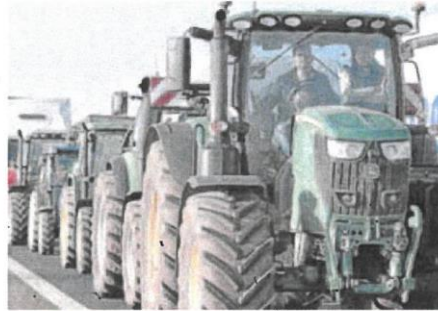
Decenas de tractores en la N-120, en Villadangos del Páramo.

Desde primera hora del miércoles, los agricultores a bordo de sus tractores provocaron atascos y taponamientos al tráfico en varias carreteras, como es el caso de la N-120 en la localidad leonesa de Villadangos del Páramo, donde decenas de tractores protestaron por la situación económica del sector. Movilizaciones que también se extendieron a Palanquinos, Villamán y Astorga.