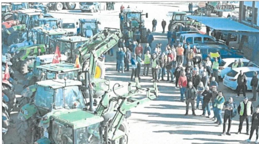
Varios tractores se concentraban ayer en Villadangos del Páramo (León).