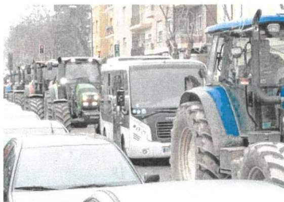
Más de cien tractores recorrieron ayer las calles de Zamora

Y en año de elecciones al Parlamento Europeo, desde donde se ha diseñado una Política Agraria que acumula quejas y más quejas, COAG se movilizará hoy en Bruselas con una «gran tractorada» convocada a nivel comunitario.