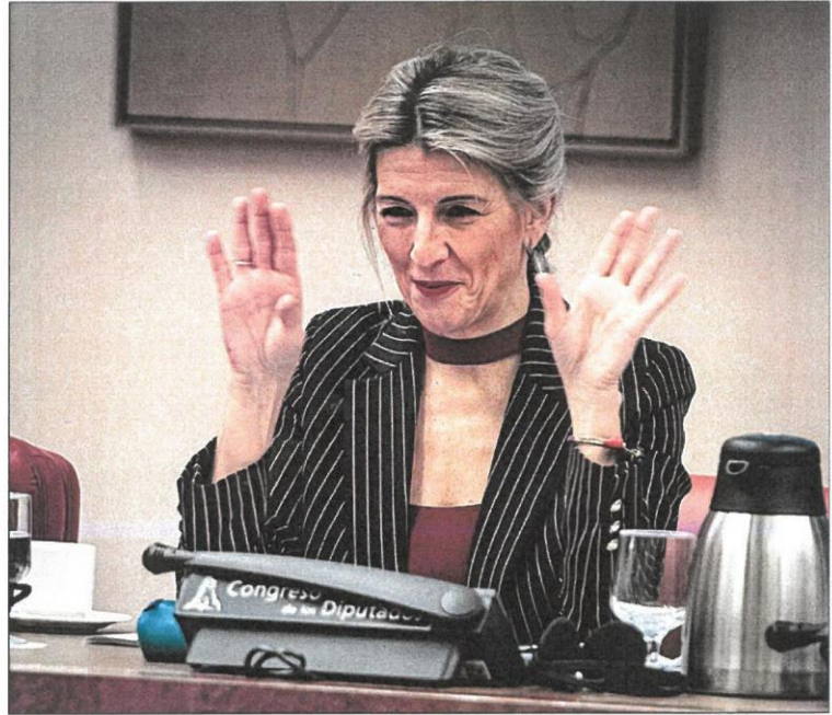
Yolanda Díaz, vicepresidenta segunda y ministra de Trabajo.

La industria manufacturera es el sector que más ha recurrido a este tipo de contratación, con 939.087 contratos (un 2,2% menos que en el mismo periodo de 2022); seguido de la agricultura y ganadería, que ha firmado 552.204 contratos de este tipo (un 8,6% menos); y el transporte y almacenamiento, con 548.610 (-5,9% interanual). En cuarto lugar se sitúa la hostelería, con 523.311 contratos, que es precisamente uno de los sectores que ha