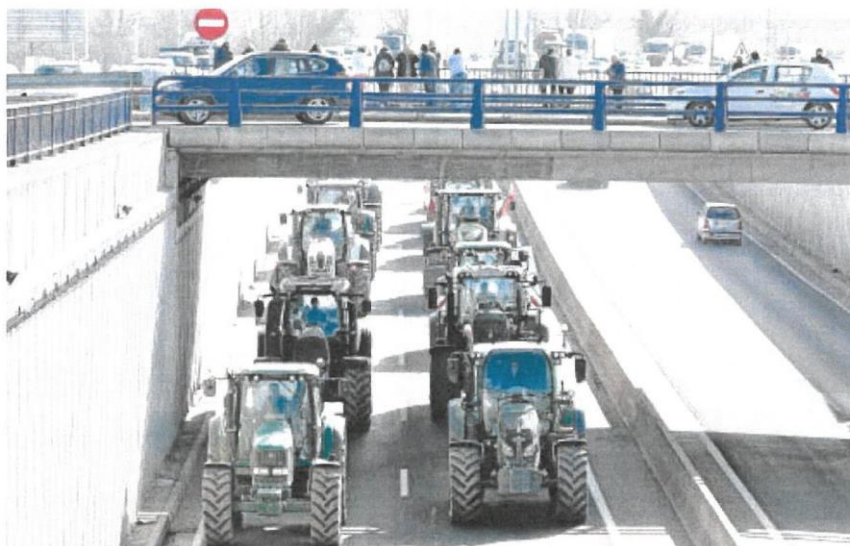
Varias decenas de tractores tomaron ayer León capital en una marcha lenta de protesta del campo