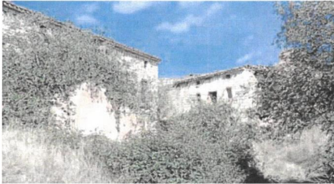
Casas de piedra caliza en el pueblo burgalés de Bércena de Bureba, adquirido por dos holandeses. n. c.