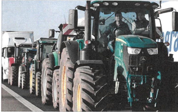
Decenas de tractores ayer en la carretera N-120 a la altura de Villadangos del Páramo en León.

«Cada vez nos están poniendo más impuestos, no podemos sembrar lo que queremos, el gasóleo está por las nubes, suben los fertilizantes y la cotización de la seguridad social la vamos a pagar según ingresemos y no es real la declaración de la renta», afirmó una agricultora, que tam-