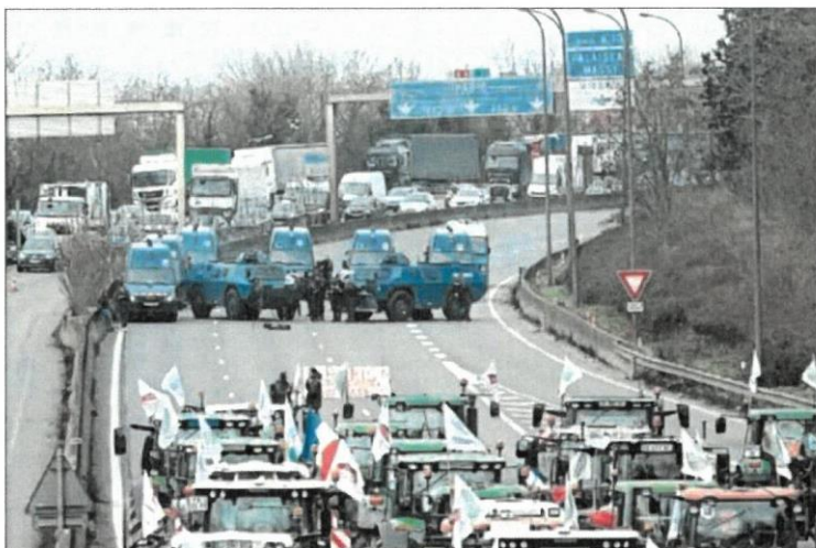
Tractores bloqueaban ayer la autopista A-6, a la altura de Chilly-Mazarin, cerca de París.