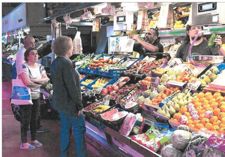
Un puesto de frutas y verduras frescas en el madrileño mercado de la Cebada.

El real decreto que tiene Teresa Ribera en el cajón desde finales del año pasado, cuando pasó el trámite de consulta pública, está incluido en el Plan Anual Normativo de 2024, elaborado por el Ministerio de la Presidencia. Fuentes de tanto del estado de tramitación de esta norma que actualizará el reglamento de reutilización de las aguas adelantan que el siguiente paso es la aprobación por parte del Consejo Asesor de Medioambiente, para su posterior debate en Consejo de Ministros. «Estamos en el último tramo de la tramitación y está todo en el aire por una cuestión de competencias. Esperamos que se haga un análisis serio y que la modificación salga adelante», concluye la responsable de Sostenibilidad de FIAB.