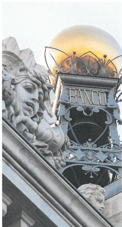
El Banco de España presentó ayer su informe de estabilidad financiera