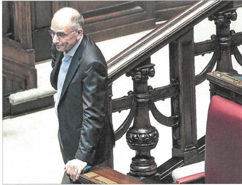
El ex primer ministro Enrico Letta en una sesión del Congreso en Italia el año.