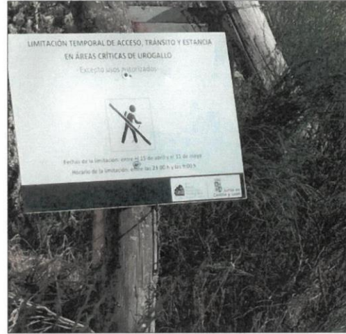
Cartel que limita el acceso a las zonas críticas del urogallo.

El pasado mes de octubre, Villablino acogía una jornada de presentación de los trabajos del programa para la recuperación. Según los últimos datos del proyecto de recuperación del urogallo cantábrico se estima la existencia de 190 ejemplares de la especie, de los que 130 son machos y 60, hembras, según la toma de muestras realizada en