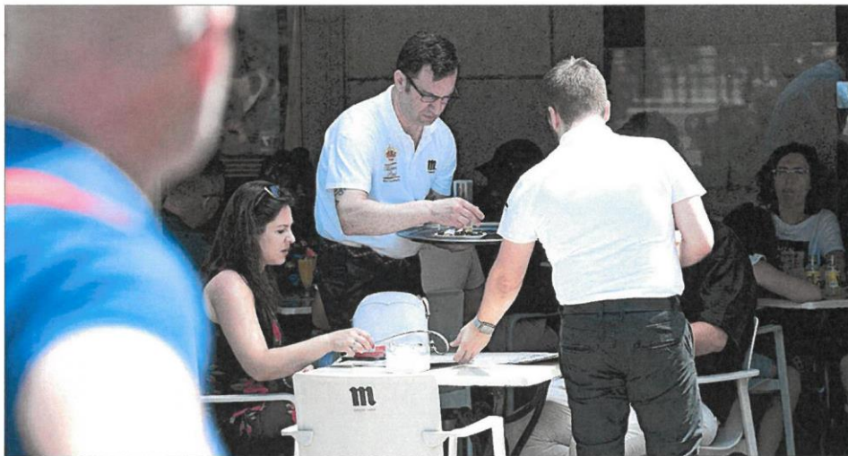
Camareros en una terraza de la calle Arenal, en Madrid. JAVI MARTÍNEZ

Y a los 40 años seréis unos viejos inútiles, que es para lo que os han preparado unos cuantos entrenadores que habéis tenido la mala suerte de encontraros por el camino.