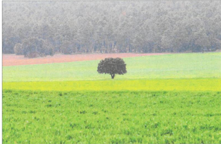
Los campos sorianos enseñan toda su gama de verdes gracias a las abundantes lluvias. MARIO TEJEDOR

Así, ante una previsión de bonanza de rendimientos, el agro contra-