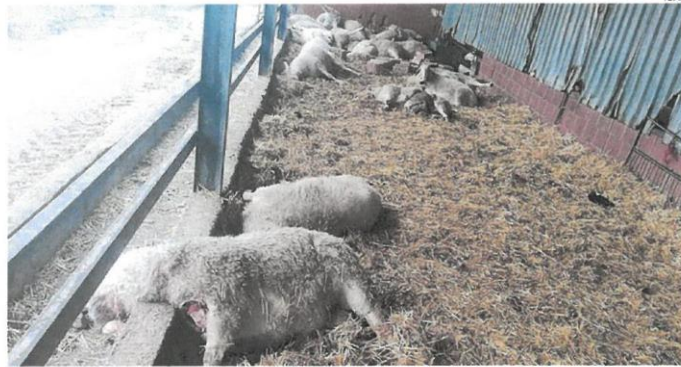
Varias ovejas muertas en una explotación ganadera de Zamora

Por este número de agresiones a la ganadería se presentaron 3.109