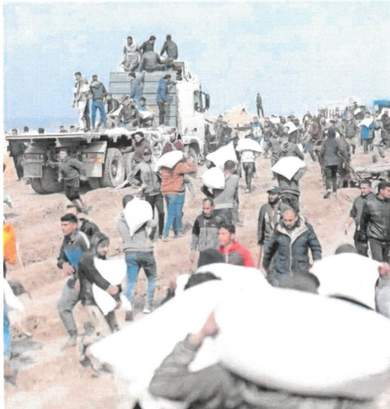
A la izquierda, una familia palestina repartía cebada entre sus ovejas el día 8 en Rafah, en el sur de la Franja. Arriba, palestinos cargaban sacos de harina en febrero.

tima la FAO. "Pero no hay nada para alimentarlos y muchos burros y vacas han muerto de hambre", matiza Zaqt.