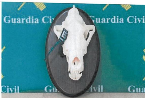
Cabeza de lobo incauta en la operación e la Guardia Civil // cc

En cuanto a la prevención de las picaduras por estos insectos, las autoridades sanitarias recuerdan la importancia de usar ropa y calzado adecuados durante las salidas al campo, así como transitar por caminos y utilizar repelentes tanto para las personas como para los animales de compañía. Asimismo, hay que insistir en que las garrapatas que se puedan haber fijado deben retirarse lo antes posible y de forma adecuada, preferentemente por profesionales sanitarios.