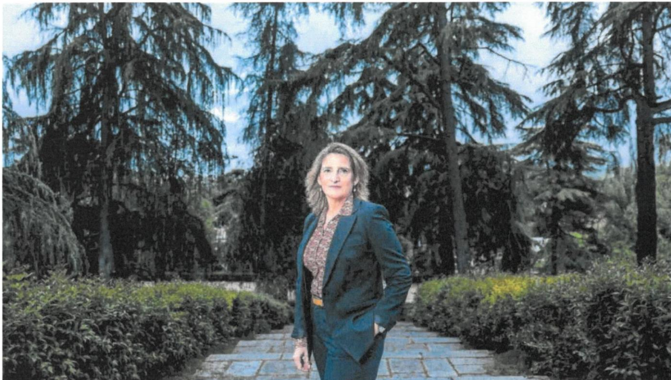
Teresa Ribera, ayer en el paseo del Pintor Rosales, en Madrid.

Teresa Ribera Ministra para la Transición Ecológica y vicepresidenta tercera