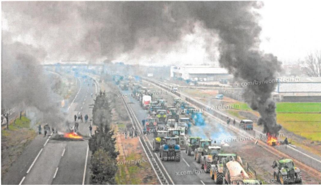
Tractores y grupos de agricultores cortaban ayer el tráfico en la A-2 en Mollerusa (Lleida).

Cultura Museos de EE UU devolverán restos humanos a los pueblos nativos —P40