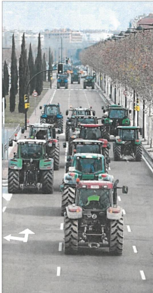
Centenares de tractores ocupando Zaragoza.

La acción de este tipo de grupúsculos plantea importantes problemas, no solamente debido a que actúan al margen de los cauces legales habituales para las protestas