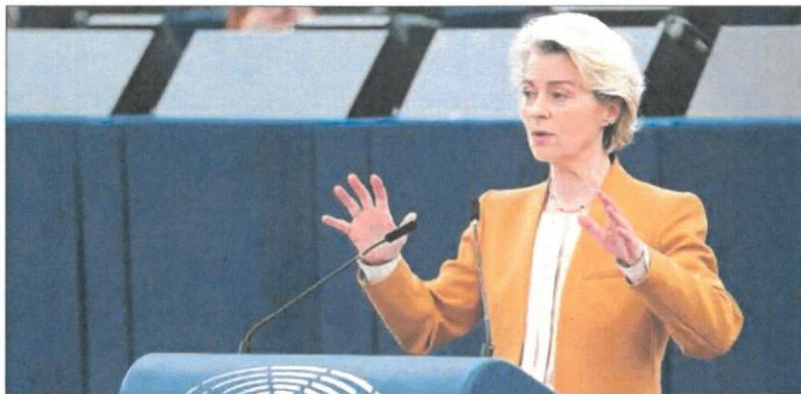
La presidenta de la Comisión Europea, Ursula von der Leyen.

El Ejecutivo comunitario propuso reducir los riesgos de los productos químicos utilizados en la agricultura, sin embargo, tal propuesta se ha "convertido en un símbolo de polarización", dijo la alemana en el pleno del Parlamento Europeo en Estrasburgo. Tras el rechazo en el Eurocámara y la falta de avances entre los Veintisiete Estados miembro, von der Leyen anunció que propondrá al Colegio de Comisarios retirar esta propuesta. Sin embargo, el tema, y la visión tras él, se mantendrá.