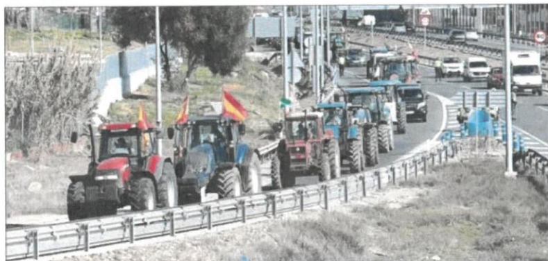
LAS PROTESTAS DEL CAMPO DESBORDAN LAS PREVISIONES. Las tractoradas convocadas por grandes terratenientes sin contar con las principales asociaciones agrarias superaron todas las previsiones y generaron graves problemas en diversas carreteras de toda España, centros logísticos y el puerto de Málaga. (1)