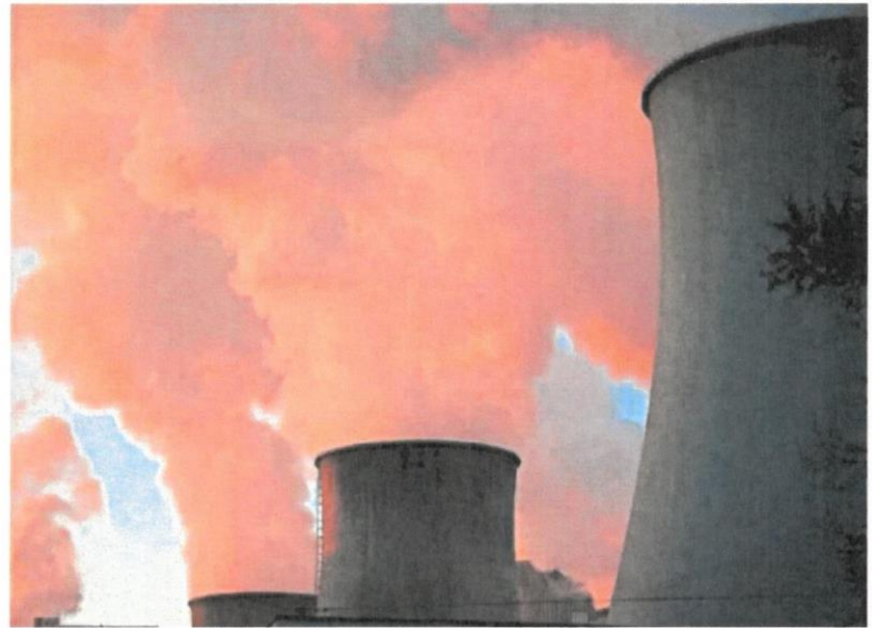
Nubes de humo y vapor en la central de Belchatow (Polonia), en noviembre.

El ministerio planteó llevar agua hasta Cataluña con barcos diarios, lo que supondría hasta siete hectómetros cúbicos a través del Puerto de Barcelona, que ya está acondicionado. El agua, que se llevaría desde Sagunto hasta Cataluña, vendría de la red de plantas desalinizadoras que tiene en la costa mediterránea Acuamed, dependiente de Transición Ecológica. El plan, que cuenta con el visto bueno de la Generalitat Valenciana (PP), prevé una frecuencia de dos barcos diarios cargados con agua rumbo a la capital catalana.