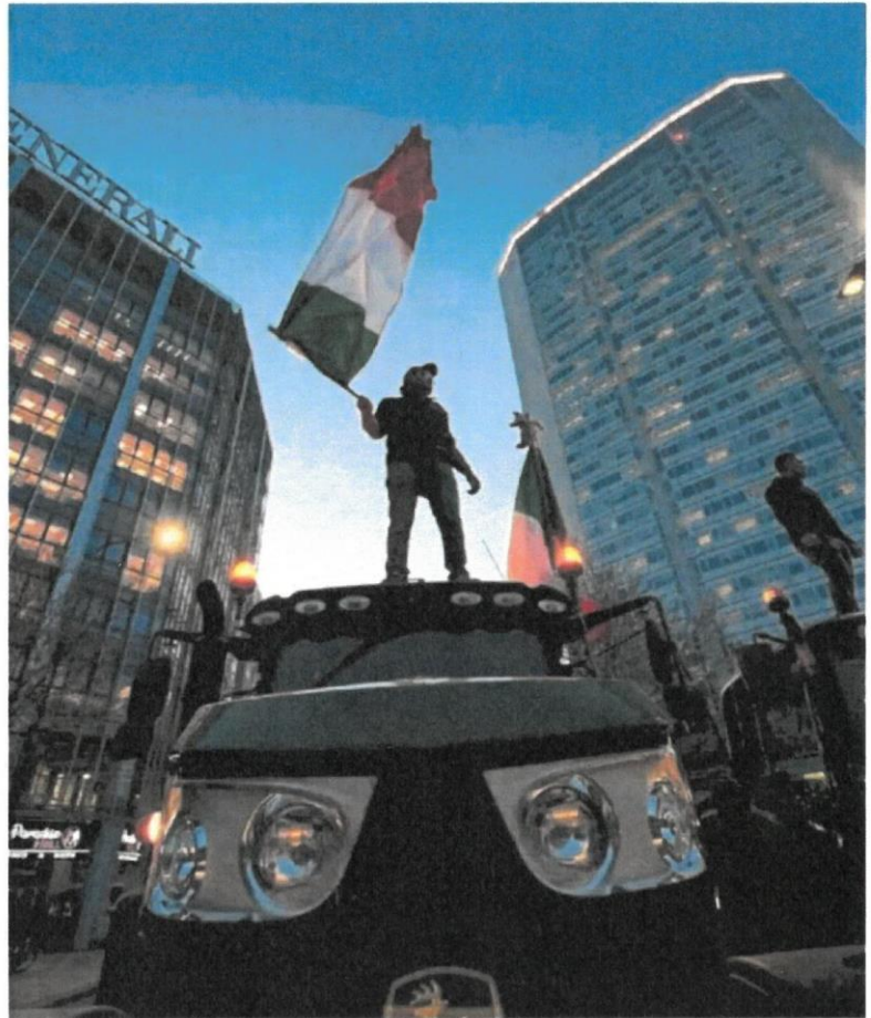
Protesta de agricultores con sus tractores, en Milán, el pasado jueves.

El plan pasaba primero por el control de consejo de administración de la RAI y, en un inicio, por la sustitución de los presentadores del evento. Pero no lo segundo se ha producido ni lo primero ha tenido la influencia suficiente para marcar el tono y la escaleta del certamen y Ama-