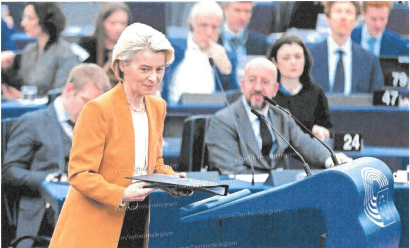
Ursula von der Leyen, ayer durante el debate en el Parlamento Europeo, en Estrasburgo.