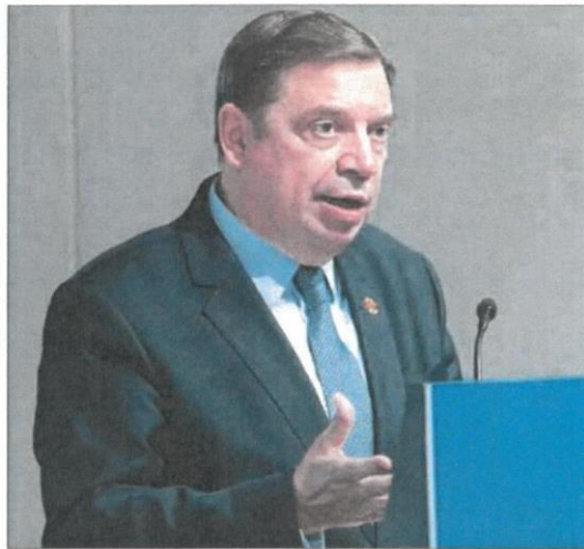
El ministro de Agricultura, Luis Planas. ALBERTO MARTÍN

Según Agricultura, estos recursos están destinados a los titulares de explotaciones agrícolas que perciban las ayudas directas de la Política Agrícola Común (PAC) en la campaña 2023 y que cuenten en su explotación con tierras de cultivo de secano, excluidos los pastos temporales.