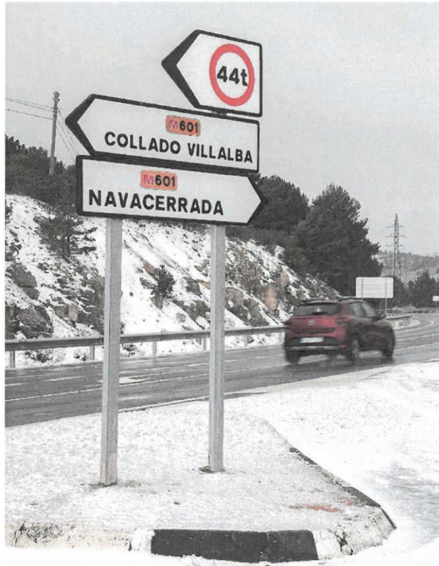
El sábado podría haber nevadas en zonas bajas de la mitad norte

origen marítimo polar» provocará un descenso térmico acusado, y la cota de nieve bajará hasta los 800-1.100 metros.