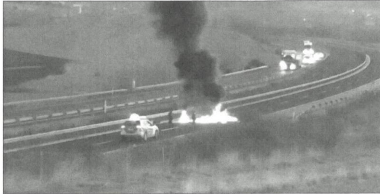
Barricada de neumáticos ardiendo en la AP-1, en Monasterio de Rodilla.