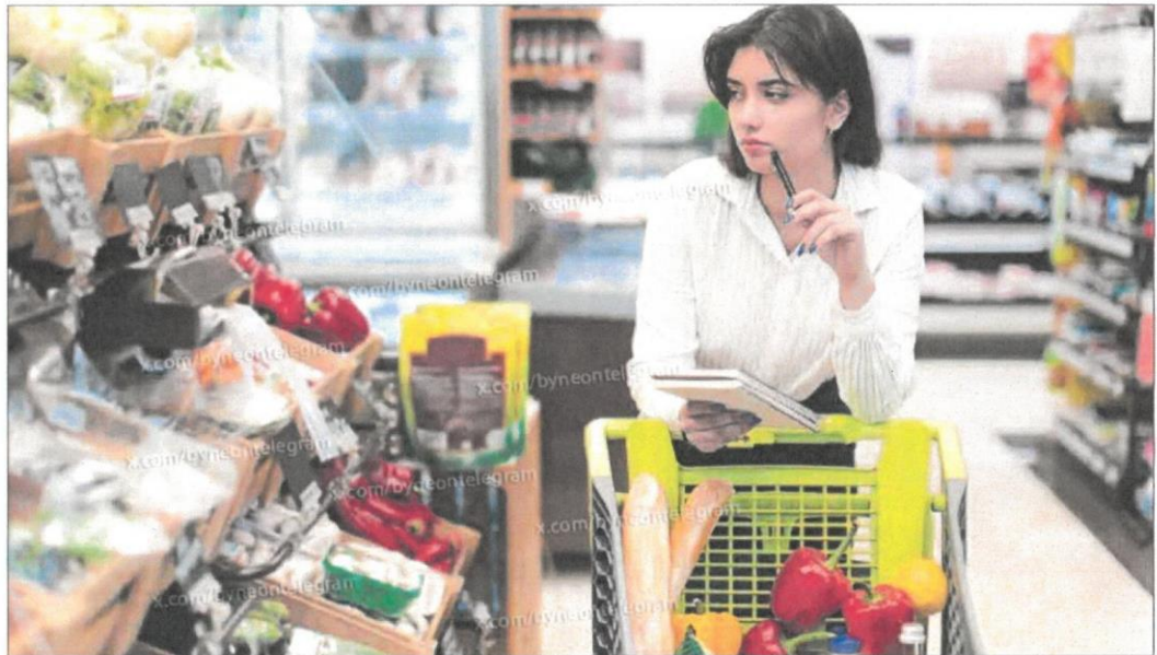
La cesta de la compra no ha dejado de encarecerse con unos precios que aún crecen a doble dígito en el campo.