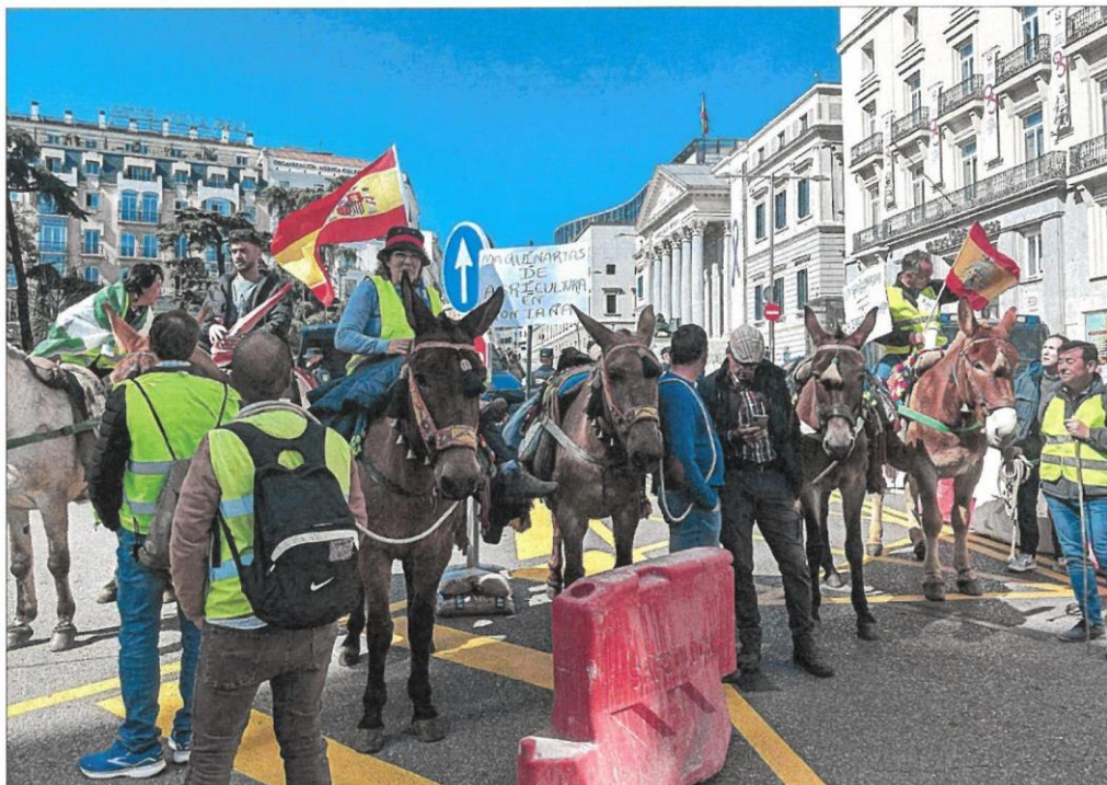
Una manifestación de agricultores a las puertas del Congreso de los Diputados, en Madrid.