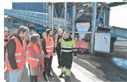
García-Gallardo visita Kronospan, en Salas de los Infantes

El vicepresidente ha destacado que el incremento de la inversión en materia de prevención de riesgos se ha articulado a través de una Estrategia de Seguridad, Salud y Bienestar Laboral «pionera en España» que incluye 100 medidas y seis líneas generales de actuación. Una Estrategia que ha incorporado a sus prioridades la de extender la prevención de riesgos laborales al mundo rural y al sector forestal.