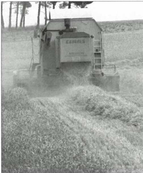
Una cosechadora recogiendo trigo. HDS