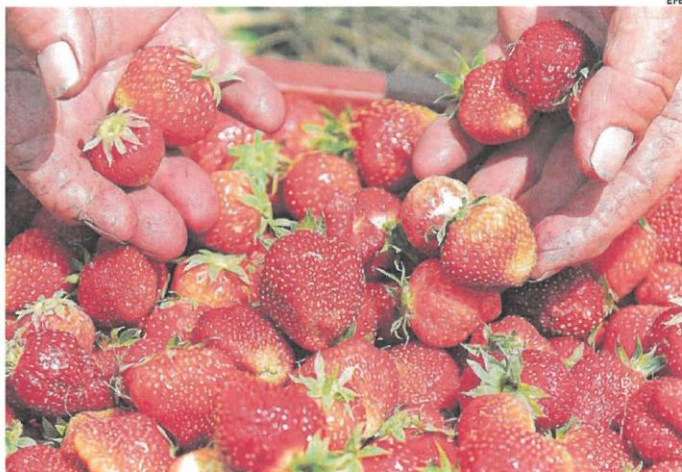
El lote de 1.500 kilos de fresas contaminadas entró por Algeciras el 19 de febrero