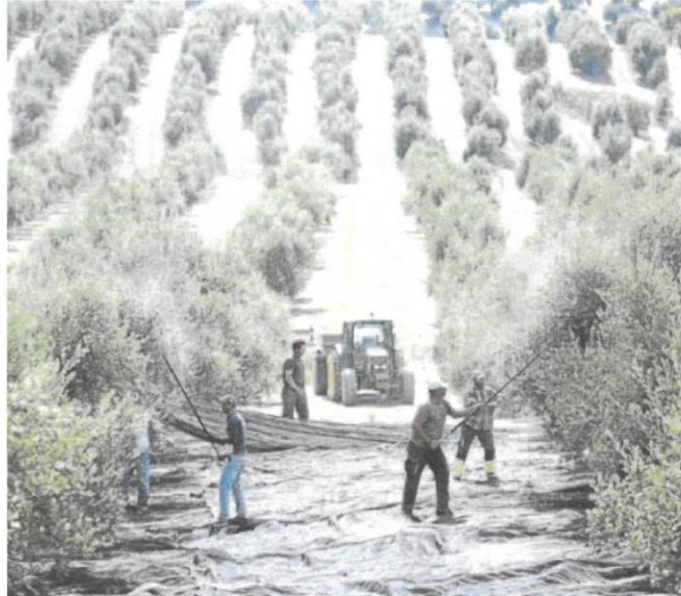
El campo es el sector que se verá más afectado por la reducción de la jornada laboral. ÓSCAR CHAMORRO

Una de las licencias que quieren establecer es que la entrada en vigor se retrase al menos unos meses para estos sectores, puesto que tendrían muy difícil poner ya este año en acción dicha disminución de jornada. El campo,