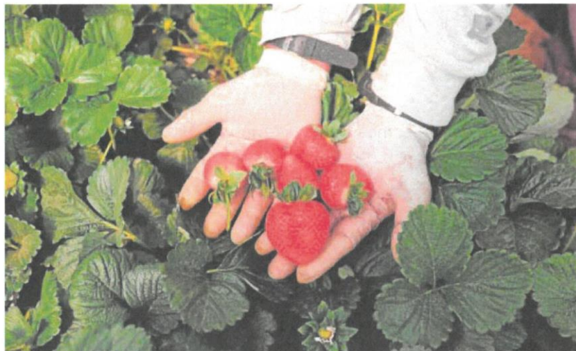
Un agricultor muestra las fresas en un invernadero de Huelva

COAG pide paralizar las importaciones de Marruecos de productos frescos. En el último año llevan más de 30 alertas