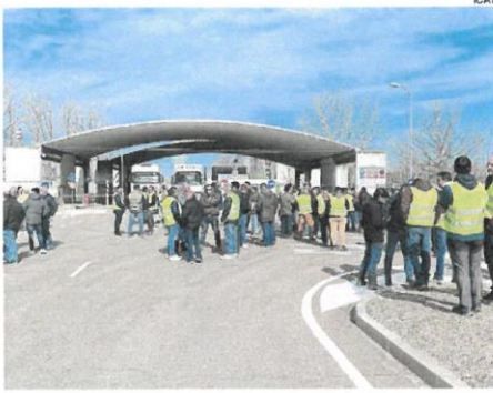
Concentración frente a la fábrica de bioetanol en Babilafuente