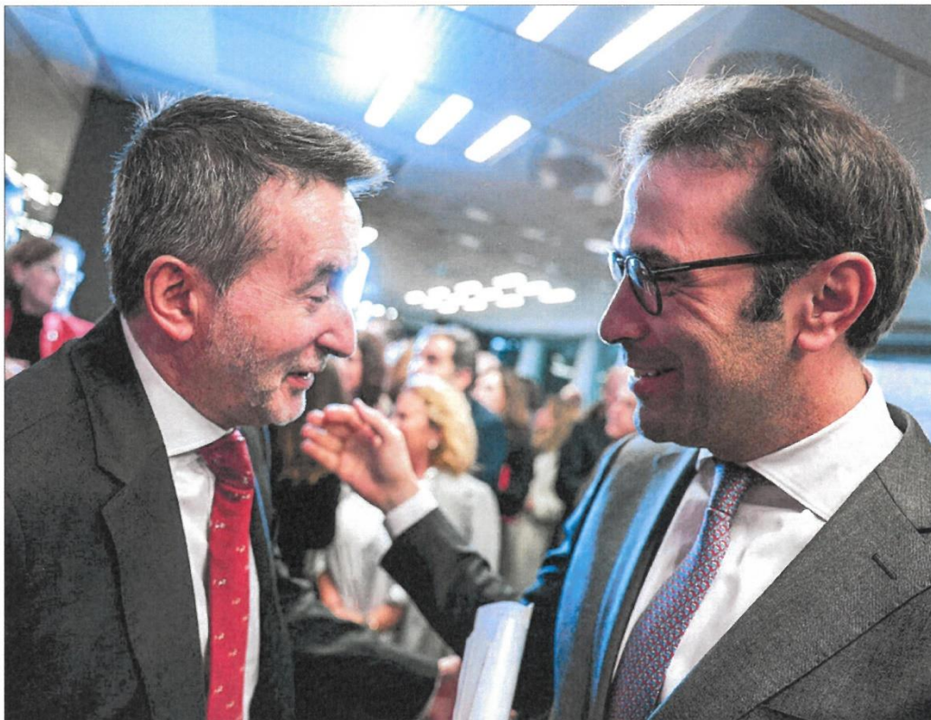
El CEO de Repsol, Josu Jon Imaz, y el ministro de Economía, Carlos Cuerpo, ayer en la toma de posesión del nuevo presidente de la CNMV.

El BCE eleva la probabilidad de un despliegue ineficaz de fondos