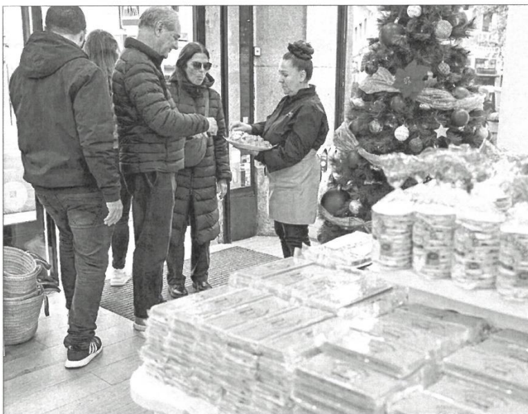
Interior de una tienda de turrón en Madrid. ÁNGEL NAVARRETE