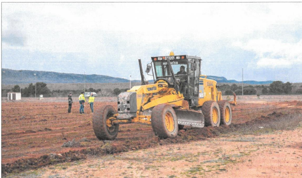
Trabajos de desbroce en la parcela del PEMA donde se instalará la empresa Maheso, dedicada a alimentos congelados. MARIO TEJEDOR