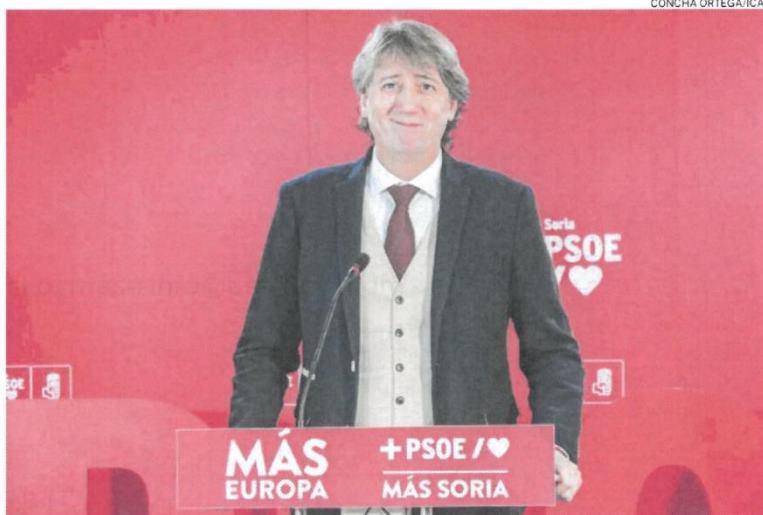
El todavía alcalde de Soria durante la rueda de prensa para presentar su candidatura

Durante su comparecencia hacía una defensa encendida del municipalismo y confesaba su ilusión por sacar adelante un proyecto que luchará por acabar con la