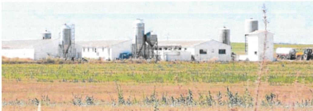
Granja de ganado porcino en la región.

Por su parte, Miguel Ángel Higuera, director de Anprogapor (Asociación Nacional de Productores de Ganado Porcino), se mostró en el momento de conocerse la iniciativa «súper indignado» pues aprecia que plantea que «no puedes hacer una granja, solo una bodega» por lo que «sentimos que Vox ha apuñalado al campo, ha vendido a los agricultores y ganaderos en favor de una bodega de Ribera».