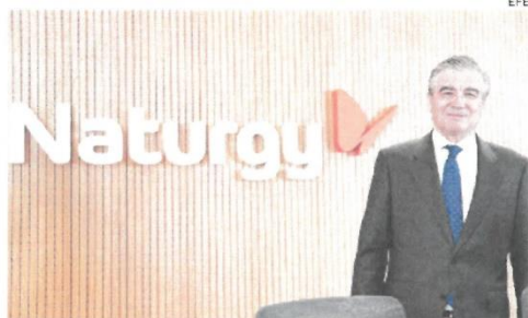
El presidente de Naturgy, Francisco Reynés

El biometano producido en estas plantas se distribuirá a través de las redes de distribución de gas natural existentes, tanto a hogares como a industrias, para ofrecerles una solución de descarbonización sin la necesidad de realizar inversiones adicionales en calderas e instalaciones.