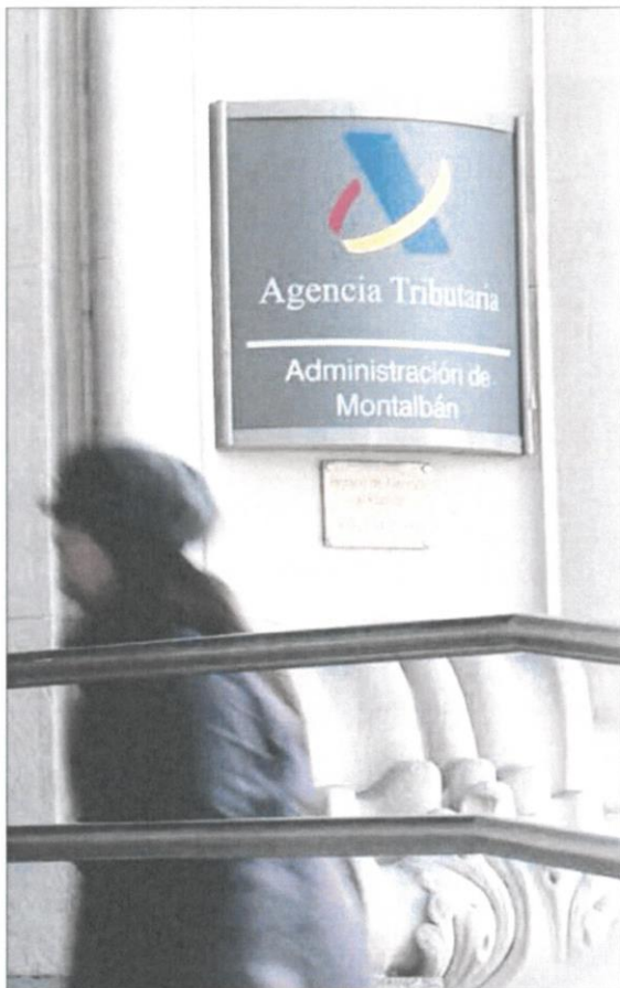
Una mujer entra a una administración de la Agencia Tributaria. (1)

La empresa recurrió la diligencia del fisco. El Tribunal Económico-Administrativo Regional de Andalucía dio la razón a la compañía y determinó que el fisco no puede pedir en una diligencia información