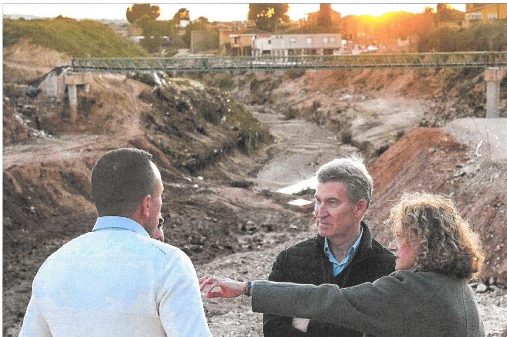
El presidente del PP, Alberto Núñez Feijóo, ayer en una visita al barranco de Torrent, en Valencia.

Eso, a juicio de los consejeros populares consultados ayer por este diario, es una buena medida, pero no soluciona el problema del «principio de eficacia». O sea, no permite que la normativa de una autonomía sea automáticamente válida en todo el territorio español. Una vez que las 12 comunidades del PP suscriban la Declaración de Asturias, en esas sí podrá serlo.