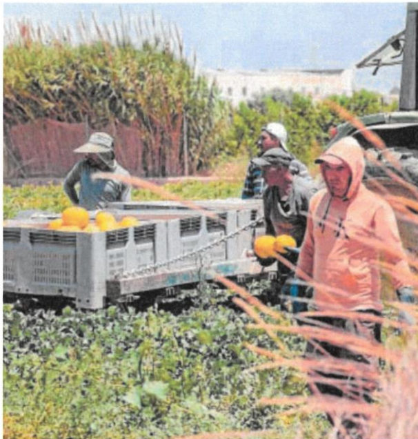
Temporeros en una explotación en Torre Pacheco (Murcia)

En diciembre del año pasado estos se apuntaron una victoria, cuando los populares lograron arrastrar a Junts -en buena medida por el peso del sector primario en Lérida- para que votara a favor de una enmienda que modificó el artículo del Estatuto de los Trabajadores referido a los contratos por circunstancias de la producción para añadirle el matiz «incluidas las campañas agrícolas». Anulado el voto particular del PSOE, esa enmienda -incluida en la ley del desperdicio alimentario- pasó al Senado, donde la mayoría popular introdujo otra modificación que elevó de 90 a 120 días el tope para contratar a alguien durante una campaña agrícola. Ya en marzo, el texto definitivo quedó aprobado en el Congreso, sin que el PSOE lograra convencer a Junts, uno de sus socios habituales, para que tumbara