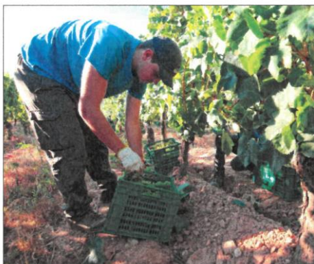
Comienzo de la vendimia en el Palacio de Canedo.