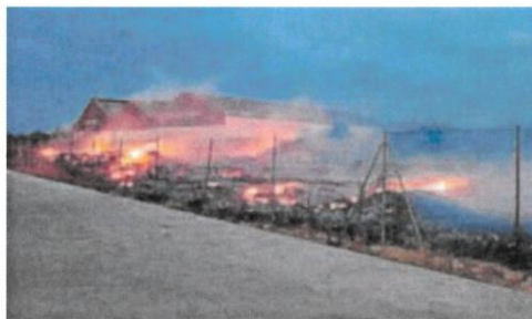
Incendio de alfalfa esparcida sobre un terreno en Villamartín.