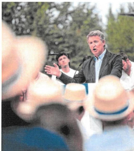
Alberto Núñez Feijóo, en un mitin en Arganda del Rey (Madrid)

En el entorno de Feijóo niegan que haya preocupación por esa subida de moscóptica de su rival en la derecha mientras la suma de ambos se mantenga tan fuerte como lo está ahora (rondando los 200 escaños en los son-