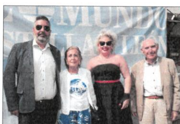
Representantes de Cartiff.