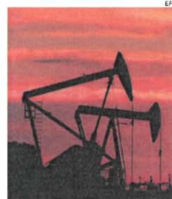
Los precios previsiblemente bajarán

Aunque la OPEP indicó en su comunicado la buena situación de la economía global, los analistas apuntan que los precios cayeron esta pasada semana por la preocupación por la demanda en Estados Unidos, mientras los riesgos geopolíticos y comer-