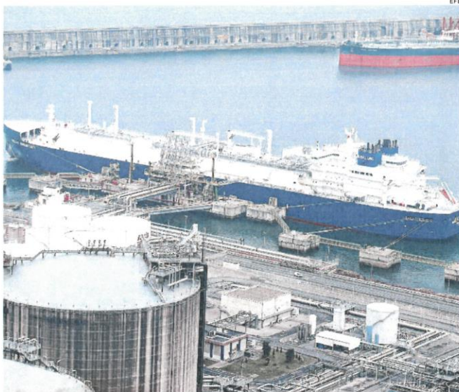
Por delante de Rusia como suministrador de gas se sitúan Argelia, Estados Unidos, Angola y Nigeria