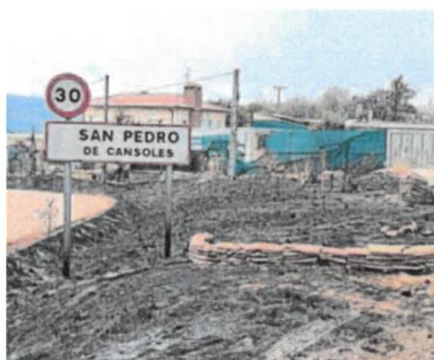
Las llamas devastaron el pueblo de San Pedro de Cansoles.

Para hacer frente a esos cuatro incendios, la Diputación de Palencia desplegó un operativo «sin precedentes», con la participación de más de 70 bombe-