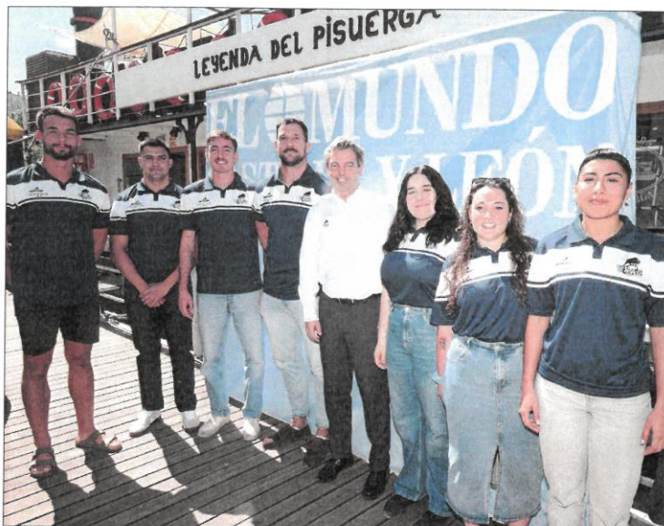
Miembros del equipo de rugby VRAC.