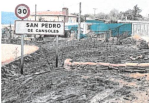
Las llamas devastaron el pueblo de San Pedro de Cansoles. J. C. DIEZ

Para hacer frente a esos cuatro incendios, la Diputación de Palencia desplegó un operativo «sin precedentes», con la participación de más de 70 bombe-