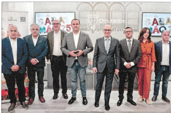
El presidente de la Diputación de Salamanca, Javier Iglesias, hizo ayer balance de la feria salmantina. ICAI.