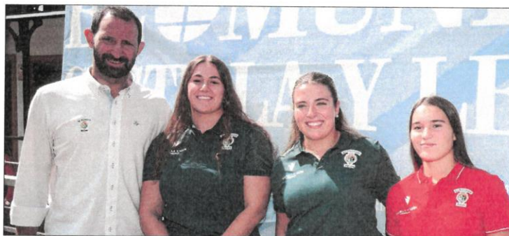
Miembros del equipo de rugby El Salvador.