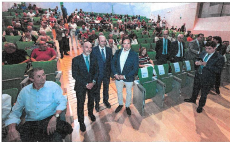
La Fundación Caja Rural de Burgos celebró ayer su Aula Agraria en el Fórum Evolución. TOMÁS ALONSO

Sin salir del apartado de novedades, el director general de Desarrollo Rural destacó la «simplificación administrativa». De esta forma, se facilitará la declaración de los expedientes y, además, se han actualizado los módulos y los costes de referencia. Precisamente, para establecer esos valores de mercado -algo «muy demandado por los agriculto-