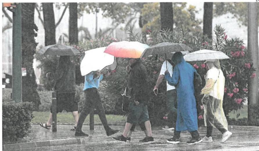
En Mallorca, además de los chubascos y tormentas, se registraron ayer rachas de viento de hasta 91 km/h

Las zonas más afectadas por el calor fueron el interior de Galicia, la cordillera Cantábrica, ambas mesetas, norte y centro de Extremadura, centro de Andalucía y Comunidad Valenciana. En lo que respecta al noroeste peninsular, las temperaturas estuvieron entre 2,5 y 3,5°C por encima de lo normal. En cuanto a temperaturas máximas registradas, Jerez de la Frontera alcanzó los 45,8°C el día 17 de agosto, siendo la más alta entre las estaciones principales; seguida por Morón de la Frontera (45,2°C el 17 de agosto); y Murcia, que llegó a los 45,1°C el 18 de agosto. En contraste, las temperaturas mínimas más bajas se registraron en Puerto de Navacerrada, con 5,3°C el día 29.