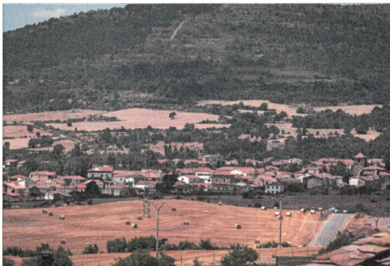
Gallinero, localidad para la que estaba prevista una de las obras del Plan de Sequía.

Por otra parte, la Junta de Gobierno aprobó un gasto adicional de 40.853 euros para modificar el contrato de la obra de eficiencia energé-