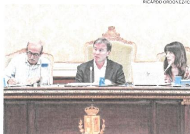
El presidente de la Diputación burgalesa durante el debate

Finalmente, la vicepresidenta destacaba la rapidez con la que se dictaron órdenes de emergencia y la ayuda a los afectados.