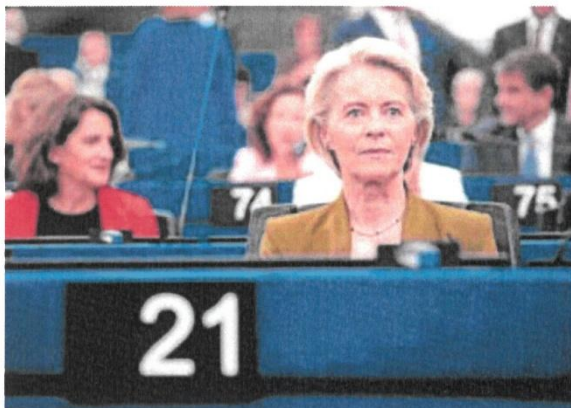
La presidenta de la Comisión, Ursula von der Leyen