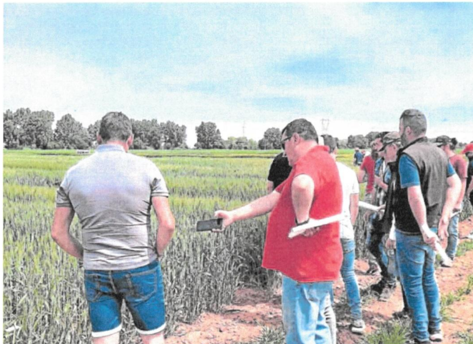
Un grupo de agricultores visita la parcela experimental de trigo blando del Itacyl en la Finca de Zamadueñas. E. M.

Son necesarios los resultados como mínimo de dos campañas para tener datos concluyentes sobre las variedades