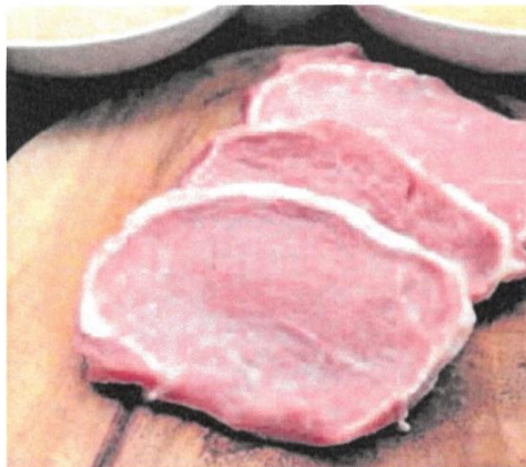
La carne de cerdo tendrá unos aranceles provisionales del 20%. E. N.

El ganadero de porcino considera que «lo peor» de la situación actual es «la incertidumbre» sobre las imposiciones, por lo que ve mejor que «termine esta película, que nos digan qué aranceles nos han impuesto, y así saber cómo tenemos que organizarnos». En esta línea, apunta a que ya hay algunas empresas