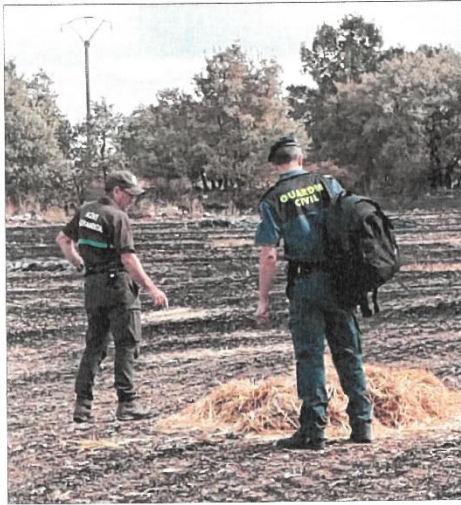
Un Guardia Civil y un agente medio ambiental inspeccionan la zona.

El incendio forestal en esta pedanía perteneciente al municipio de Alfaro de Quintanadueñas, a 14 kilómetros de Burgos, obligó a movilizar al cuerpo de bomberos de la capital burgalesa para sofocarlo. Cabe señalar que ese día 17 de agosto varios incendios de grandes proporciones estaban poniendo en jaque a los medios de extinción en toda Castilla y León y el servicio de Emergencias autonómico había realizado una petición expresa al Ayuntamiento de Burgos para que los bomberos municipales acudieran a ayudar a apagar un fuego en la zona de Guardo, en Palencia. Apenas media hora después de la solicitud del tte estaba preparada para partir desde Burgos hacia el fuego