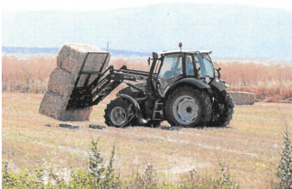
Un tractor deposita varias balas de paja en un campo cerca de Segovia.