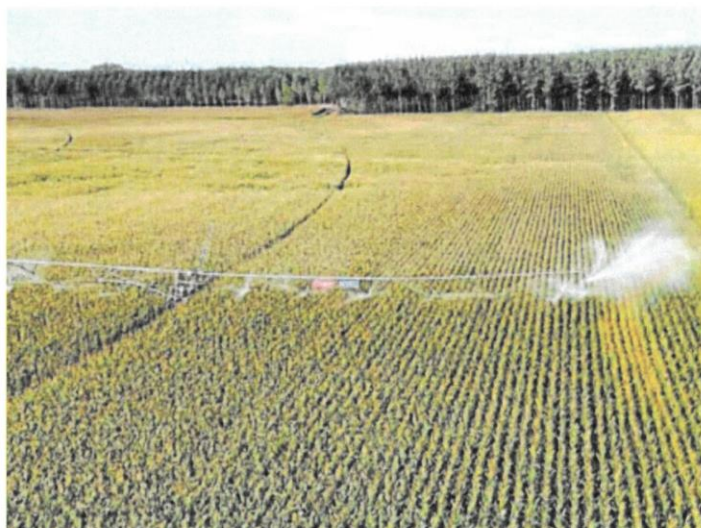
Riego en una parcela cultivada de maíz en la provincia de León.