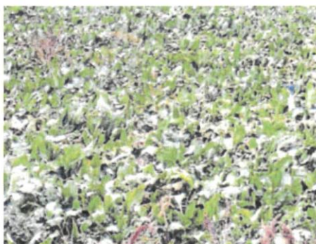
Uno de los cultivos de remolacha.

La organización agraria denuncia que las restricciones en el uso de fitosanitarios han mermado los rendimientos, mientras que las ayudas, aunque existen, no compensan las pérdidas. «Los costes de producción son altísimos y con estos precios no se puede seguir.