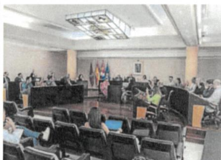
Un momento del pleno celebrado en la Diputación.