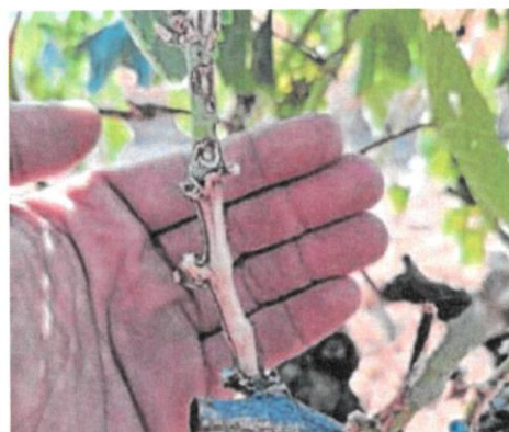
Daños en el viñedo causados por los topillos.

Desde la organización agraria se muestran confiados en que la Junta de Castilla y León tome nota de su petición y, al igual que la campaña pasada, adopte «medidas