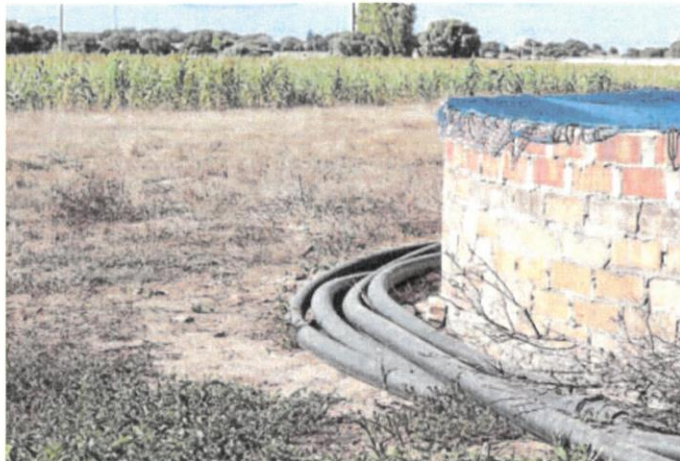
Pozo ubicado en uno de los campos segovianos.