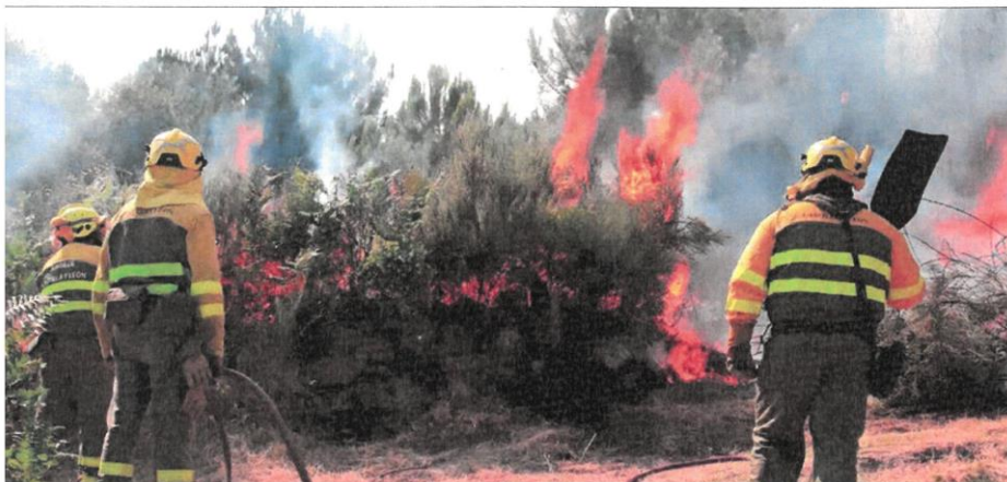
o fuego técnico como herramienta de combate de extinción en las inmediaciones del Arenal (Ávila). ICAI