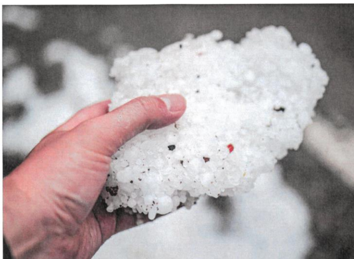
Granizada de esta primavera en la provincia. MARIO TEJEDOR

Y es que Agrosseguro ha recibido hasta el momento 80.926 hectáreas declaradas con siniestro en Soria, más del 97% a causa de los fenómenos tormentosos, una elevada siniestralidad, un pedrisco que además en una cuarta parte de esta superficie se ha cebado en varias ocasiones. Porque hay 13.357 hectáreas cuyos productores han abierto expedientes más de una vez. El pedrisco empezó muy pronto, a primeros de mayo, y cayó sobre plantas sin espigar, después además de una primavera muy lluviosa que no dejó trabajar en las fincas desde marzo para el abonado de cobertura, de modo que en