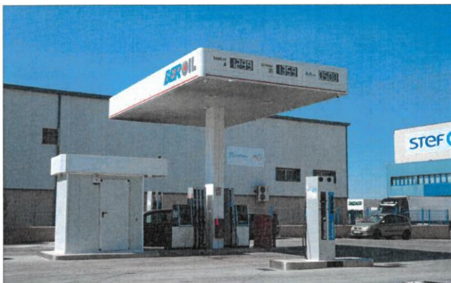
La estación de servicio Beroil, con la gasolina más barata de la provincia de Valladolid.

La diferencia de precio es notable al comparar éstas con las gasolineras más caras. La que tiene el mayor coste se encuentra en Burgos con 1,75 euros el litro de gasolina 95. Se trata de una estación de servicio de Urlave que se encuentra en la Carretera Nacional 1 que une la capital burgalesa con Miranda de Ebro. En un escalón muy similar se encuentra otra en León al cobrar a 1,729 euros el litro de gasolina a sus clientes. Es de la compañía Campsa y se encuentra en Sañe de Rueda, un municipio en plena nacional N-635. Precisamente, esta misma gasolinera también tiene el gasóleo A más caro de la provincia leonesa con 1,599 euros por cada litro.