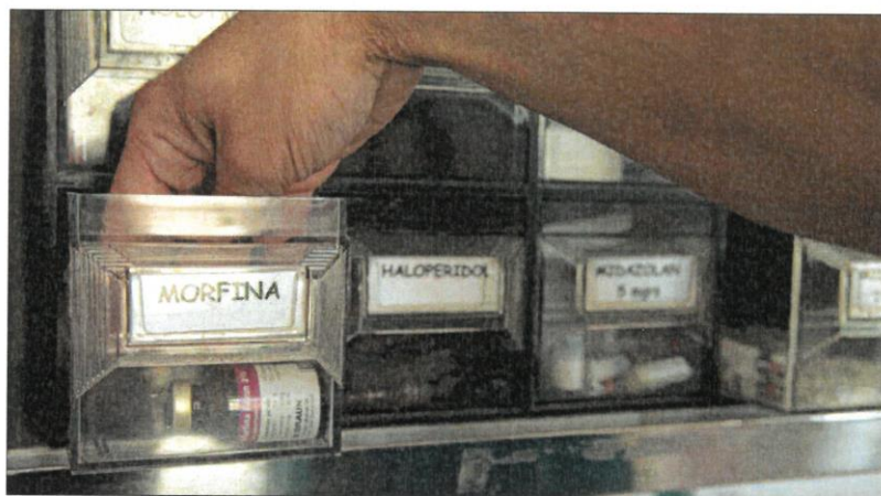
Un enfermero coge una dosis de morfina para un paciente.