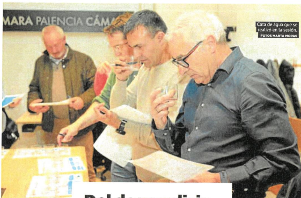
Cata de agua que se realizó en la sesión.