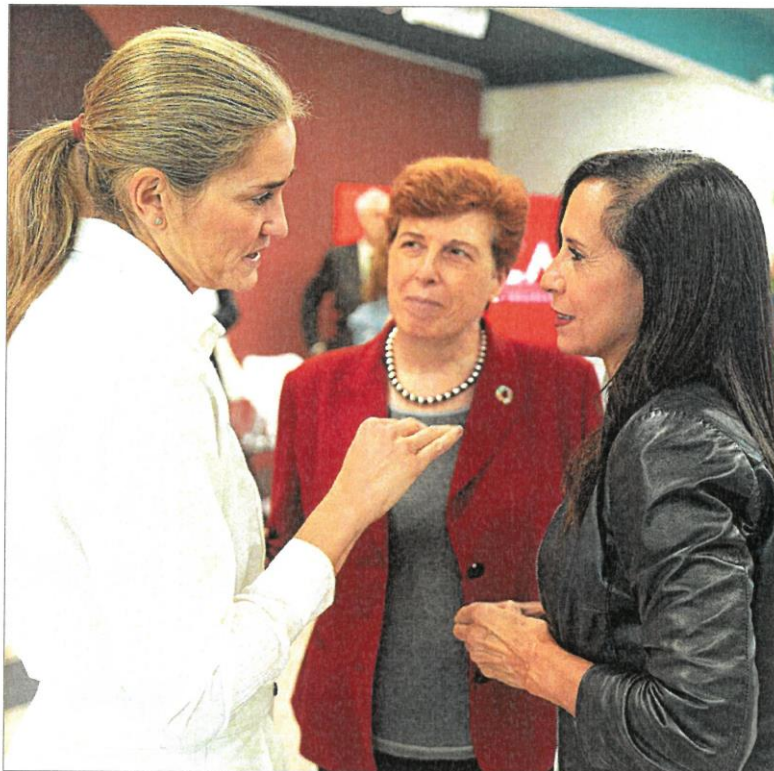
La ministra de Transición Ecológica, Sara Aagesen, y la presidenta de Redeia, Beatriz Corredor.

Por ello, el aumento de los vertidos no solo evidencia la creciente dificultad del sistema eléctrico español para gestionar toda la energía renovable que se produce, frente a una demanda que no crece al mismo ritmo. También está poniendo en apuros económicos a las plantas fotovoltaicas y eólicas, que son, precisamente, las dos fuentes de energía que están ayudando a