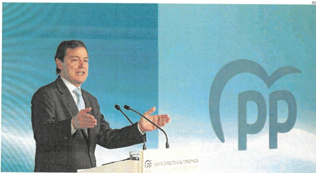
El presidente del PP durante la Junta directiva de la formación celebrada el pasado viernes en Valladolid