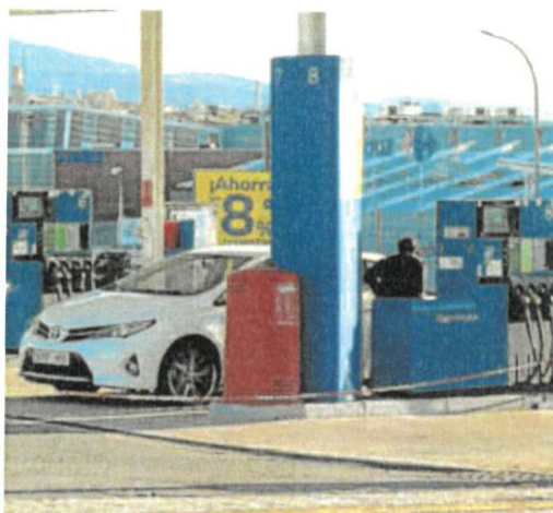
Un vehículo acude a repostar a una gasolinera.

El informe elaborado por la Organización de Consumidores y Usuarios (OCU) advertía de que llenar el depósito de un coche conllevaba un desembolso de más de 62 euros de media. Por ello, muchos segovianos decidieron esperar a la entrada en vigor del plan anticrisis, que supuso la caída de los valores que