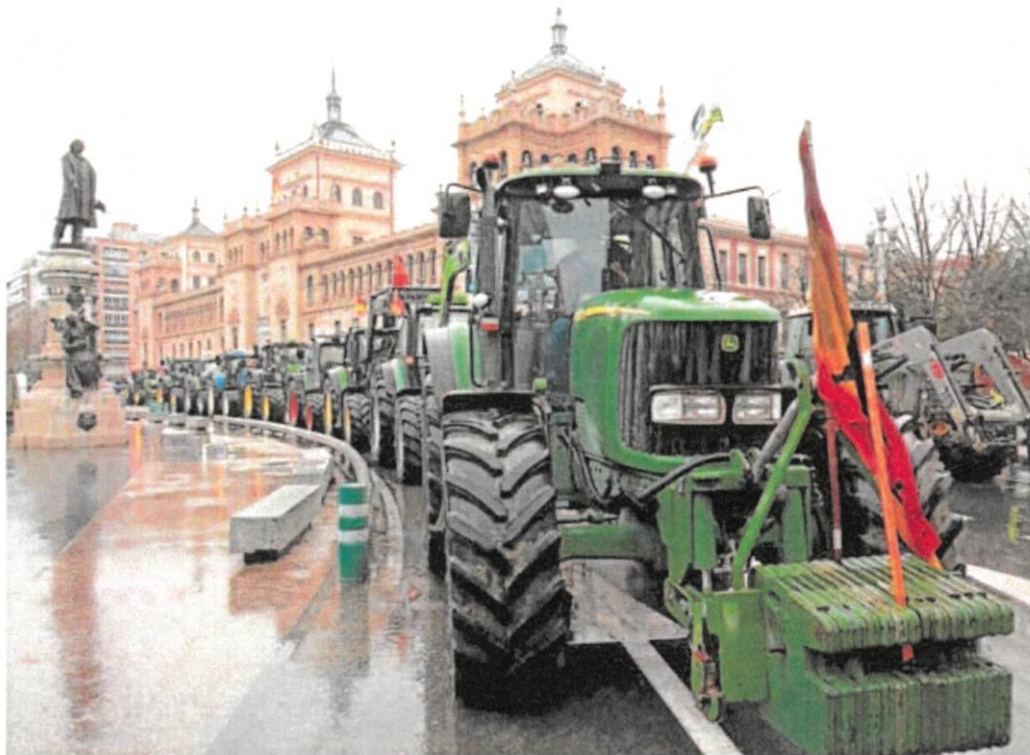
Tractorada celebrada el pasado 29 de enero en Valladolid.

El pasado 17 de marzo, las organizaciones también se movilizaron por el precio del gasóleo.