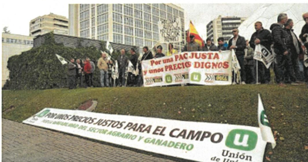
Concentración de agricultores en Valladolid el pasado mes de noviembre para exigir unos precios justos.

Las organizaciones agrarias reclaman actuaciones «políticas, arancelarias y fiscales» ante la distorsión de los mercados por los grandes conflictos bélicos