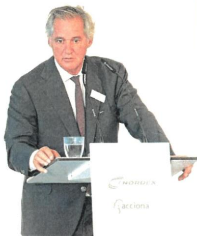
José Manuel Entrecanales, presidente de Acciona

señaló que, por el momento, Acciona no contempla aumentar su participación en Nordex, que cuenta con una capitalización bursátil de 11.500 millones de euros, tras revalorizarse la acción un 167,58% en cinco años.