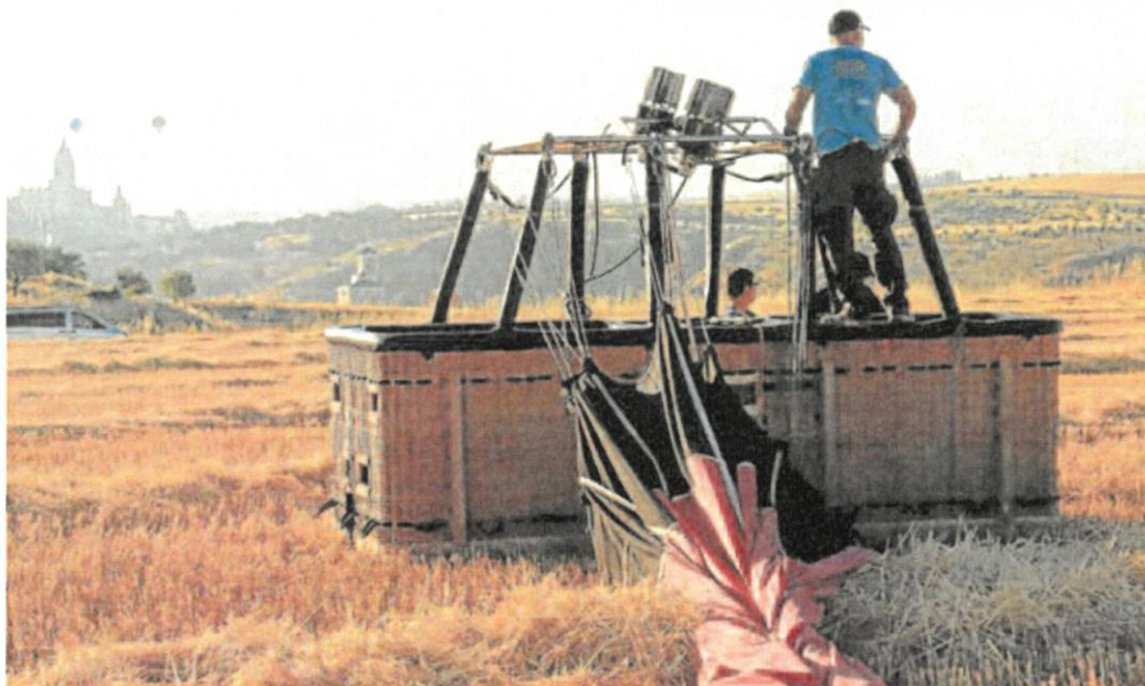
Cesta de un globo aerostático en la zona de despegue cercana a la capital segoviana, junto a la carretera de Arévalo.

UCCL considera que las denuncias, aunque necesarias, no están resultando una solución efectiva