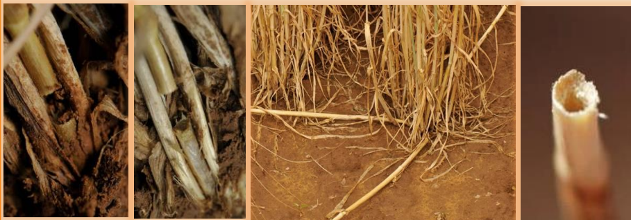
Cortes en la base de los planta, detalle de la sección y tallos caídos