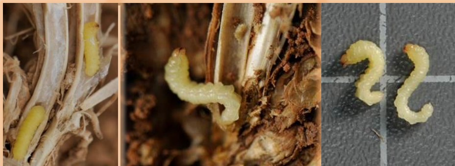
Larvas extraídas del tallo y forma típica en S que adquieren