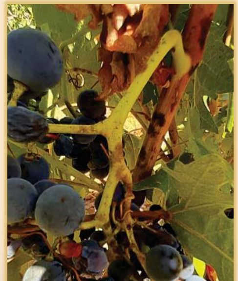
Arriba: polvillo blanquecino en hoja (haz y envés).