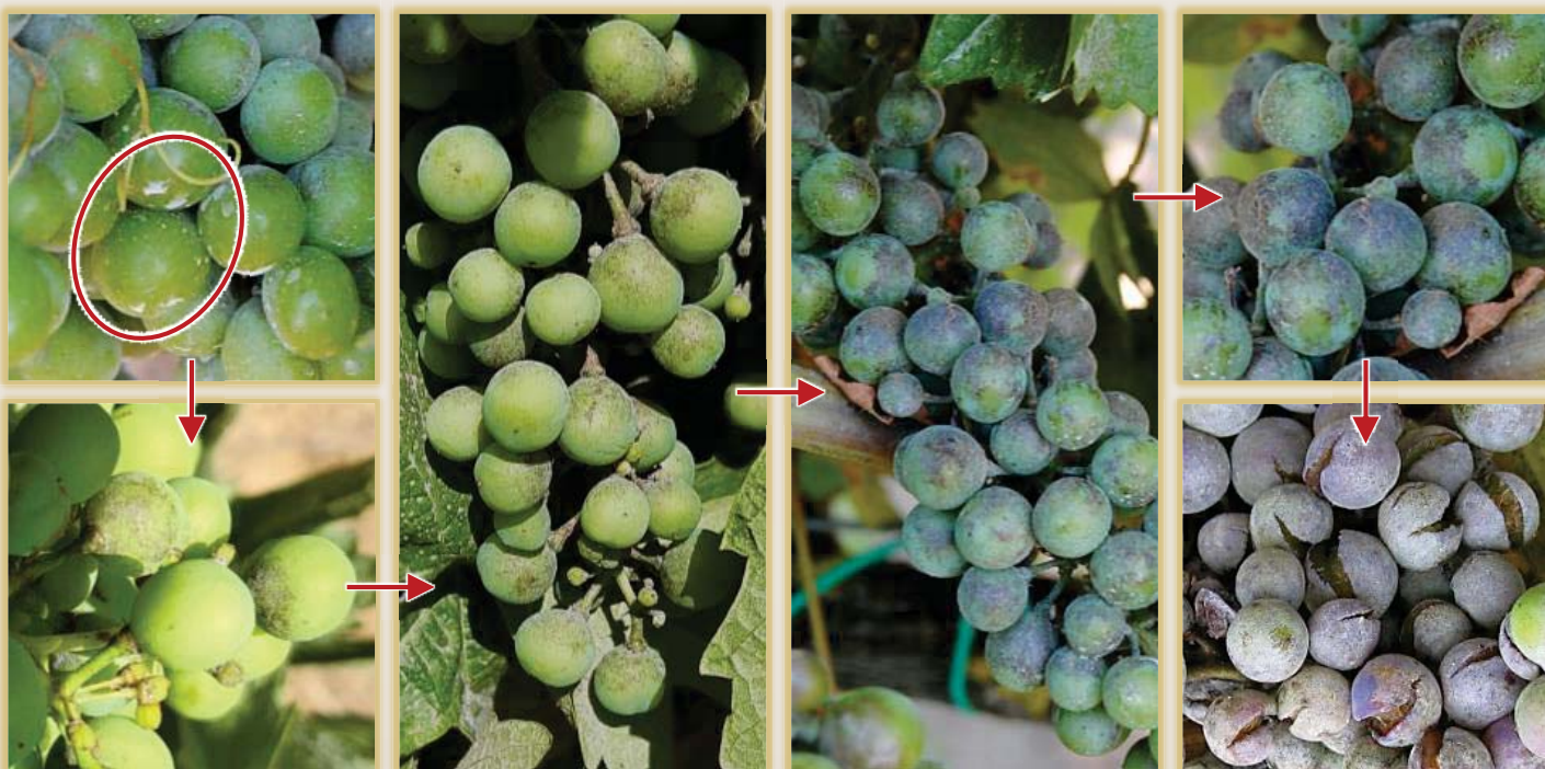
Evolución de la sintomatología en racimo